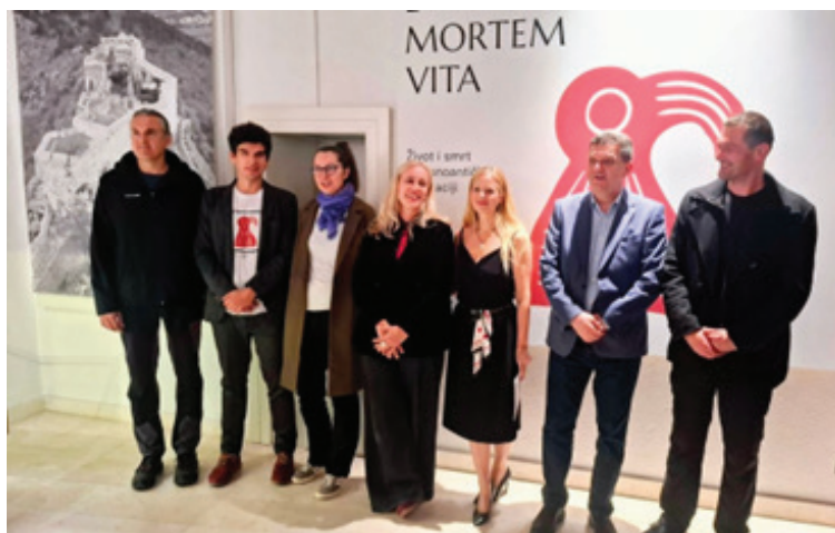
Slika 1: Otvaranje izložbe Et post mortem vita – Život i smrt u kasnoantičkoj Dalmaciji (Marko Sinobad, Ante Alajbeg, Branka Milošević Zakić, Nikolina Uroda, Jana Škrgulja, Miro Katić, Goran Mrnjavac)