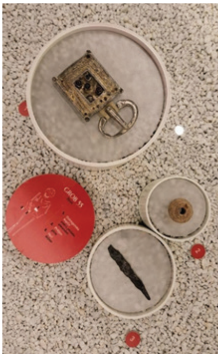
Slika 5: Inventar groba 55

trgovačke veze, svjedoči o strateškim i vojnim promjenama, ali i o suživotu različitih tradicija na lokalitetu koji je jedan od najznačajnijih svjedoka svakodnevice tzv. vremena seobe naroda.