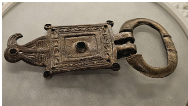
Slika 4: Pojasna kopča iz groba 50 (snimio Hrvoje Gunjača)

simboliku i kod Germana, ali i u samom Rimskom Carstvu. Ptice grabljivice, ponajprije orlovi, na ostrogotskom se nakitu javljaju kao simbol moći i pobjede. Nošenjem kopče s prikazom orla među starosjedilačkim stanovništvom, ova je stanovnica kasnoantičkog Knina naglašavala svoj drukčiji identitet, odnosno povezanost s ratničkom skupinom Ostrogota koja je ovladala srcem Rimskog Carstva, a u kojem su orlovi, kao svete ptice, oduvijek bili simbolom samog Carstva i njegovih legija.