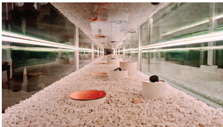
Slika 2: Pogled unutar vitrina na grobne cjeline

znanstvenoj i stručnoj literaturi 80-ih i 90-ih godina, a na izložbi su, po prvi puta, prikazani nalazi iz 28 grobova, i to predstavljeni kao grobne cjeline. Izloženi nalazi uglavnom se odnose na dijelove nošnje i osobne predmete pokopanog stanovništva nekadašnjeg kninskog područja. Osim tih nalaza, na izložbi su predstavljeni i nalazi s drugih lokaliteta s područja Dalmacije koji nose germanska obilježja, ali i nalazi starosjedilačkog romaniziranog stanovništva s osobitim naglaskom na predmete s kršćanskom simbolikom. Predmeti s kršćanskom simbolikom, poput fibula, prstenja ili kopči, označavali su vjersku pripadnost vlasnika, ali su mogli služiti i