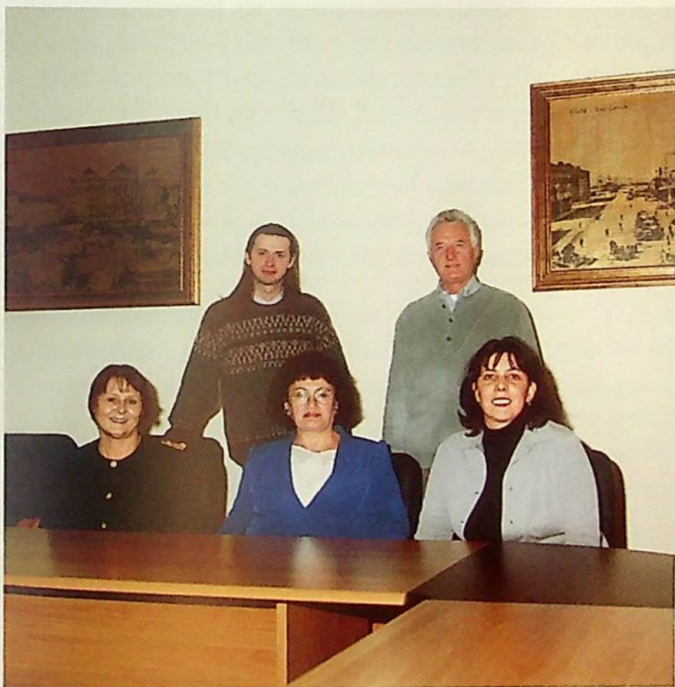
Djelatnice i djelatnici knjižnice, skriptarnice i CARneta