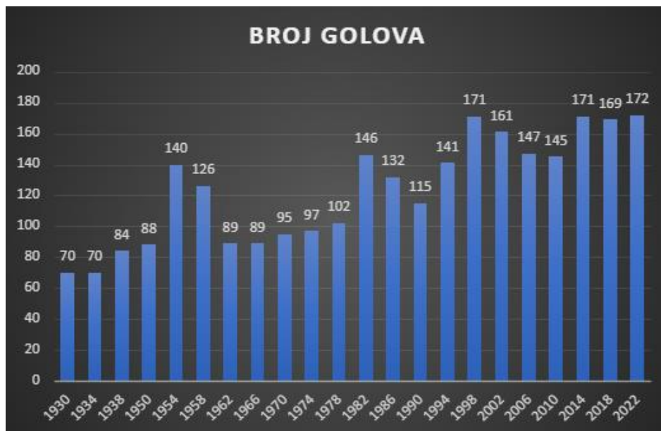
Grafikon 4: Broj golova SP-a od 1930.-2022.

dok je najmanji broj golova, 70, postignut na prvenstvima u Urugvaju 1930. te Italiji 1934.