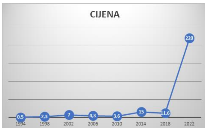
Grafikon 2: Troškovi organizacije svjetskih nogometnih prvenstava od 1994.-2022.

U nastavku, u Grafikonu 2, ilustrirani su troškovi posljednjih osam svjetskih nogometnih prvenstava.