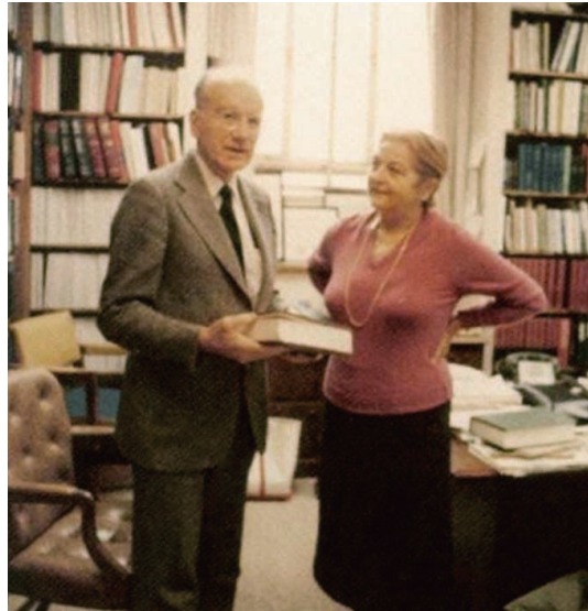
Slika 2. Osobni dar Victora A. McKusicka - XI. izdanje knjige "Mendelian Inheritance of Man".

sljednosti boje kravljeg krzna, a kao mladi liječnik 1949. u New England Journal of Medicine objavio je zajedno s H. Jeghersom članak o Peutzovom sindromu, tvrdeći da se sigurno radi o autosomno-recesivnom sindromu. I kao kardiolog, McKusick je uvijek tražio kod srčanih bolesnika probleme vezane za nasljednost, pa 1955. godine objavljuje u uglednom listu Circulation 4 članak o Marfanovu sindromu i razlozima česte srčane smrti tih bolesnika. Navedenom publikacijom nije utvrdio samo uzrok smrti (dilatacija i disekcija luka