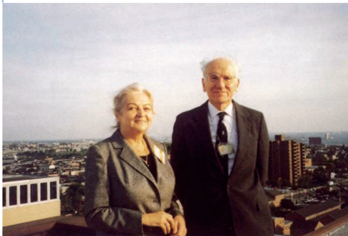
Slika 3. Široki pogled na Baltimore s bolnice John Hopkins parafraza je širine McKusickova pogleda na život... "I am keeping an open mind about it."

Amisha starosjedilaca, nizozemskih doseljenika u Pensilvaniju, među kojima je zbog konsangvinih brakova bilo i mnogo autosomno-recesivnih bolesti, već fenotipski uočljivih. Istražujući populaciju Amisha koju je pratio čitavog svog profesionalnog života, još 1964. godine otkriva učestalost malih ljudi 8 , te 1978. objavljuje i opširnu studiju "Medical Genetics Studies of the Amish", čime daje poriv za početak genetičko-populacijskog ispitivanja i u mnogim drugim izolatima u svijetu, pa i u nas (npr. otoci Susak i Krk) 9 .