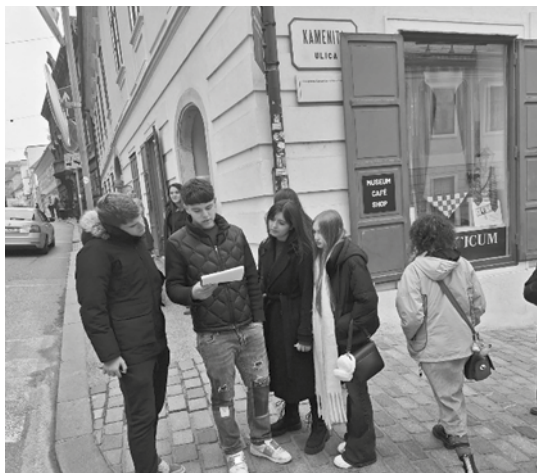
Fotografija 1: Učenci podijeljeni u grupama rješavaju zadatak

različitih škola. Mobitele su za vrijeme aktivnosti ostavili kod svojih nastavnika budući im oni nisu trebali. Velika većina odgovora na pitanja nalazila se u njihovoj okolini – u imenima ulica i trgova, na spomen-pločama i fasadama zgrada. Upozoreni su da paze kako i gdje hodaju budući su ulice Gornjega grada nerijetko uske i ima vrlo malo mjesta za prolaz pješaka, a automobilskeg prometa ne nedostaje. Za rješavanje zadatka imali su dva sata.