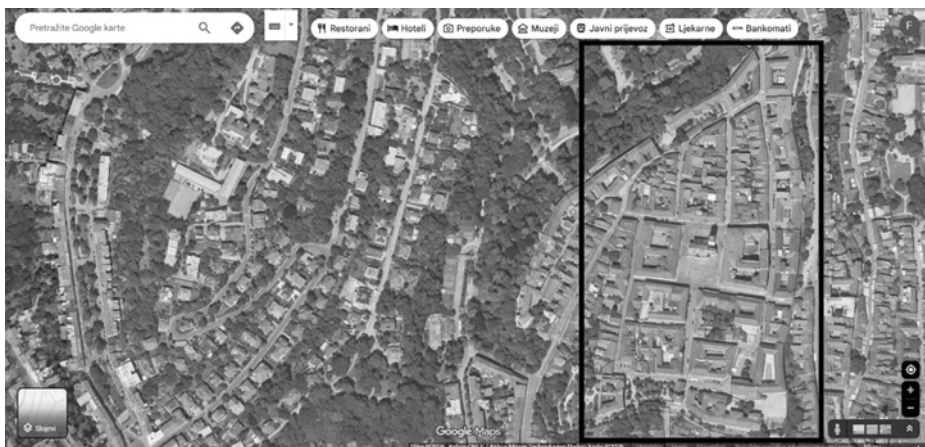
Fotografija 2: Zemljovid uzet s Google Karata

Zadatak je bio ispisan na četiri stranice (Prilog 1). Na početku se nalazio „zemljovid“ (Fotografija 2) Gornjega grada s točno označenim ulicama kojima se moraju kretati kako bi ih se ograničilo i spriječilo da previše odlutaju u traženju odgovora. Prikazan je na početku zadatka. S Google Karata je pomoću programa Bojanje (eng. Paint) izrezan dio zemljovida potreban za zadatak na kojem su označene ulice kojima se učenici moraju kretati.