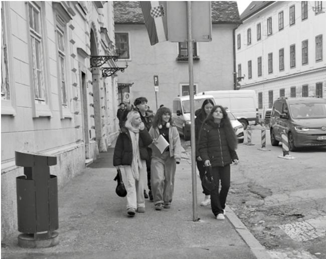
Fotografija 3: Pobjednička grupa Ne znam

Zadatak je ukupno sadržavao trideset tri pitanja (sa sveukupno 36 bodova) koja su pokrivala razdoblje od srednjeg vijeka do XX. stoljeća. Spomenuto je da neke odgovore učenici nisu mogli pronaći u svojoj okolini. Tu se radilo o pojmovima koje smatramo općom kulturom kada su u pitanju hrvatska i zagrebačka povijest. Primjerice napisati ime Kule Lotrščak, napisati koji top pukne s kule u podne svaki dan, koji je dokument gradu dao kralj Bela IV., znati u kojoj su zgradi Banski dvori, a u kojoj Hrvatski sabor te prepoznati i imenovati Kamenita vrata. Pretpostavili smo da će u grupama od pet učenika biti netko tko će se sjetiti tih pojmova koje očekujemo da su učenici usvojili kroz nastavu Povijesti u školama. Na kraju krajeva, cilj zadatka nije bio imati sve bodove, već biti u vrhu budući smo za najbolje ekipe bili osigurali nagrade. Grupa učenika koja je pobijedila na zadatku imala je 34 od 36 bodova (Fotografija 3). Većina učeničkih grupa zadatak je riješila u roku od sat i pol, a niti jednoj grupi nije za izvršenje zadatka trebalo puna dva sata.