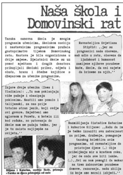
Fotografija 2: Poster koji sadrži članak iz Porečkog glasnika