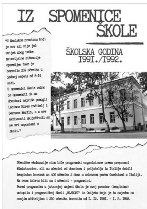
Fotografija 1: Poster iz Spomenice škole

informacije o mjestima iz kojih su dolazili. Zabilježeno je da su u to vrijeme u školu dolazili učitelji i ostali djelatnici iz ratom zahvaćenih krajeva, koji su se privremeno ili trajno uključili u rad škole i svojim iskustvima doprinosili funkcioniranju škole i životu školske zajednice (Fotografija 1).