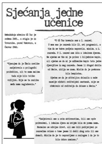
Fotografija 3: Poster koji sadrži sjećanja jedne učenice

Provedeni su intervjui s nekadašnjom ravnateljicom, tajnicom i učiteljicom te jednom učenicom (Prilog 1, 2, 3). Kroz osmišljena pitanja (Tablica 1), od kojih su neka pitanja bila ista, a neka različita, zabilježena su sjećanja osoba koje su sudjelovale i prisustvovale događajima iz povijesti škole. Slijedi tematska analiza pitanja.