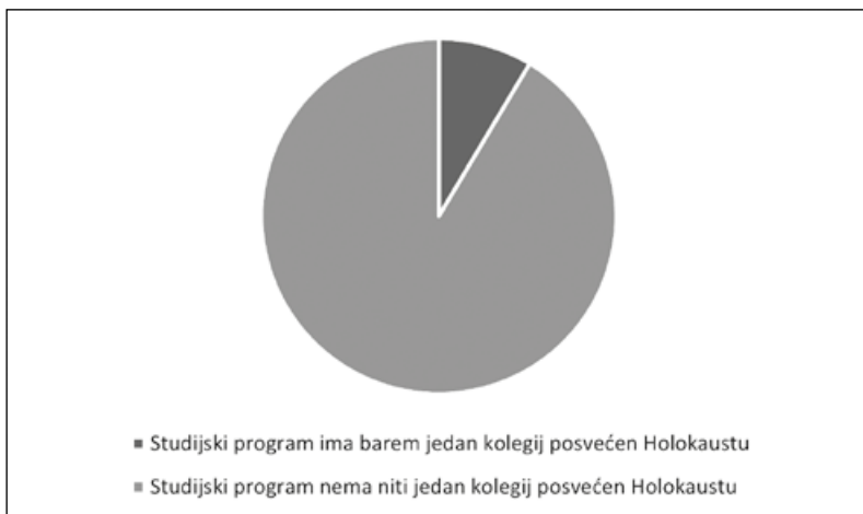
Grafikon 1: Udio studijskih programa koji u sebi imaju barem jedan kolegij posvećen Holokaustu

studiju povijesti. Ukupno je dakle na hrvatskim studijima povijesti pet kolegija koji su direktno posvećeni Holokaustu. Svi navedeni kolegiji su izborni po svome statusu, te svi nose opterećenje od tri ECTS boda. Među ovim kolegijima, s obzirom na temu rada posebno je vrijedno istaknuti kolegij koji se izvodi na nastavničkom modulu diplomskog studija povijesti u Rijeci, na kojem studenti, budući nastavnici povijesti, mogu stjecati znanja koja će moći integrirati u svojoj budućoj nastavi.