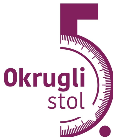
Slika 2. Logo 5. okruglog stola Komisije za statistiku i pokazatelje uspješnosti u knjižnicama

Na Okruglom stolu održana je panel-diskusija u trajanju od 90 minuta u kojoj su sudjelovale Martina Dragija Ivanović, Aleksandra Pikić Jugović i Tatjana Aparac-Jelušić. Zaključak rasprave bio je da se odlučivanje temeljeno na podacima mora primjenjivati u svakodnevnom radu i na svim razinama knjižničnog sustava. Posebno su istaknuta dva ključna pitanja: koji su podaci potrebni donositeljima odluka i kako knjižničari trebaju prezentirati podatke da bi bili jasniji i prihvatljiviji. Na ova su pitanja pokušale odgovoriti sudionice panel-diskusije, pružajući uvid u teorijske i praktične aspekte knjižničarstva te izazove u donošenju odluka temeljenih na dokazima.