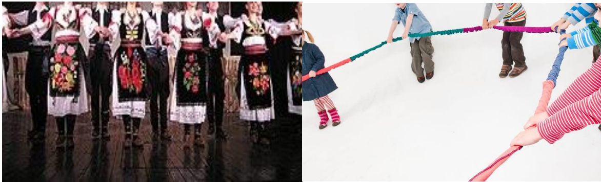
SLIKA 14, 15- Ples kolo

Kružno kretanje ubrzavanjem i zaustavljanjem stvara osjećaj ritma.