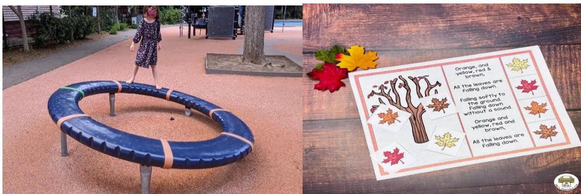
SLIKA 2, 3 - Razvijanje ritma i ravnoteže