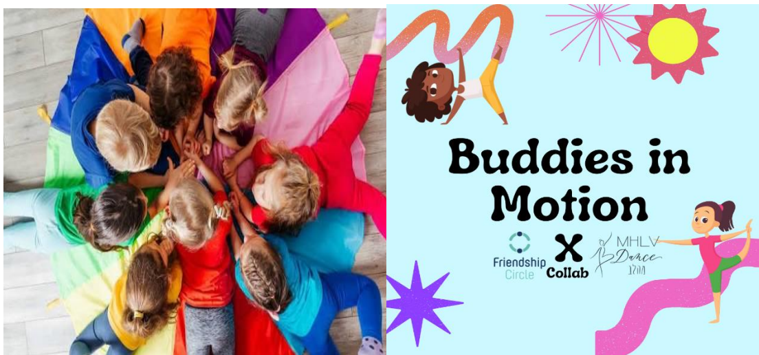
SLIKA 9, 10 - Jednostavni gestovi prijateljstva

Jednostavnim pokretima djeca izražavaju prijateljstvo i pripadnost grupi.