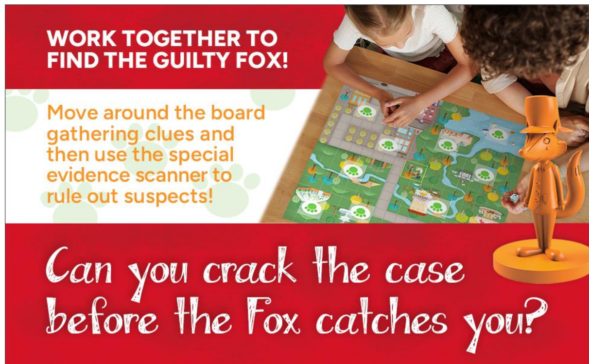
SLIKA 11, 12, 13- Igre o lisički

Igra uključuje element potjere, gdje "lisica" traži mjesto u krugu.