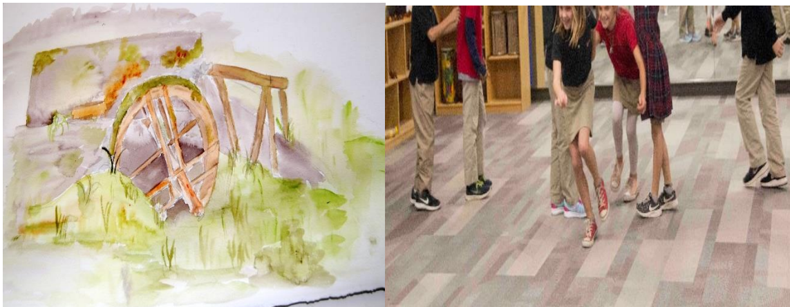
SLIKA 5, 6 - Kotač mlina. Prikazivanje kretanja duž bistrog toka.

Djeca koriste pokrete kako bi ilustrirala rad u mlinu.