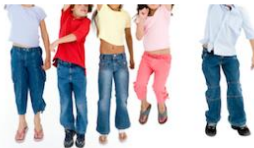
SLIKA 16, 17 - Melodija pjesme. Dance Abraham ima sedam sinova.

Djeca postupno dodaju pokrete pojedinim dijelovima tijela.