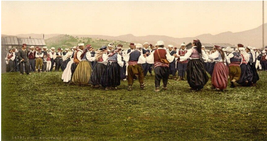
SLIKA 4 - Ples - Bijele ljiljane

Jedno od djece stoji u sredini kruga i bira sljedećeg plesača.