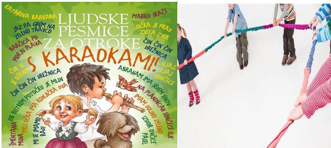
SLIKA 7, 8 - CD - Narodne pjesme za djecu s karaokeom. Ples Marko skače.

Ples uključuje skakanje i mijenjanje smjera u krugu.