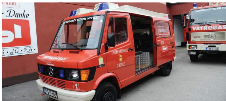
Slika 2. Vatrogasno šumsko vozilo

Autori Aleksić i Jančić (2011) navode da je vatrogasno šumsko vozilo (Slika 2) znatno manje vozilo u usporedbi s cisternom. Spremnik s vodom im je znatno manji kao i veličina vozila te je na nekim požarištima lakše proći do određenog mjesta nego cisternom. Šumsko vozilo također ima pumpu za vodu i znatno je opremljenije nego vatrogasna cisterna. Jedna od bitnijih stvari na požaru je „vitlo za brzu navalu“ koje ima ovaj tip vozila.