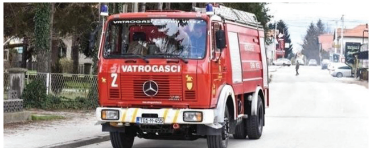
Slika 1. Vatrogasna cisterna

Vatrogasne su cisterne kamioni opremljeni pumpama, spremnicima s velikim zapremninama vode za gašenje, specijalnim sredstvima za gašenje, opremom za gašenje požara te najčešće s tzv. topovima za vodu (Slika 1). Svrha vatrogasne cisterne je transport vode na požarište te opskrba drugih, manjih vozila vodom.