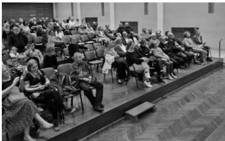
SLIKA 2. Publika na projekciji filma „ Hrvatski pravednici “ u Splitu FIGURE 2. The public at the screening of the film „The Righteous of Croatia“ in Split

This is how we opened this year's jubilee, 30th Days of Matica Hrvatska in Split with a history lecture by Dr. Blanka Matković ( Figure 1 ), a young historian who lives and works in London, who, researching numerous communist archives in Croatia and abroad, showed