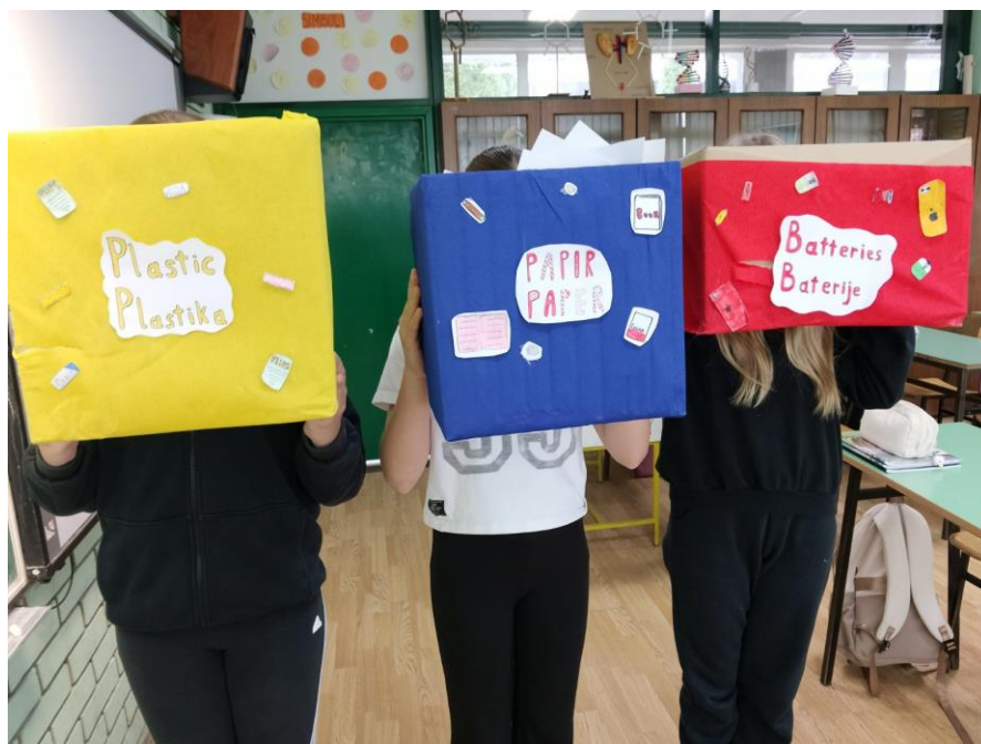
Slika 5.b) dovršene kutije za razdvajanje plastike, papira i baterija