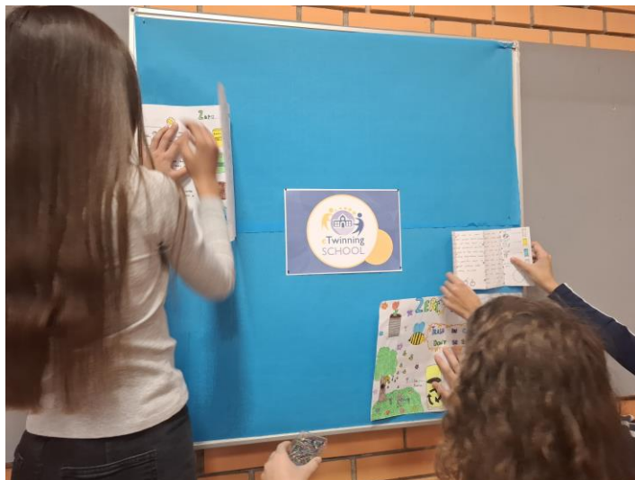
Slika 6.a) Izrada informativnog panoa

Kako bi sve upoznali s projektom i rezultatima projekta, učenici su izradili informativni pano s najvažnijim informacijama o projektu. (slike 6.a i b).