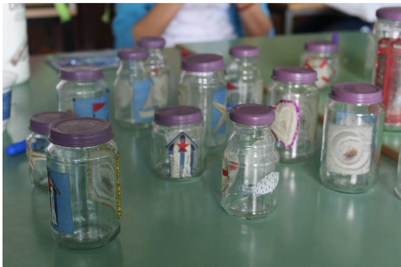
Slika 4.a) ukrasne bočice ukrašene decoupage tehnikom