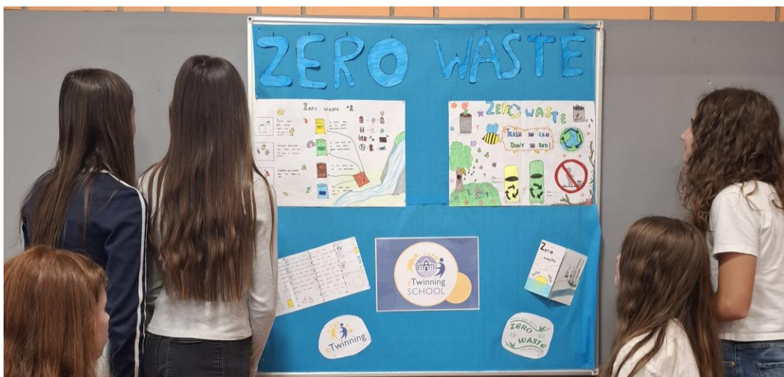
Slika 6.b) Informativni pano o projektu

Zadnja aktivnost projekta bila je prezentiranje rezultata projekta ostalim učenicima iz razreda. Kroz prezentaciju učenici su se upoznali sa svim aktivnostima projekta, koji je bio tijekom proizvodnje, koliko je vremenski trajao, koje