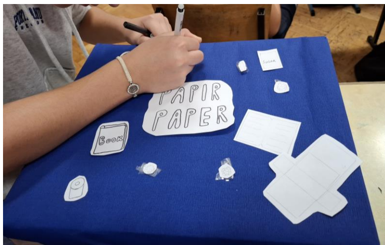
Slika 5.a) Izrada kutija za razdvajanje otpada

Koristili smo kartonske kutije u kojima su nam stigle bilježnice za učenike škole (koje je donirala općina učenicima), ostatke krep papira koje smo spajali zajedno, te ostatke papira koje su učenici ukrasili natpisima i slikama onoga što se razdvaja (slike 5.a, b i c).