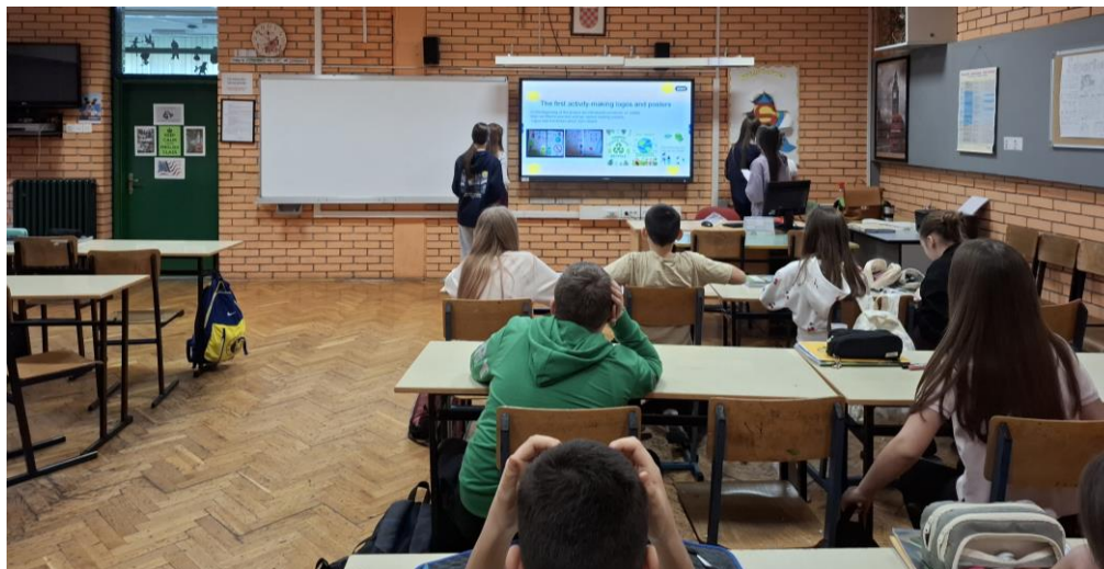
Slika 7.a) Učenice prezentiraju projekt razredu.

države i škole su sudjelovale, te koji su bili rezultati projekta (međunarodna suradnja, suradničko učenje, češće razdvajanje otpada, manje bacanja i zagađivanja). Nakon održane prezentacije, učenici su podijelili i brošure koje su izradili i koje smo umnožili (slike 7.a i b).