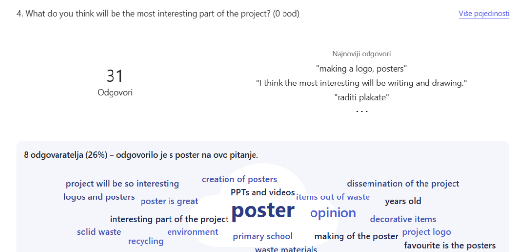
Slika 2. Mišljenje učitelja- u čemu najviše uživaju pri radu na eTwinning projekta

Što se tiče učitelja, oni su izrazili svoje mišljenje u čemu najviše uživaju pri radu u eTwinning projektima, pri tome spomenuvši kako vole surađivati s kolegama iz drugih država, učiti o njihovoj baštini, kulturi, načinu života, te žele svoje učenike povezati s učenicima iz drugih država (slika 2.).