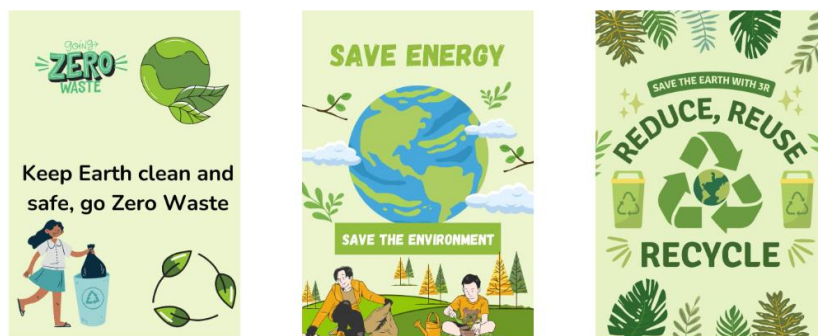
Slika 3.a) Digitalni posteri izrađeni u Canvi