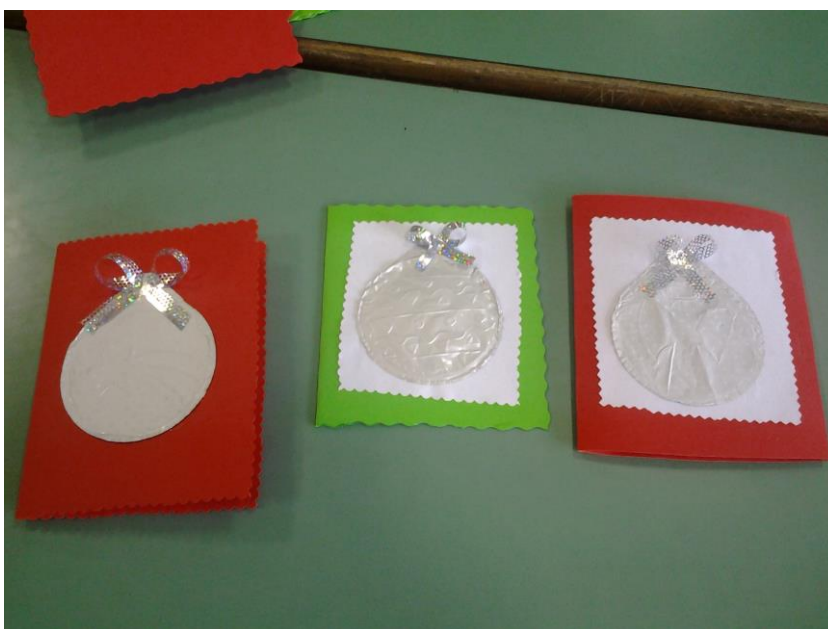
Slika 4.b) Božićne čestitke izrađene od ostataka hamera i poklopaca od jogurta

Učenici su izradili puno različitih ukrasnih, uporabnih proizvoda koristeći otpad, te su dio proizvoda iskoristili za ukrašavanje, a dio je prodan na prodajama naše Učeničke zadruge „Zrno” uz svoje standardne proizvode koje zadruga proizvodi.