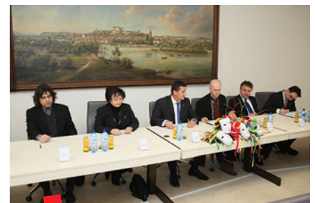
Potpisivanje ugovora o suradnji, Ptuj, 26. veljače 2022.