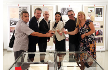
Otvorenje izložbe Vino na granici , Celje, 31. kolovoza 2022.