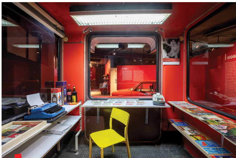
Muzej crvene povijesti

Postav je idejno podijeljen u tri cjeline. U prvoj, Socijalizam u teoriji , objašnjeni su počeci svjetskog i jugoslavenskog radničkog pokreta, dolazak komu-