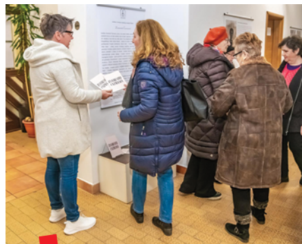
Otvorene izložbe 31. siječnja 2025. godine