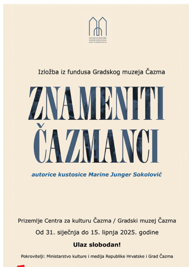
Plakat izložbe Znameniti Čazmanci

edukacije/pogodi-tko-sam/igra). Igra je nastala u sklopu pedagoškog programa „Moj zavičaj – to sam ja!“, također na temelju muzejske građe kao izvora informacija. Tako se iza ICH-forme, između ostalih „kriju“ Slavko Kolar, Ivo Horvat, Zlata Gjungjenac Gavella, Aleksandar Marks i Stanko Palić. Izložba je otvorena do 15. lipnja 2025. godine. ■