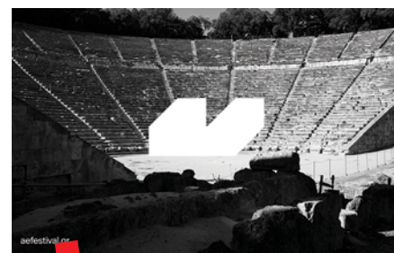
Festival Atena - Epidaur

interdisciplinarni istraživački interes jer sadrže rijetke podatke povezane s produkcijama, poput redateljskih bilješki, intervjuja i fotografija, kao i brojne oglase koji otkrivaju dominantne trendove i estetiku svakog razdoblja, uz druge informacije koje odražavaju povijesni, društveni i politički kontekst.