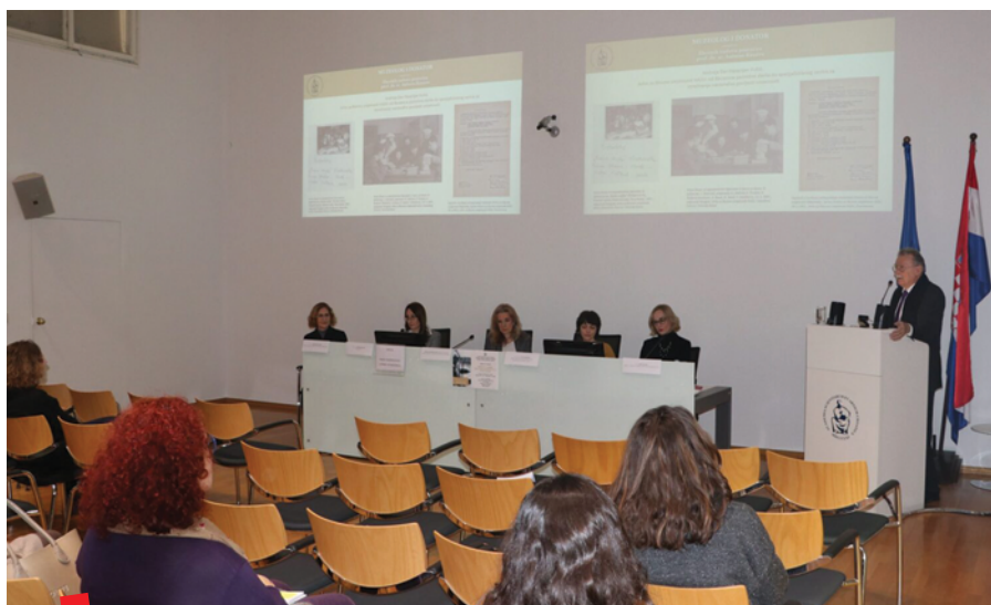
Promocija zbornika Antun Bauer - muzeolog i donator

Jedan od ključnih rezultata projekta jest objava digitalnog zbornika radova sa skupa, koji donosi trinaest recenziranih znanstvenih i stručnih priloga. Autori obrađuju različite aspekte Bauerova djelovanja – od njegove uloge u institucionalnoj izgradnji muzejske mreže, preko metodologije dokumentiranja umjetničke građe, do analize njegovih zbirki i uloge donatora u kontekstu kulturne politike. Zbornik je dostupan isključivo u digitalnom obliku na platformi Digitalna zbirka HAZU, čime se nastavlja usmjerenost projekta na održivost, smanjenje troškova i širenje pristupa kulturnim sadržajima. Autori objavljenih radova stručnom su obradom i znanstvenim vrednovanjem