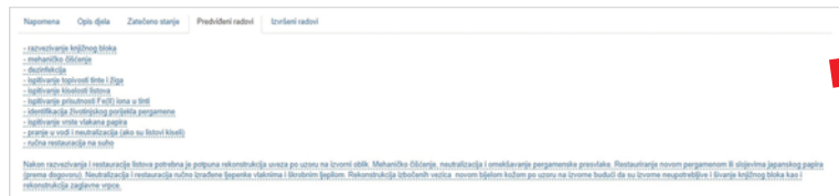
Primjer upisa predviđenih konzervatorsko-restauratorskih radova

racija, knjigovežnica i fotodokumentacija kao dijelovi koji se bave konzervatorsko-restauratorskim aspektom te zaštitna snimanja, dio baze kroz koji se prati građa preuzeta radi digitalizacije ili mikrofilmiranja. Svi ovi moduli dijele osnovne bibliografske kategorije podataka o jedinici (signatura, naslov, autor, mjesto i godina izdanja i sl.), ali istovremeno sadrže i izdvojena polja za upis podataka važnih za pojedini proces dok se kroz tekstualni opis djela unose osnovni podaci kakvi se inače ne mogu naći u knjižničnim katalogzima i sličnim izvorima poput podataka o zlatotisku, slijepom tisku, ilustracijama, marginalijama, ukrašenim inicijalima ili pak podaci o nepravilnostima u numeraciji, tisku ili uvezu.