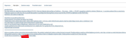
Primjer detaljnijeg opisa djela