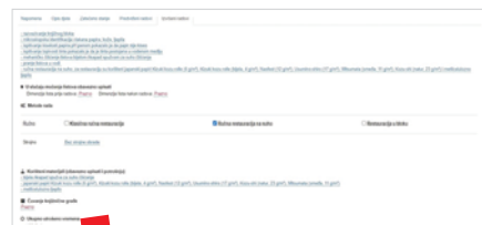
Primjer upisa podataka o izvršenim konzervatorsko-restauratorskim radovima

NACIONALNA I SVEUČILIŠNA KNJIŽNICA U ZAGREBU