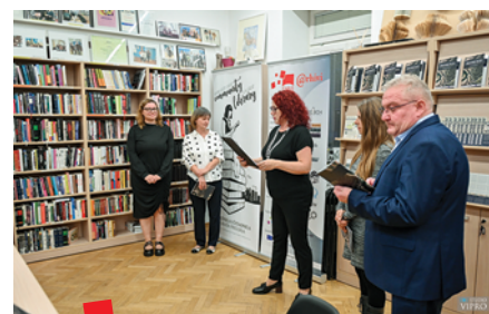
Otvorenje izložbe u Knjižnici