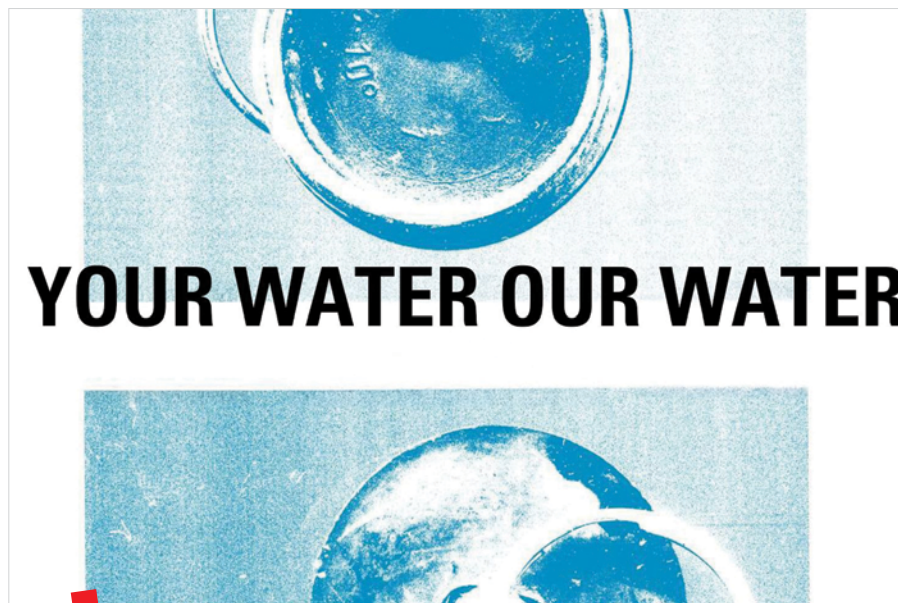
Plakat izložbe Your Water Our Water

Jedna od najzanimljivijih priča vezanih za Dunav je sudbina Ade Kale, nekada naseljenog otomanskog otoka koji je 1970. godine nestao pod vodama rijeke zbog izgradnje hidroelektrane Đerdap. Multimedijalni projekt Luciana Brana From Centuries Ago to Eons to Come (2017. – 2021.) istražuje ovaj gubitak povezujući Adu Kale s novonastalim otokom u Crnom