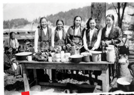
Kalmičke žene u Debeljaci za vrijeme Drugog svjetskog rata

Povijest Kalmika u Srbiji naglašava širu dinamiku migracija, kulturne razmjene i otpornosti. Svojim radom, tradicijom i interakcijom s lokalnim stanovništvom, Kalmici su pridonijeli stvaranju multikulturalnog, multinacionalnog i multi religijskog tkiva međuratnog Beograda. Iako su povijesne okolnosti dovele do njihovog odlaska i skoro brisanja iz javnog pamćenja, stalni napori znanstvenika, potomaka i entuzijasta osiguravaju da se njihova priča nastavi. Iskustvo Kalmika služi kao dirljiv podsjetnik na složenost života dijaspore i trajnu važnost očuvanja kulturnog sjećanja u odnosu na povijesne tokove. ■