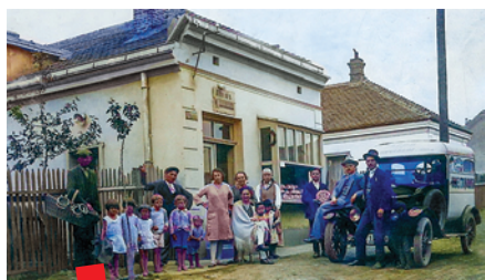
Grupa Kalmika i lokalnog stanovništva u predgrađu Beograda, 1930-te