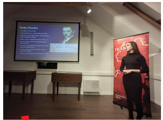
Kultura sjećanja - Magdalena Petak o Otokaru Hrazdiri

Knjižničarska grupa Čuvari znanja i učenici dodatne nastave povijesti sudjelovali su u ožujku i na fotoradionici Hrazdirina staza bilježeći fotoaparatom mjesta na kojima je nekada živjela i radila obitelj Hrazdira, od njihovog imanja i rudnika "Sinovske", pretovarne stanice na "Rudniku" i željezničkog kolodvora, grobnog spomenika i mjesta na kojem su održane izložbe u organizaciji Fotosekcije Planinarskog društva Ivančica te mjesta koja čuvaju Hrazdirinu baštinu poput Centra za posjetitelje „Kukuljević“ i Muzeja planinarstva. ■