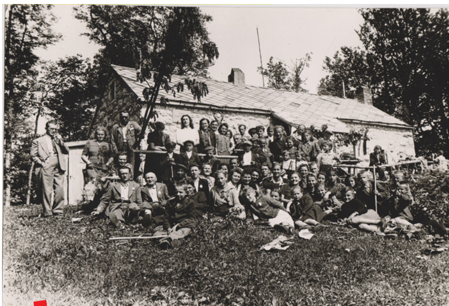
Ivančani kod planinarskog doma na Ivanšćici, 30-e g. 20. st.