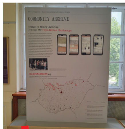
AToM izložba Mađarskog nacionalnog arhiva