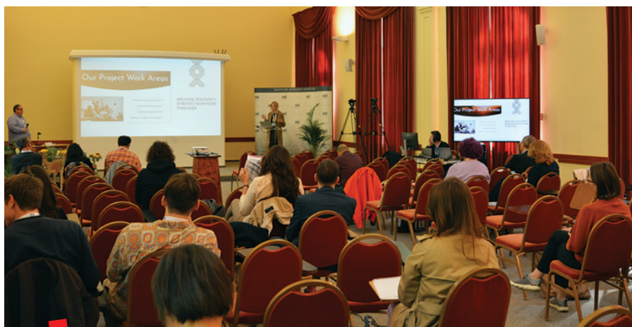
Sudionici AToM simpozija

Priručnik AToM dostupan je na: https://drive.google.com/file/d/1zjsipN4IjyMJ9XmCRsLY9IWNo100U_1C/view