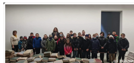
Posjet učenika OŠ Travnik Arhivu 2021.