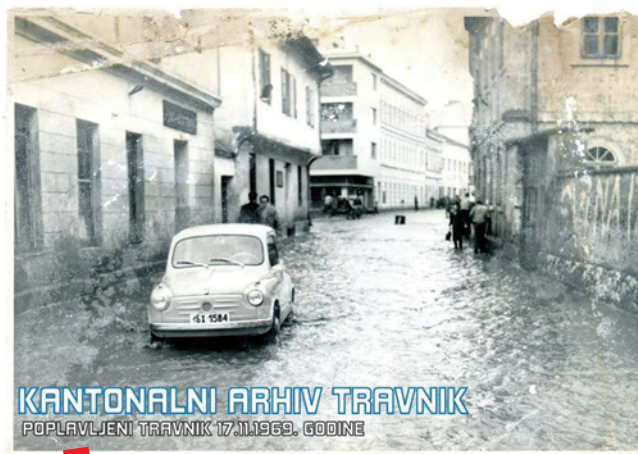
Gradivo Kantonalnog arhiva Travnik na Facebook stranici RetroTravnik

mišta što bi bilo dugoročno rješenje arhivskih spremišnih kapaciteta. Arhiv je 1991. imao površinu od 1180 m 2 , sve do 2005. kada se površinski vraća na prvobitno stanje od 576 m 2 jer je ustupljeni prostor u travničkoj gimnaziji vraćen pravim vlasnicima - Vrhbosanskoj nadbiskupiji. Vlada Srednjobosanskog kantona/Županije Središnja Bosna 2006. godine odobrava izradu projektne dokumentacije za projekt „Renoviranje i dogradnja zgrade depona“. Danas Arhiv posjeduje zgradu u ukupnoj površini od 1314 četvornih metara, koja je i prva namjenska zgrada arhiva u Bosni i Hercegovini.