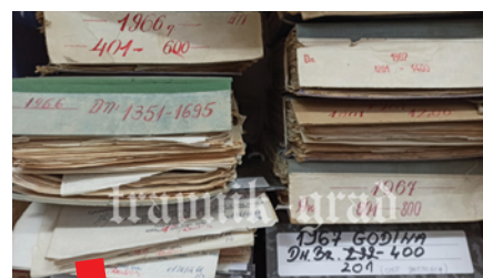
Sudski spisi u Arhivu