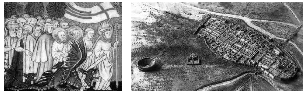
Slika 5. i 6. Legenda o sv. Klementu i pogled na amfiteatar u današnjem Metzu

stanovništvo napustilo pogansku vjeru i trajno je pristupilo kršćanstvu (Tripps, 2006, 88-89). Također na prostoru današnje Velike Britanije postoji usmena tradicija i lokalna memorija, koju vezujemo uz građevinu rimskog amfiteatra. Naime, na temelju čuvene legende o kralju Arthuru znanstvenici smatraju da je legendarni okrugli stol morao biti povećih dimenzija, budući da se oko njega okupljalo više od tisuću ljudi. U VI. stoljeću fratar po imenu Gildas pisao je o Arthurovu životu, a spominjao je Grad legija i svetište unutar njega (Ashe, 1987, 18, 110). Upravo je rimski amfiteatar u Chesteru ( Deva Victrix ) mogao biti lokacija Arthurova legendarnog okruglog stola, odnosno, čuvenog dvora Camelota. Međutim, kao možebitna lokacija Arthurova legendarnog okruglog stola također se pojavljuje prostor rimskog amfiteatra u Caerleonu ( Isca Augusta ) na području današnjeg Walesa (Cremin, 2007, 190). Ne ulazeći u rasprave o možebitnim lokacijama i ubikacijama ovdje obrađivanih