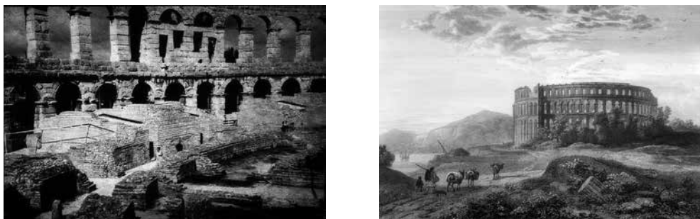
Slika 1. i 2. Pogled na unutrašnji i vanjski plašt rimskog amfiteatra u Puli

Rimski amfiteatar na području današnje Pule jedno je od najmonumentalnijih spomenika iz vremena rimskog vladanja na području prostranoga Rimskog Carstva. Stručnjaci pretpostavljaju da je sagrađen u vrijeme cara Augusta, dok u građevinskim fazama i nadogradnjama za vrijeme vladavine cara Klaudija i Vespazijana dobiva svoj konačni oblik. Međutim, u našoj znanstvenoj literaturi ne postoji sasvim ujednačeno mišljenje o vremenu gradnje ovog impozantnog zdanja. Tek bi sustavna istraživanja spomenutog prostora mogla potvrditi ili opovrgnuti ovdje iznesena mišljenja i stajališta o konačnom vremenu gradnje rimskog amfiteatra u Puli. Također ne postoji nikakav povijesni izvor ili natpisna građa, koji bi s velikom sigurnošću mogli vremenski atribuirati pojedinu građevinsku fazu, odnosno, izgradnju rimskog amfiteatra na području današnje Pule.