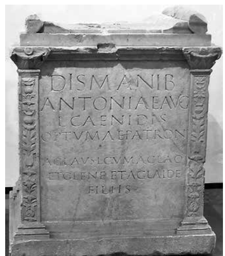
Slika 3. i 4. Nadgrobnni spomenik Antonije Caenis i tlocrt rimskog amfiteatra u Puli

Povijesna priča o mučeništvu sv. Germana također je usko povezana s rimskim amfiteatom u Puli. Naime, sv. German mučen je u vrijeme vladavine rimskog cara Numerijana (283. – 284. g.) kada su ujedno i brojni