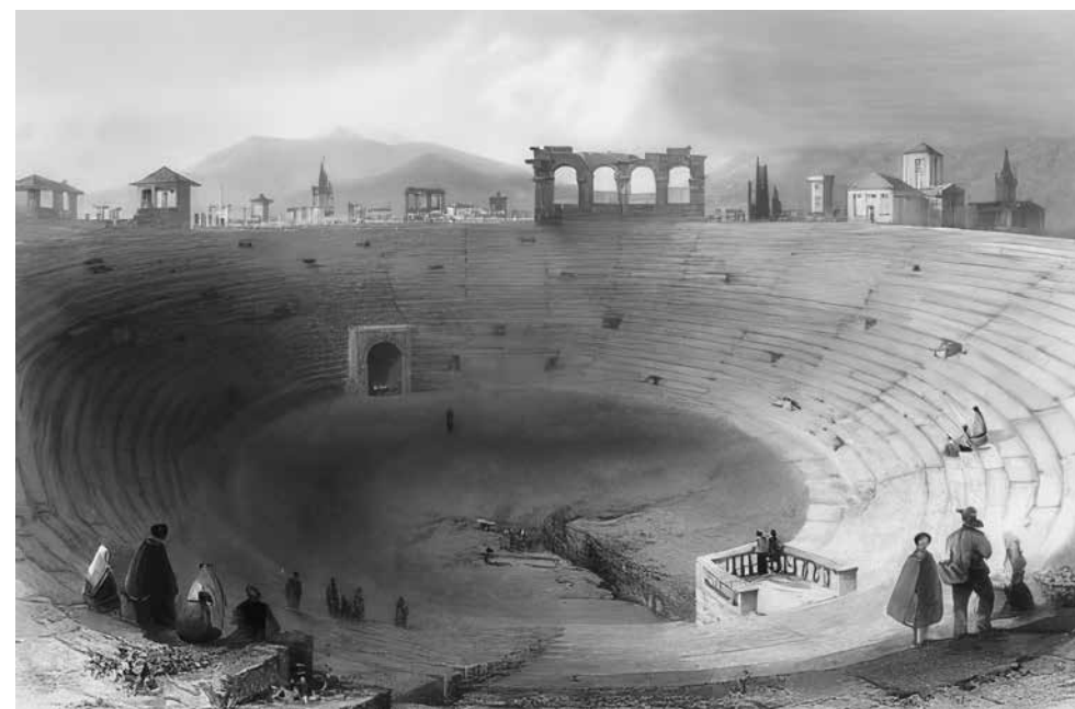
Slika 11. Pogled na unutrašnjost rimskog amfiteatra u Veroni

Puli: „Rimski amfiteatar u Puli zove naš puk u Istri Divičin grad (grad djevojaka)“. Ovdje etimološki izvedena pretpostavka o mogućem nazivu građevine polatičkog amfiteatra, koju Vladimir Nazor povezuje sa divicama (djevojkama), odnosno, možebitnim vilama zasad možemo vrednovati samo kao bukoličko pjesničko ostvarenje. Također uz građevinu rimskog amfiteatra