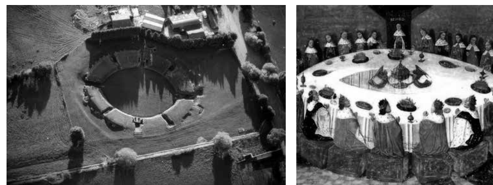
Slika 7. i 8. Usporedba rimskog amfiteatra u Caerleonu i Arthurovog okruglog stola

stanovništvo napustilo pogansku vjeru i trajno je pristupilo kršćanstvu (Tripps, 2006, 88-89). Također na prostoru današnje Velike Britanije postoji usmena tradicija i lokalna memorija, koju vezujemo uz građevinu rimskog amfiteatra. Naime, na temelju čuvene legende o kralju Arthuru znanstvenici smatraju da je legendarni okrugli stol morao biti povećih dimenzija, budući da se oko njega okupljalo više od tisuću ljudi. U VI. stoljeću fratar po imenu Gildas pisao je o Arthurovu životu, a spominjao je Grad legija i svetište unutar njega (Ashe, 1987, 18, 110). Upravo je rimski amfiteatar u Chesteru ( Deva Victrix ) mogao biti lokacija Arthurova legendarnog okruglog stola, odnosno, čuvenog dvora Camelota. Međutim, kao možebitna lokacija Arthurova legendarnog okruglog stola također se pojavljuje prostor rimskog amfiteatra u Caerleonu ( Isca Augusta ) na području današnjeg Walesa (Cremin, 2007, 190). Ne ulazeći u rasprave o možebitnim lokacijama i ubikacijama ovdje obrađivanih