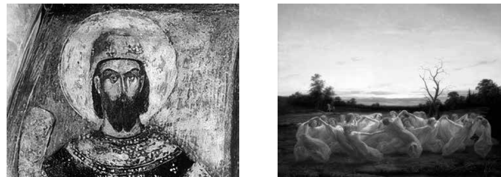
Slika 9. i 10. Prikaz kraljevića Marka i vila povezanih sa amfiteatom u Puli

Puli: „Rimski amfiteatar u Puli zove naš puk u Istri Divičin grad (grad djevojaka)“. Ovdje etimološki izvedena pretpostavka o mogućem nazivu građevine polatičkog amfiteatra, koju Vladimir Nazor povezuje sa divicama (djevojkama), odnosno, možebitnim vilama zasad možemo vrednovati samo kao bukoličko pjesničko ostvarenje. Također uz građevinu rimskog amfiteatra