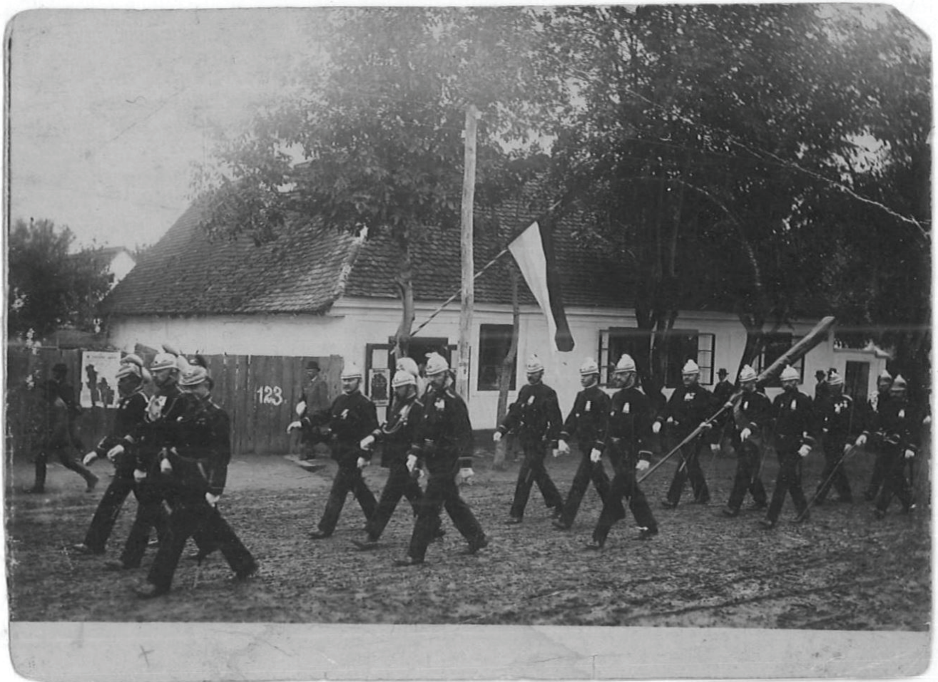
Sl. 5 Fotografija Vatrogasci na carskim manevrima u Donjem Miholjcu, neutvrđeni autor, 1901. godina, Austro-Ugarska Monarhija, papir, fotografija crno-bijela, 8 x 11 cm, Muzej Slavonije, MSO-182507

Svečano se sviranje i pjevanje nije održavalo samo prilikom dolaska vladara na pojedini željeznički kolodvor ili naselje nego i u povodu njegova dolaska. Kao primjer možemo spomenuti koncert u kojemu je sudjelovala većina spomenutih aktera u Bjelovaru: „Dne 11. rujna t. g. kao u oči previšnjega dolazka Njeg. Veličanstva priređuje hrv. pjev. društvo 'Dvojnice' u zajednici sa pobratimskim zagrebačkim pjev. društvom 'Kolom' uz blagohotno sudjelovanje domaće vojničke glazbe 16. pukovnije i bjelovarskoga tamburaškoga sбора u vrtu kod 'Krone' u Belovaru koncert...” 50 Za razliku od navedenog primjera tijekom dolaska i boravka u Donjem Miholjcu možemo iščitati u novinama kako su za glazbu bila zadužena vatrogasna glazbena društva. Izričito se spominje osječko vatrogasno društvo koje je sviralo kraljevku u Donjem Miholjcu. 51 Potonja je već spominjana da je svirana i 1888. godine, a bila je uobičajena prilikom dolaska Franje Josipa I. diljem Austro-Ugarske Monarhije. Došli su uz osječke vatrogasce i članovi vatrogasnih skupina ili po-