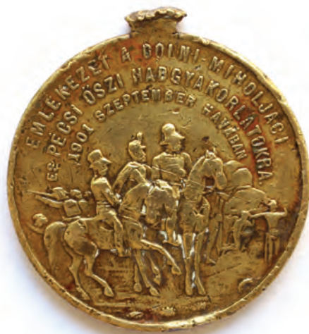
Sl. 8 Medalja Franjo Josip I. Spomen na vojne manevre u Donjem Miholjcu i Pečuhu, neutvrđeni autor, 1901. godina, Austro-Ugarska Monarhija, bronca, kovanje, \phi 2,9 cm, Muzej Slavonije, MSO-152610, foto: Kristijan Wolfl

Medalja je okrugla oblika s oštećenom alkom.