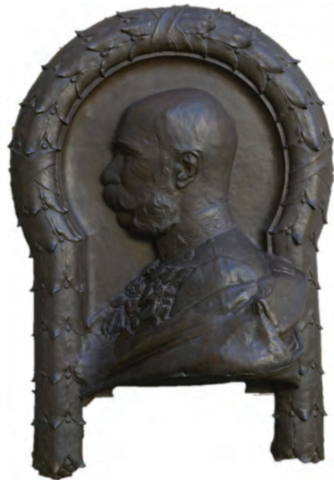
Sl. 11 Reljef Franjo Josip I. Robert Frangeš Mihanović, 1905. godina, Austro-Ugarska Monarhija, bronca, lijevanje, 135 x 97 x 34 cm, Muzej Slavonije, MSO-P-2326

Spomenik koji se sada može vidjeti u Donjem Miholjcu obnovljen je 2005. godine u povodu 100. obljetnice njegova podizanja. Originalni reljef poprsja Franje Josipa I. sa spomenika od 1905. godine čuva se u Muzeju Slavonije nakon što je došao 1953. godine.