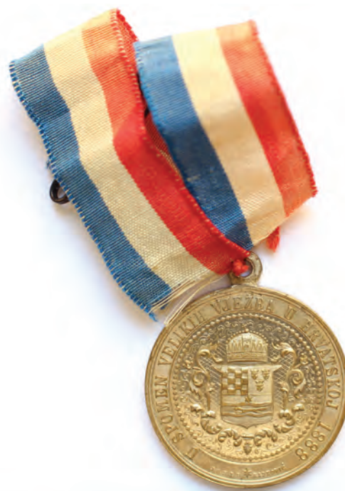
Sl. 3 Medalja Franjo Josip I. Velike vojne vježbe u Hrvatskoj, Josip Radković, 1888. godina, Austro-Ugarska Monarhija, mjed (žuta), rips, konac, kovanje, šivanje, \phi 3,3 cm, Muzej Slavonije, MSO-N-M-1670