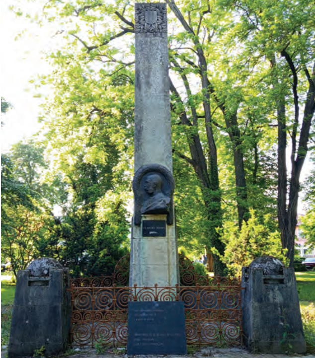
Sl. 10 Spomenik Franji Josipu I. u Donjem Miholjcu, fotografirano 2025. godine

pojedine ulice pako prozване su: Mailáthova, Prandauova, Strossmayerova, Gajeва, Preradovičeva, Gunduličeva, Kačićeva, Mihanovičeva, Šenoína, Zrinjskíeva, Lisinskiéva i Rusanova... Zaključak u pogledu trga odobren je previšnjim rješénjem od 8. kolovoza 1901... 73