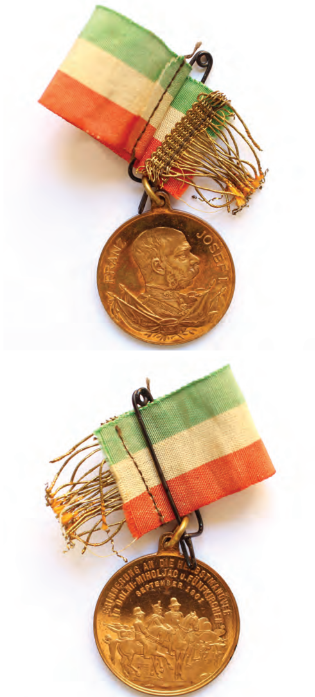
Sl. 7 Medalja Franjo Josip I. Spomen na vojne manevre u Donjem Miholjcu, neutvrđeni autor, 1901. godina, Austro-Ugarska Monarhija, pozlaćena legura, rips, konac, pozlaćivanje, kovanje, šivanje, ø 2,9 cm, Muzej Slavonije, MSO-N-M-258, foto: Kristijan Wolf

RV. – plitki reljef. Prikaz vladara Franje Josipa I. s vojnim zapovjednicima kako nadgledaju vježbe vojnika koji su prikazani s desne i lijeve strane od jahača. Polukružno se u gornjem dijelu u tri reda nalazi tekst na latinici i njemačkom jeziku s tiskanim slovima ERINNERUNG AN DIE HERBSTMANÖVER / IN DOLNI MIHOLJAC U. FÜNFKIRCHEN / SEPTEMBER 1901.