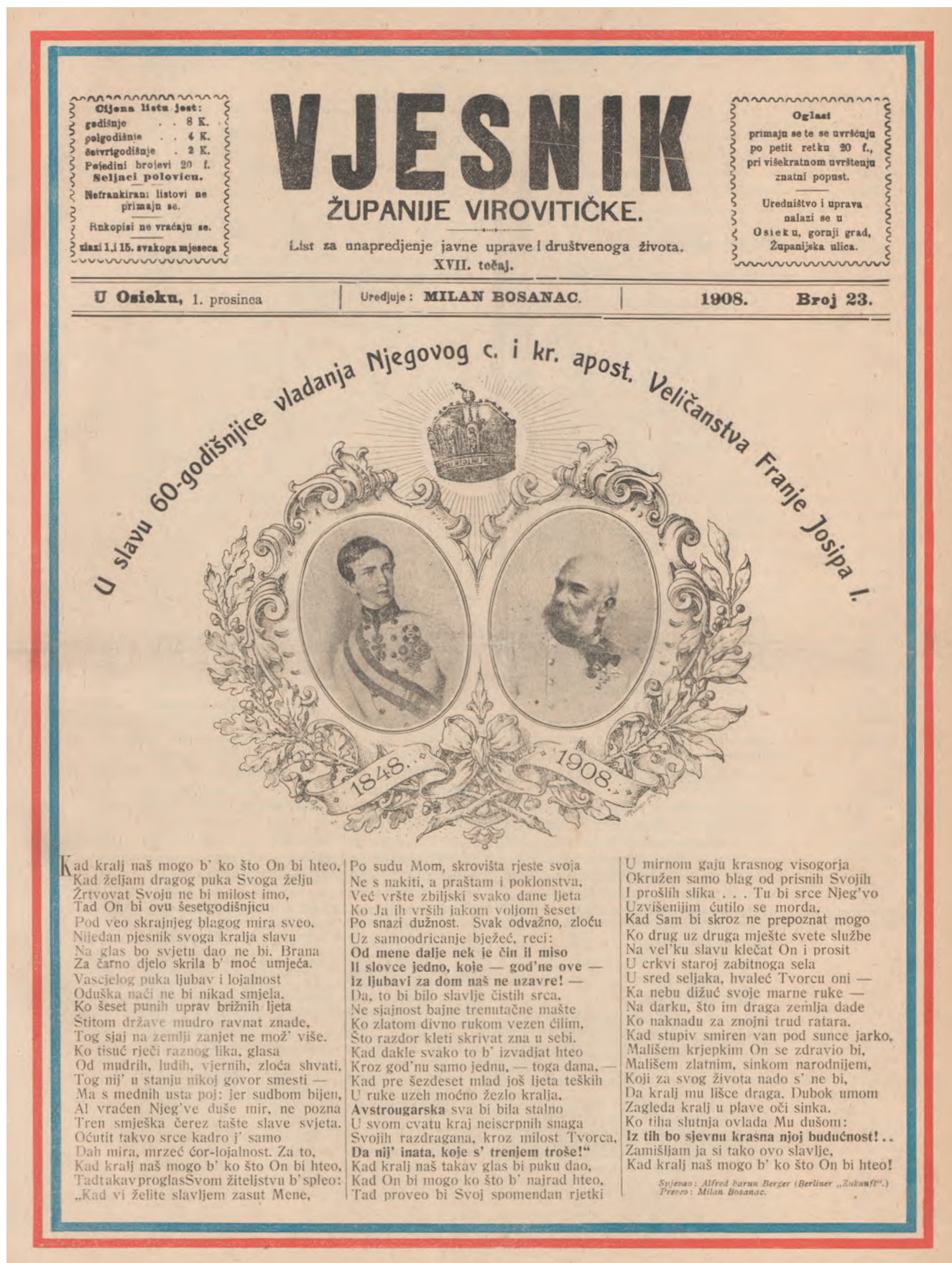
Sl. 1 Vjesnik županije Virovitičke: List za unapredjenje javne uprave i društvenoga života 23 (utorak, 1. 12. 1908.)