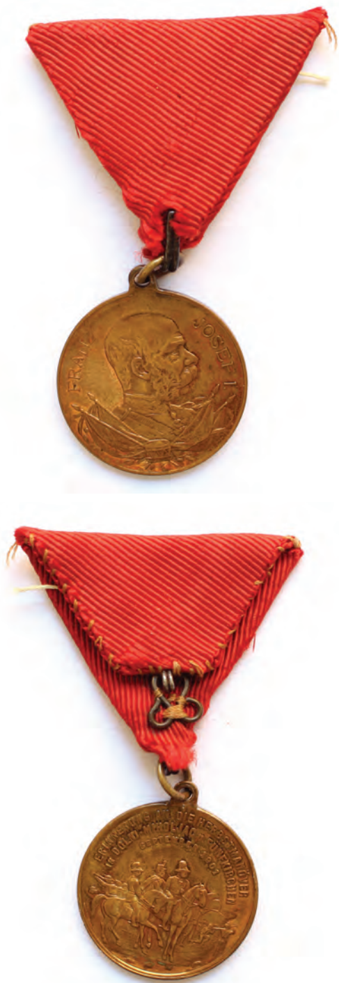
Sl. 6 Medalja Franjo Josip I. Spomen na vojne manevre u Donjem Miholjcu, neutvrđeni autor, 1901. godina, Austro-Ugarska Monarhija, bronca, rips, konac, kovanje, šivanje, ø 2,9 cm, Muzej Slavonije, MSO-P-III-849

Medalja je okrugla oblika s alkom i ukrasnom vrpcom. Vrpca je savijena u obliku trokuta, crvene boje.