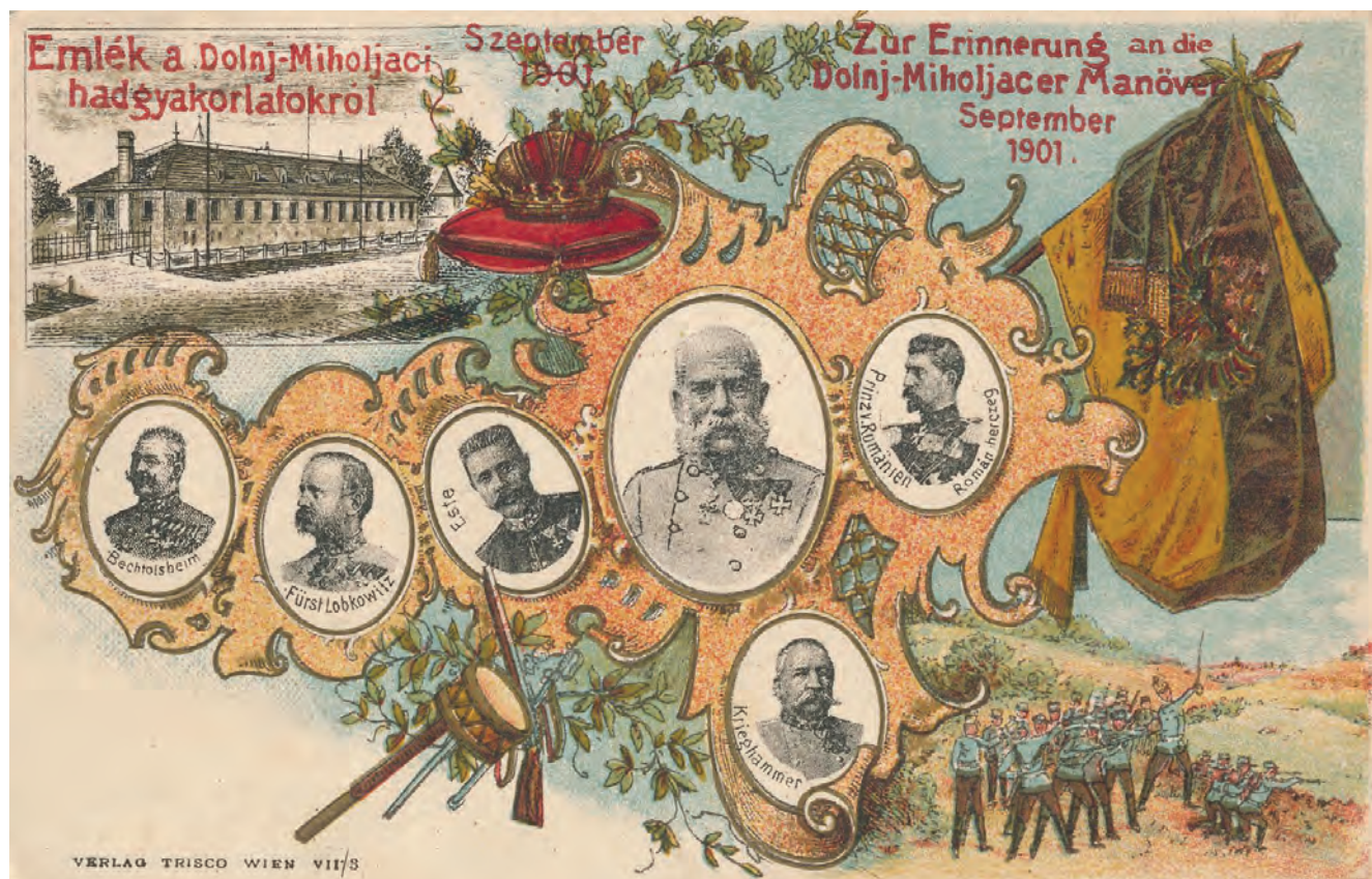
Sl. 9 Razglednica Uspomena na vojne manevre, Donji Miholjac, Trisco, 1901. godina, Austro-Ugarska Monarhija, papir, tisak u boji, 9 x 14 cm, Muzej Slavonije, MSO-182852, foto: arhiva Muzej Slavonije

navedenih Krieghammer i Lobkowitz nalaze se uz vladara Franju Josipa I., prestolonasljednika Franju Ferdinanda, vladareva gosta, rumunjskog prestolonasljednika Ferdinanda i zapovjednika 13. zbornice Bechtolsheima na jednoj od razglednica koja se čuva u Muzeju Slavonije.