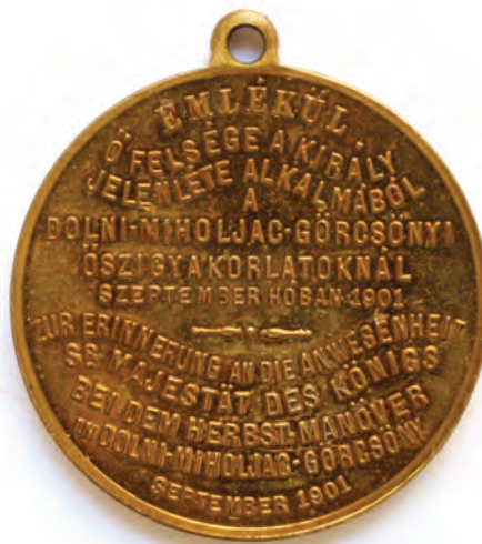
Sl. 12 Medalja Franjo Josip I. Spomen na vojne manevre u Donjem Miholjcu i Görcsönyju, neutvrđeni autor, 1901. godina, Austro-Ugarska Monarhija, bronca, pozlaćena legura, kovanje, pozlaćivanje, ø 2,9 cm, Muzej Slavonije, MSO-152611

Uz opisani reljef portreta Franje Josipa I. i opisanih medalja možemo izdvojiti još jednu medalju koja je kao i sve druge uspomena na vojne vježbe. Na prednjoj strani, to jest aversu nalazi se uobičajeno prikaz Franje Josipa I., a na reversu tekst na mađarskom i njemačkom jeziku. Može se uočiti na svim korištenim medaljama iz zbirke Muzeja Slavonije koje su napravljene u povodu jesenskih vojnih vježbi 1901. godine da se navodi Donji Miholjac, dok se s ugarske strane spominju ili Pečuh ili Görcsöny.