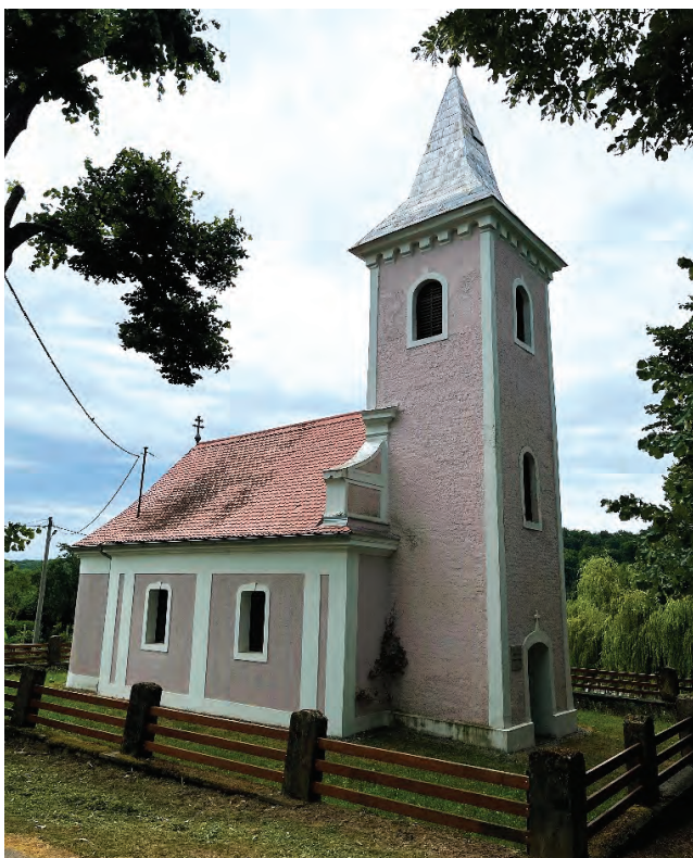
Sl. 2 Pogled na crkvu Sv. Trojice sa sjeverozapadne strane

Crkva je u sastavu Parohije Medinci koja pripada Eparhiji slavonskoj Srpske pravoslavne crkve u Hrvatskoj 1 i pojedinačno je zaštićeno kulturno dobro upisano u Registar kulturnih dobara Republike Hrvatske. (Sl. 3 i 4)