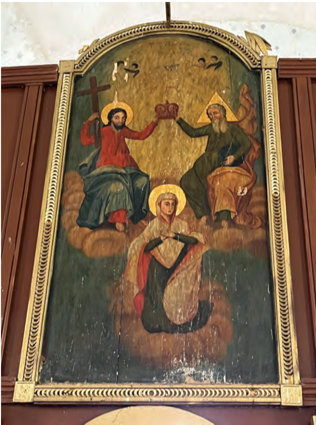
Sl. 18 Sveta Trojica (i Krunjenje Bogorodice), ikonostas

ovom ikonostasu nedostaje. No za nju u ovom slučaju ni nema predviđenog mjesta s obzirom na to da se iznad dveri nalazi najveća ikona gažanskog ikonostasa – prikaz Svete Trojice, odnosno Silaska Duha Svetoga (i Krunjenja Bogorodice). (Sl. 18) Uz nju su, u posljednjem redu, sačuvane još samo dvije ikone s prikazima svetaca. 41 (Sl. 19) Prema tradicionalnoj ikonografskoj shemi na vrhu ikonostasa trebala bi stajati kompozicija Raspeća, odnosno Krist, kojemu sa strane stoje manje ikone Bogorodice i svetog Ivana, ali one nedostaju. 42 Na vrhu nalazimo samo dvije pozlaćene vaze i ostatke horizontalno položenih rezbarenih vegetabilnih ornamenata izvedenih u obliku stiliziranih biljnih grana božura. 43