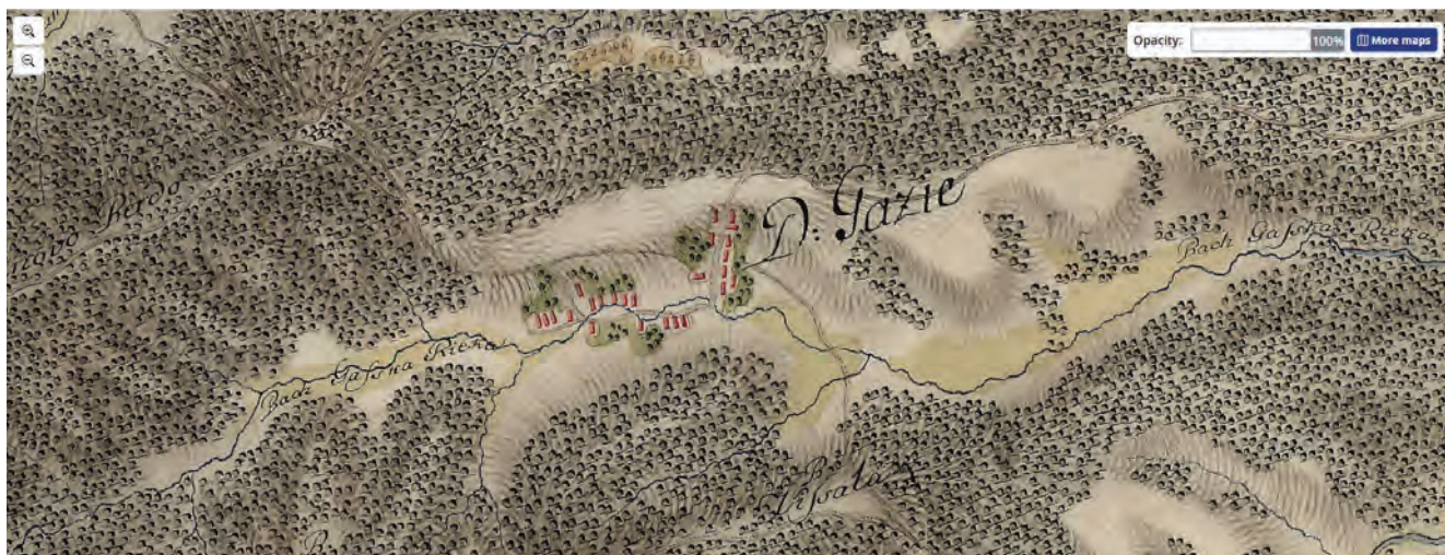
Sl. 6 Gazije, Hrvatska na tajnim zemljovidima, Jozefinski vojni zemljovid iz 1781. g. (sv. V: Virovitička županija, Hrvatski institut za povijest, Zagreb, 2002.)