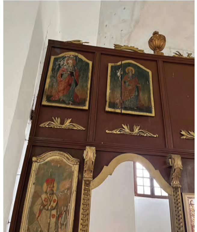
Sl. 19 Ikone svetaca, ikonostas

Uz to nestručni premazi i retuši dodatno su narušili njihovu izvornost pojednostavljujući i izobličujući prikaze, što je posebno uočljivo na Carskim dverima.