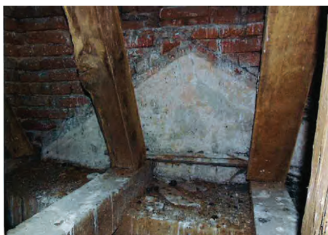
Sl. 9 Ostaci timpanona na zapadnom pročelju iz prve graditeljske faze