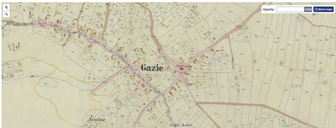
Sl. 7 Katastarska karta općine Gazije iz 1862. g., detalj ( https://maps.arcanum.com , Habsburg Empire - Cadastral maps XIX. Century)

U prvoj polovini 18. stoljeća Gazije pripadaju vlastelinstvu Orahovica–Feričanci 10 , a manastir Orahovica upravlja vinarima i voćnjacima u ataru sela. 11 Izvori bilježe da su se krajem 19. stoljeća u selu nalazile 42 kuće s ukupno 243 stanovnika. 12