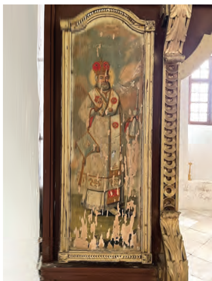
Sl. 15 Sv. Nikola, ikonostas