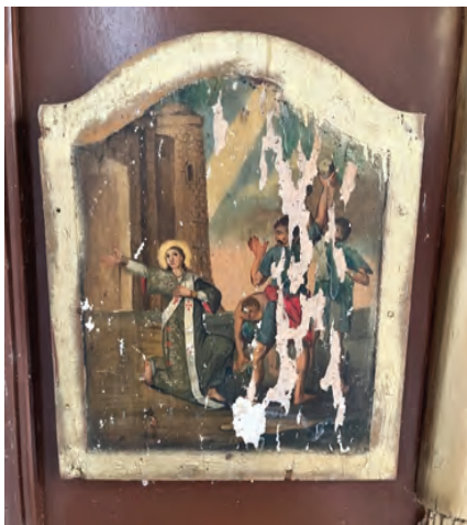
Sl. 13 Kamenovanje sv. Stjepana, ikonostas