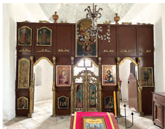
Sl. 11 Ikonostas

Liturgijska oprema crkve iznimno je skromna. Osim zidanih elemenata, časne trpeze u svetištu i krstionice uz ulaz u unutrašnjosti nije sačuvan povijesno-umjetnički značajan sakralni mobilijar, poput klupa za vjernike, vladličanskog prijestolja i sl. Od izvorne opreme sačuvan je jedino drveni ikonostas, koji je najvrjedniji dio crkvenog inventara. (Sl. 11)