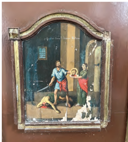
Sl. 12 Glavosjek sv. Ivana Krstitelja, ikonostas (foto: S. Klarić Čuljak, 2025.)