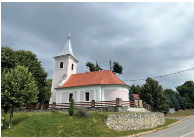
Sl. 1 Pogled na crkvu Sv. Trojice s južne strane

Pravoslavna crkva Svete Trojice u Gazijama složena je povijesna i arhitektonska cjelina s kontinuitetom razvoja od 17. stoljeća. Na mjestu današnje crkve ranije su bile izgrađene drvene crkve, dok je današnja jednobrodna zidana građevina, s užim polukružnim svetištem i rizalito istaknutim zvonikom, formirana u dvije graditeljske faze, krajem 18. i početkom 19. stoljeća. Unatoč skromnim dimenzijama i jednostavnom arhitektonskom izrazu crkva je vrijedan i rijetko sačuvan primjer pravoslavne sakralne arhitekture u Slavoniji u kojem se skladno prožimaju element tradicionalnog graditeljstva i barokno-klasicističkog stila kasnog 18. stoljeća. (Sl. 1 i 2)