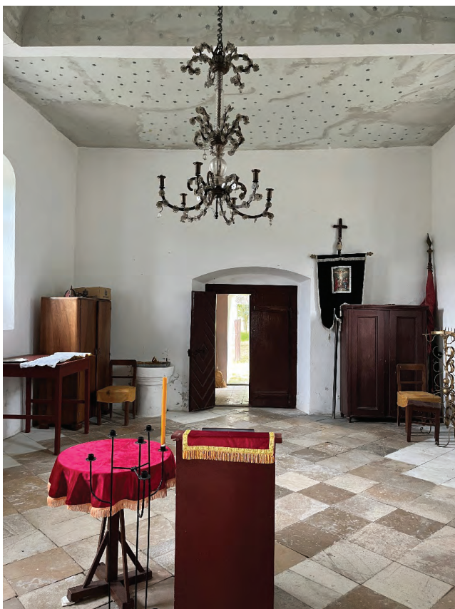
Sl. 5 Interijer, pogled prema ulazu

Tijekom 2012. godine na crkvi su provedena sustavna konzervatorsko-restauratorska istraživanja koja su potvrdila njezinu graditeljsku slojevitost. Dobiveni rezultati poslužili su kao temelj za daljnje proučavanje, zaštitu i valorizaciju 4 te predstavljaju osnovu ovog rada, čiji je cilj istaknuti važnost očuvanja građevina jednostavnijeg i skromnijeg izraza oblikovanih u duhu prevladavajućeg stila, u ovom slučaju barokno-klasiciističke stilistike, s prisutnim elementima tradicijskog graditeljstva i odrazom lokalnog ambijentalnog identiteta. (Sl. 5)