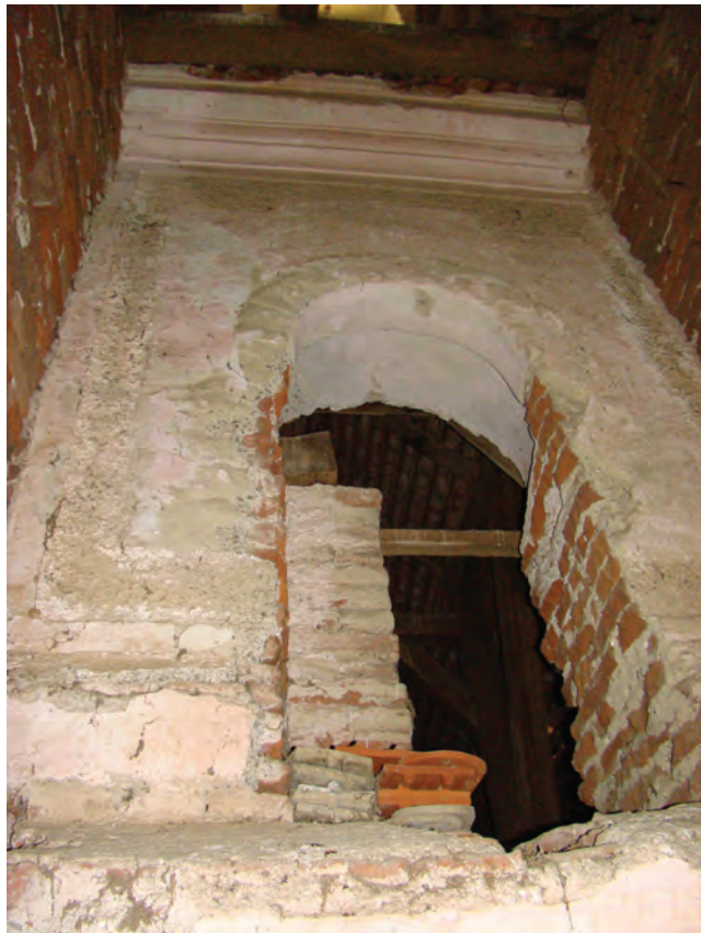
Sl. 8 Ostaci izvorne dekorativne kompozicije i okulus na zabatu zapadnog pročelja iz prve graditeljske faze

krovišta, s povijenim bočnim stranicama i bogatom arhitektonskom raščlambom, zabat je bio zamišljen kao vizualni akcent pročelja. U središnjem polju zabata nalazio se kružni prozor (okulus), koji su s obje strane uokvirivali pilastri s toskanskim kapitelima noseći trokutasti timpanon uokviren bogato profiliranim vijencima. 27 (Sl. 9 i 10)