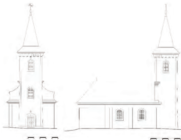
Sl. 4 Zapadno i sjeverno pročelje (crtež: Z. Fumić, Koping d.o.o Požega, 2012.)

Naselje Gazije smješteno je na sjevernim padinama Krndije, na 195 metara nadmorske visine, u općini Feričanci. Do sela se dolazi lokalnom cestom koja iz Feričanaca vodi prema jugu i dalje kroz šumu povezuje selo s Duzlukom i manastirom Orahovica. Zbog udaljenosti od glavnih prometnica i smještaja među šumovitim i vinogradima obraslim obroncima Gazije se doimaju kao idilično selo u očuvanom prirodnom okruženju. Idiličnom dojmu mjesta dodatno pridonosi potok Babina voda, uz koji se selo rasprostire, a na kojem se i danas nalazi očuvana vodenica. 2