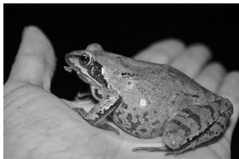
SLIKA 3. Ženka šumske smeđe žabe ( Rana dalmatina )

FIGURE 3. The Agile Frog, female ( Rana dalmatina )