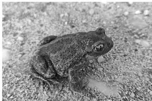
SLIKA 4. Češnjača ( Pelobates fuscus ) ulovljena u Selnici godine 2020.

FIGURE 3. The Agile Frog, female ( Rana dalmatina )