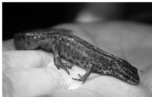
SLIKA 5. Mali vodenjak ( Lissotriton vulgaris )

FIGURE 4. Common Spadefoot Toad ( Pelobates fuscus ) caught in Selnica in 2020