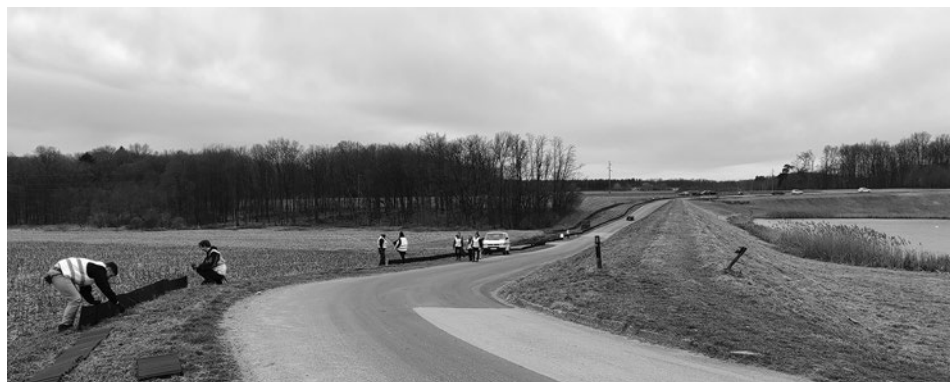
SLIKA 2. Ograda za vodozemce na lokaciji Dragoslavec

FIGURE 1. Action of setting up a fence for amphibians in Selnica