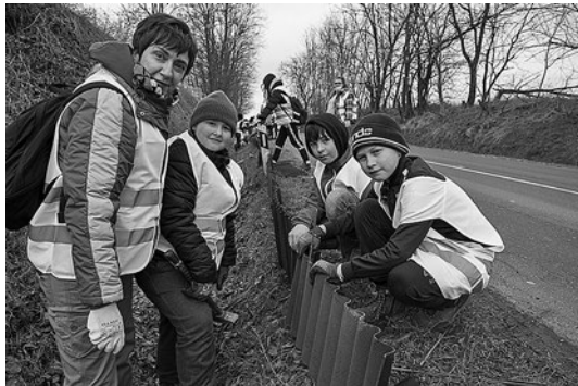
SLIKA 1. Akcija postavljanja ograde za vodozemce na lokaciji Selnica

koja prolazi uz retenciju Dragoslavec (slika 2). U svakodnevni obilazak crne točke najvećim dijelom bili su uključeni učenici Srednje škole Čakovec te Gimnazije Josipa Slavenskog Čakovec.