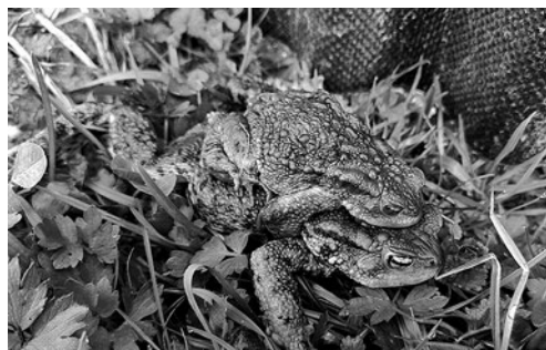
SLIKA 6. Smeđe krastače ( Bufo bufo ) u amplexusu

FIGURE 5. Common Newt ( Lissotriton vulgaris )