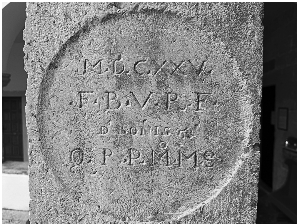
Franjevački samostan u Krku

je učinjena i što je prikazivala, tj. prostor u kojem je napravljena. Jedino što se predviđa jest to da je u svoje vrijeme bila kapela ili čak i crkva. Vrijeme nastanka ove freske pretpostavljaju u 13. ili 14. stoljeće.