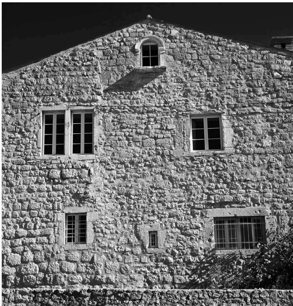
Franjevački samostan u Krku