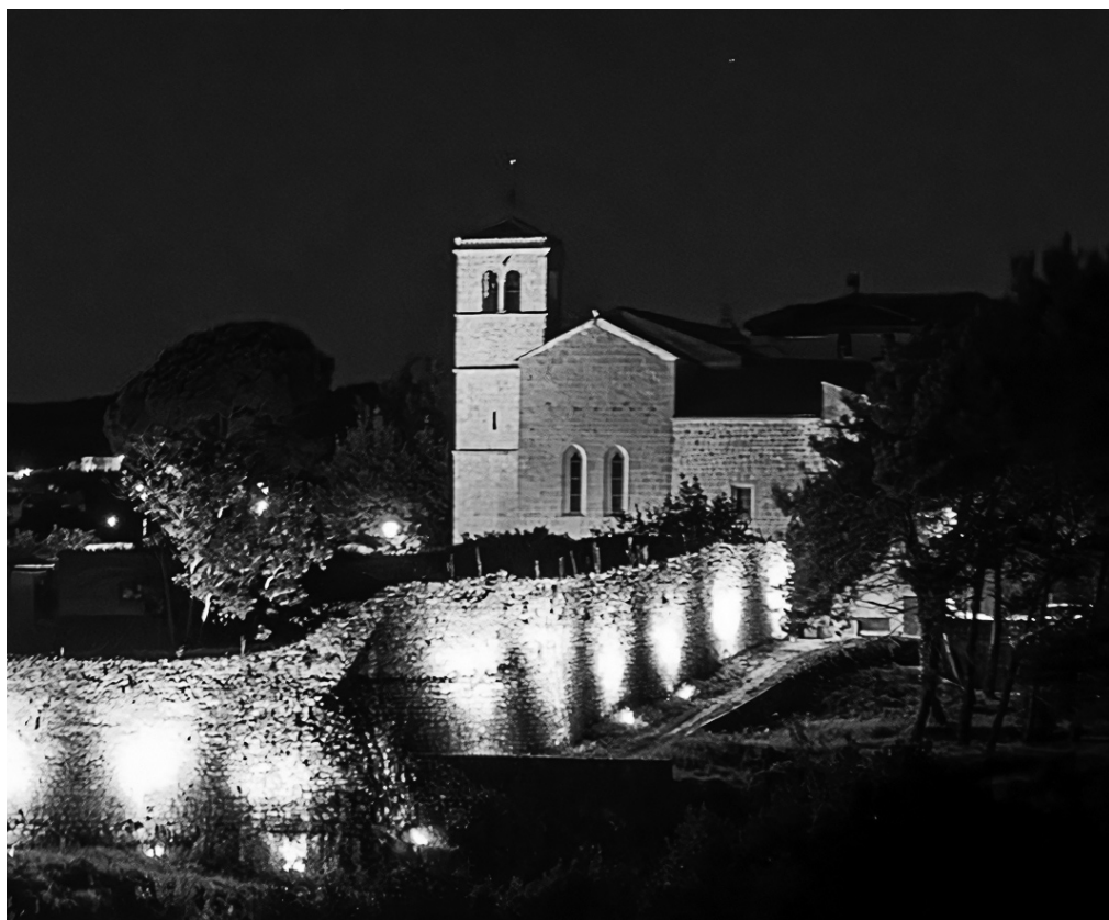
Franjevački samostan u Krku

nom Bartolomeom Defendinom daju dozvolu da može graditi kapelicu, oltar i grobnicu u crkvi sv. Franje, i to „il luogo sopra l' Altar di San Giovanni verso campana grande et dirimpetto della Capella di S. Nicolo“. 11