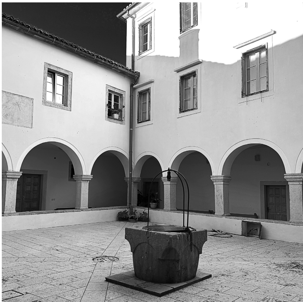
Franjevački samostan u Krku

Hoc sepulcro Joan. Franc. D. Bonamard Monte Scil. et civis egregius et procv. aedis S. Franc. optimos volvit tumolari quod suos haeredes pie ac libere iussit possedere. MCCCCLXXXVI Nonis Sept.