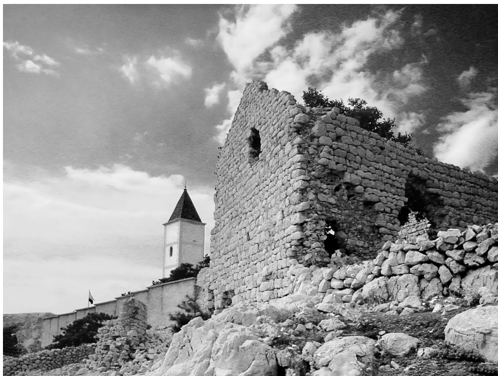
Ostaci starog naselja uz crkvu sv. Ivana