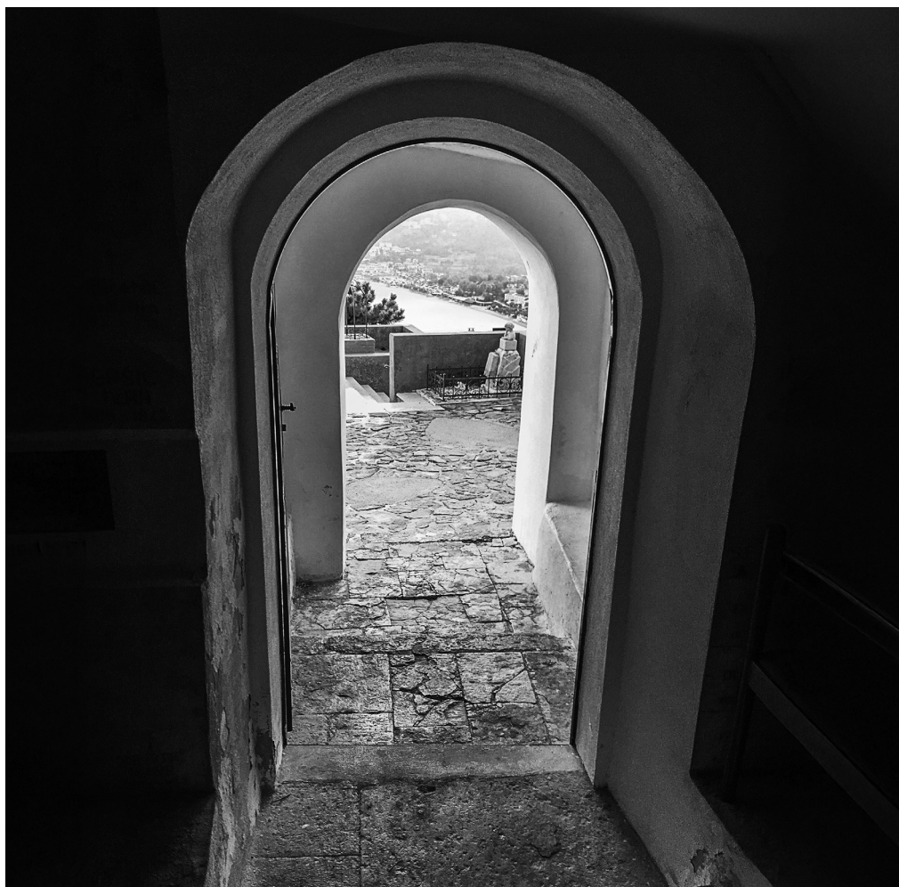
Crkva sv. Ivana