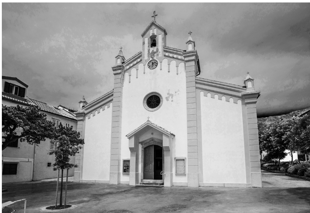
Župna crkva Presvetog Trojstva

smjernicama u bašćanskoj je župnoj crkvi postignuta u zadanom prostoru skladna cjelina svetišta u povezivanju novoga i staroga oltara prema puku s vrijednim povijesnim baroknim oltarom.