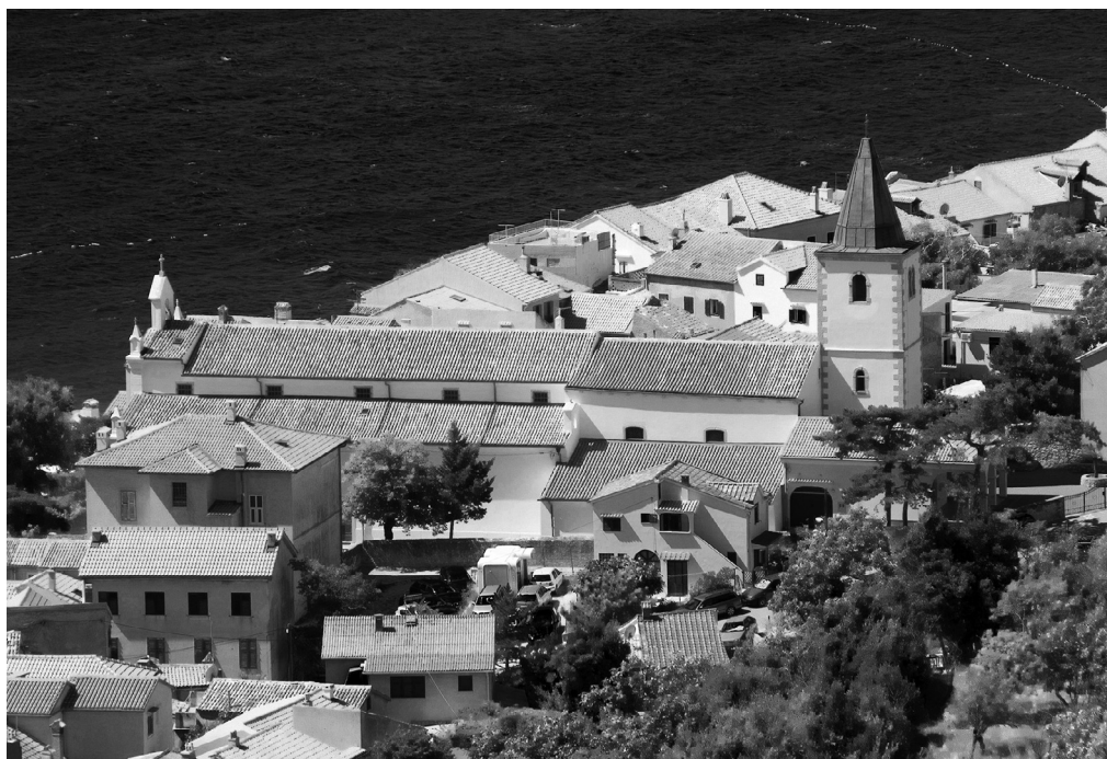
Nova župna crkva u Baški Presvetog Trojstva – Sveta Trojica

vrijedno djelo pavlinske radionice iz Senja, s prijelaza iz 17. u 18. stoljeće. Sa svake strane oltara su po dva okrugla stupa koji nose gornji dio retabla. U sredini gornjega, manjega oltarnog dijela kipovi su Svete obitelji: Marije, Josipa i Djeteta Isusa, a oko njih je više svetaca. Između stupova donjeg, većeg dijela oltara i s vanjske strane po dva su sveca: sv. Valentin, sv. Ivan Nepomuk, sv. Sebastijan i sv. Rok, a nad stupovima kipovi su anđela. U središnjem dijelu retabla prevladava velika oltarna pala iz 1724. godine, nedavno otkriveno najvrjednije djelo krčkoga svećenika i baroknoga lokalnog slikara Franje Jurića ( Francisco Juriceo ). Slika Krunjenje Bogorodice sa svecima , izrađena prigodom posvete crkve i oltara, prikazuje u gornjem dijelu Presveto Trojstvo, okruženo razigranim anđelima, kako kruni Bogorodicu, a u donjem su dijelu sv. Ivan Krstitelj, sv. Jeronim, sv. Petar, sv. Ivan evanđelist i sv. Zaharija. Ispod slike na oltarnoj menzi smješteno je svetohranište.