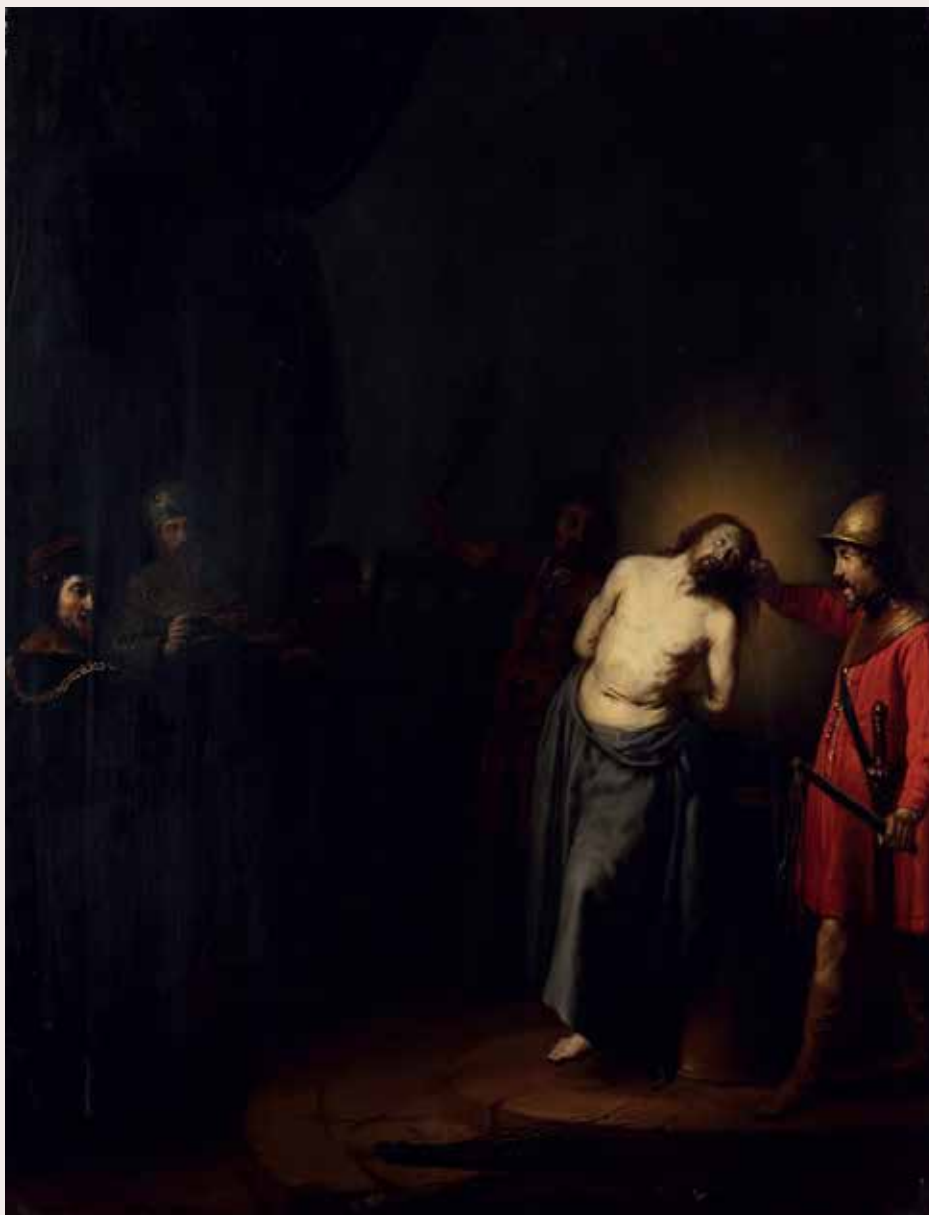
Dirck Santvoort, Bičevanje Krista, oko 1635., Strossmayerova galerija starih majstora HAZU-a