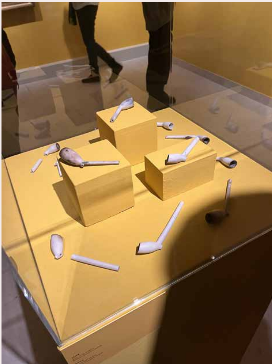
Porculanske lule