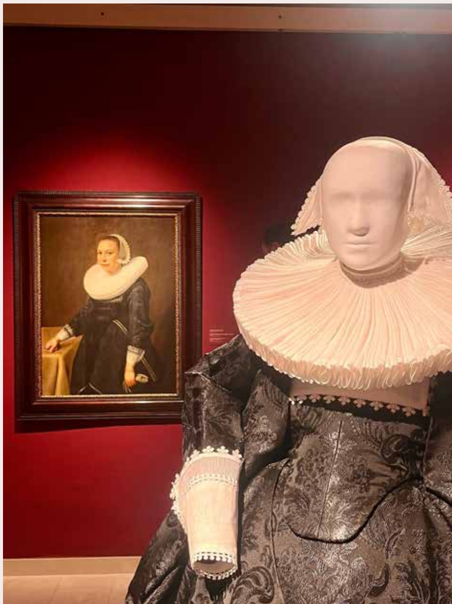
Replika odjevne kompozicije i Portret otmjene dame prema kojemu je nastala