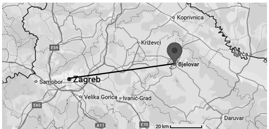
Slika 6. Prikaz zračne udaljenosti Zagreb-Bjelovar

Bjelovar je povezan sa Zagrebom željeznicom i cestama. U izgradnji je i brza cesta Zagreb – Bjelovar koja bi znatno trebala skratiti vrijeme putovanja. Danas je potrebno više od sat vremena, a izgradnjom brze ceste skratit će se na 35 do 40 minuta.