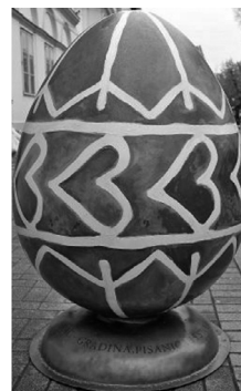
Slika 7. Spomenik najstarijoj pisanici ispred bjelovarskog muzeja