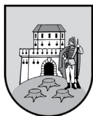
Slika 1. Grb Bjelovara

Bjelovar ima vrlo živopisan grb. Na zelenom brijegu su tri smeđa hrastova panja, u pozadini četverouglasta utvrda s crvenim krovom. Ispred utvrde stoji vojnik s puškom. Grb je nastao kad je odlukom bana Ivana Mažuranića Bjelovar proglašen slobodnim kraljevskim gradom.