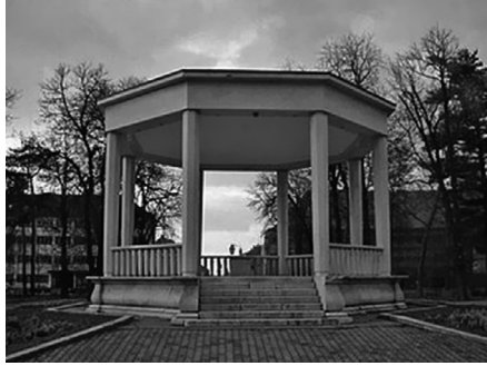
Slika 4. Glazbeni paviljon u središtu starog dijela Bjelovara

U sredini parka nalazi se glazbeni paviljon tlocrta pravilnog osmerokuta – oktogona. Sagrađen je 1943. od bračkog kamena. Najveći je takav u Europi.