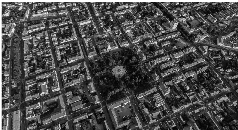
Slika 3. Središte Bjelovara iz zraka

Grad je projektiran i izgrađen u obliku utvrde podijeljene na 36 blokova. Središte grada čine četiri središnja bloka.