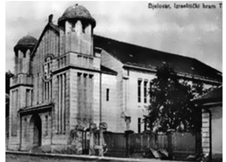
Slika 5. Razglednica sa sinagogom prije 2. svjetskog rata

Bjelovar je povezan sa Zagrebom željeznicom i cestama. U izgradnji je i brza cesta Zagreb – Bjelovar koja bi znatno trebala skratiti vrijeme putovanja. Danas je potrebno više od sat vremena, a izgradnjom brze ceste skratit će se na 35 do 40 minuta.