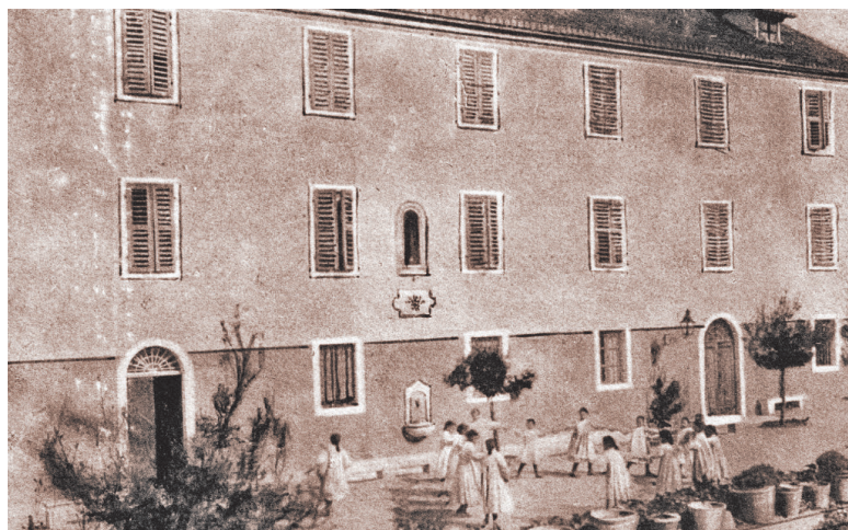
Slika 3 Collegio di educazione femminile diretto dalle Ancelle della Carità in Spalato