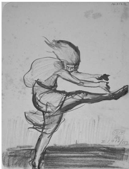
13. Plesačica Gertrud Leistikow, 1917, tinta i kreda u boji na papiru, Zbirka dr. Josipa Kovačića: Hrvatske slikarice rođene u 19. stoljeću, Muzej grada Zagreba, inv. br. MGZ-76816

Ples Anke Krizmanić možemo usporediti s načelom animacije – krajnje pozicije pokreta u mapi nižu se kao filmska sekvenca, pa se listanjem stječe dojam animiranoga pokreta u vremenu (sl. 14. mapa drvoreza Ples , 1917.). Iz pisama koje je Anka Krizmanić slala tetki iz Dresdena vidljivo je kako je uvelike zaokupljena izradom filmskih plakata i izriječom spominje neke od filmova koje je gledala ( Das fremde Mädchen , 1913.; Erlkönigs Töchter , 1914.), ističući kako se sada intenzivno posvetila »kinu s mojim omiljenim temama«, 20 što nam zorno otkriva film kao važno mjesto oblikovanja njezine vizualne kulture te načina likovnog promišljanja i dočaravanja pokreta.