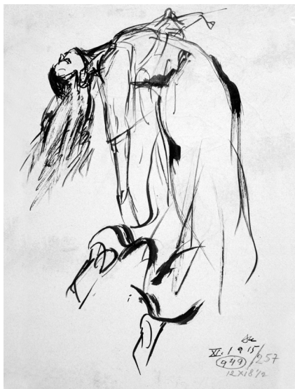
9. Grete Wiesenthal , 1915, tuš kistom na papiru, Zbirka dr. Josipa Kovačića; Hrvatske slikarice rođene u 19. stoljeću, Muzej grada Zagreba, inv. br. MGZ-76780; foto: Miljenko Gregl

coznim potezom, koji nosi sugestivnost brzine pokreta – dupliranjem, gustoćom linija stvara dojam stupnjevanja pokreta – kao da vidimo raniju i kasniju sekvencu zbog pojave sporog oka, kada pogled nije u stanju precizno percipirati pojavu koja mu izmiče. Jednako tako, lice je često zamagljeno, u čemu prepoznajem efekt zamućenja do kojega dolazi pri fotografiranju tijela u pokretu. Također, dijelovi tijela mjestimično kao da iščezavaju, nestaju – što sugerira brzu izmjenu pokreta, pojavljivanje i nestajanje, zapravo efemernost pokreta (sl. 10. Grete Wiesenthal , 1915.). Takav fokus na prikaz brzine pokreta likovnim sredstvima idejno ju približava tada aktualnome futurizmu.