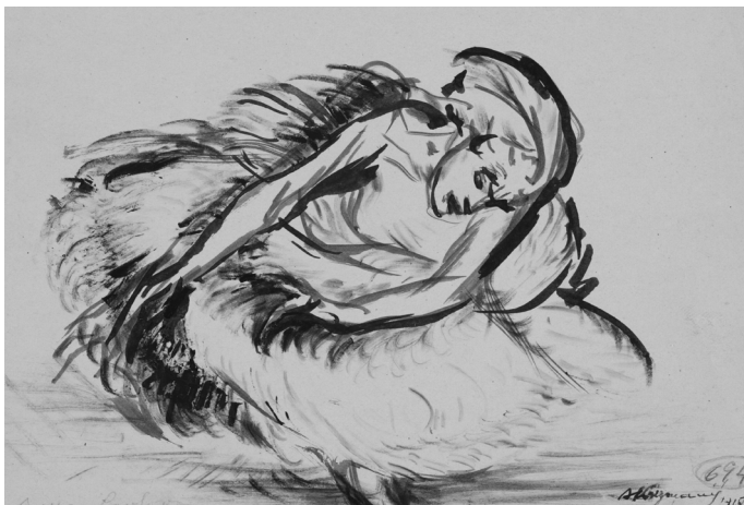
3. Plesačica »Labud«, 1915, tuš kistom na papiru, Zbirka dr. Josipa Kovačića: Hrvatske slikarice rođene u 19. stoljeću, Muzej grada Zagreba, inv. br. MGZ-76765