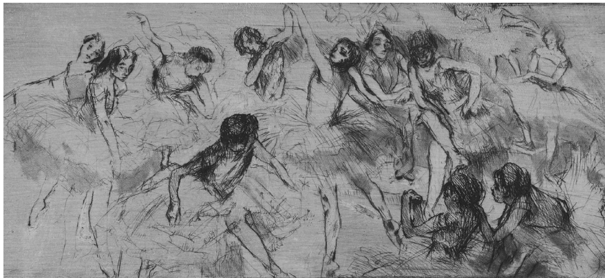
5. Baletese , 1915, radirung, Zbirka Kovačić-Mihočinec, Zagreb; foto: Filip Stolnik

lješke, no riječ je o gotovim i upravo tako zamišljenim grafičkim djelima – Anka Krizmanić urezuje ih u bakrene ploče, u litografski kamen, što isključuje mogućnost da je riječ samo o skicama (sl. 5. Baletese , 1915.).