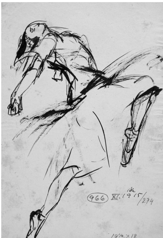
7. Plesačica Grete Wiesenthal – slobodne invencije VI , 1915, tuš kistom na papiru, Zbirka dr. Josipa Kovačića: Hrvatske slikarice rođene u 19. stoljeću, Muzej grada Zagreba, inv. br. MGZ-76683; foto: Miljenko Gregl

2010: 73–101). Tu kretnju savijanja tijela unatrag možemo i metaforički čitati kao pokušaj slobodnoga udisaja žena sapetih korzetom, odnosno njihovog oslobađanja od društvenih »okova«.