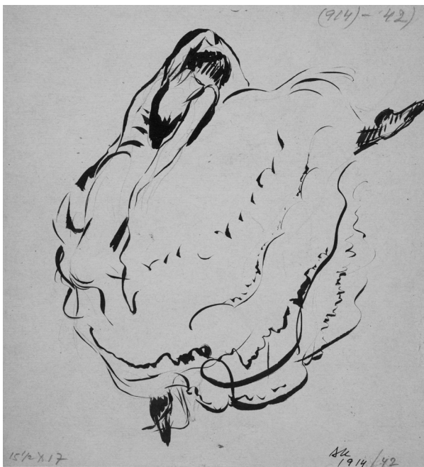
6. Plesačica Ana Pavlova – slobodne invencije II , 1914, tuš kistom na papiru, Zbirka dr. Josipa Kovačića: Hrvatske slikarice rođene u 19. stoljeću, Muzej grada Zagreba, inv. br. MGZ-76664; foto: Miljenko Gregl