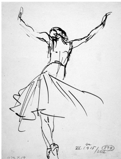
8. Plesačica Grete Wiesenthal – slobodne invencije II , 1915, tuš kistom na papiru, Zbirka dr. Josipa Kovačića; Hrvatske slikarice rođene u 19. stoljeću, Muzej grada Zagreba, inv. br. MGZ-76679; foto: Miljenko Gregl