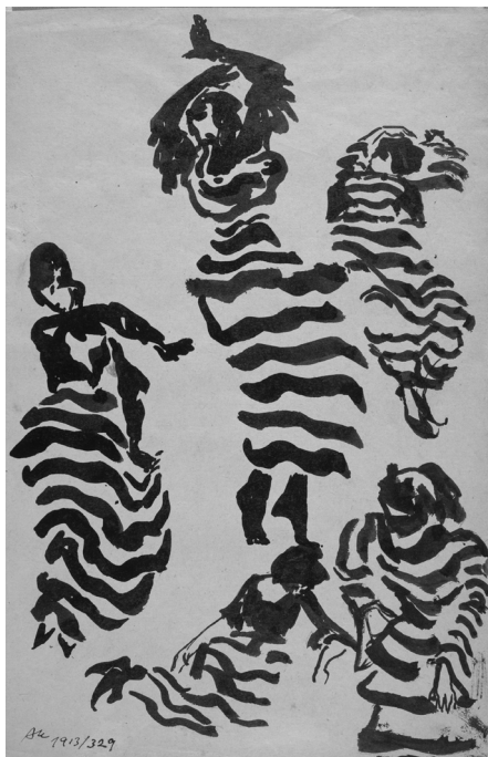
2. Plesačica – Španjolka II , 1913, tuš kistom na papiru, Zbirka dr. Josipa Kovačića: Hrvatske slikarice rođene u 19. stoljeću, Muzej grada Zagreba, inv. br. MGZ-76742

haljine multipliciraju jedan pokret do nepredvidivih dimenzija: svaki volan pleše svoj ples, kao da haljina ima vlastiti život. I upravo taj život draperije Anka Krizmanić u svojim crtežima pretvara u ornament. Koristeći se stilskim oznakama secesijske provenijencije (naslijeđenima od Tomislava Krizmana, kod kojega je učila u Zagrebu prije dolaska u Dresden, i Gustava Klimta, kojeg je spominjala kao svoj rani likovni uzor [Kovačić 1983: 7]) – stilizacijom, S-linijom tijela te naglašenom plošnošću i linearnošću – uspostavila je karakterističan uzorak ritmiziranih valova, kojima sugerira neprekidnu transformaciju haljine u pokretu.