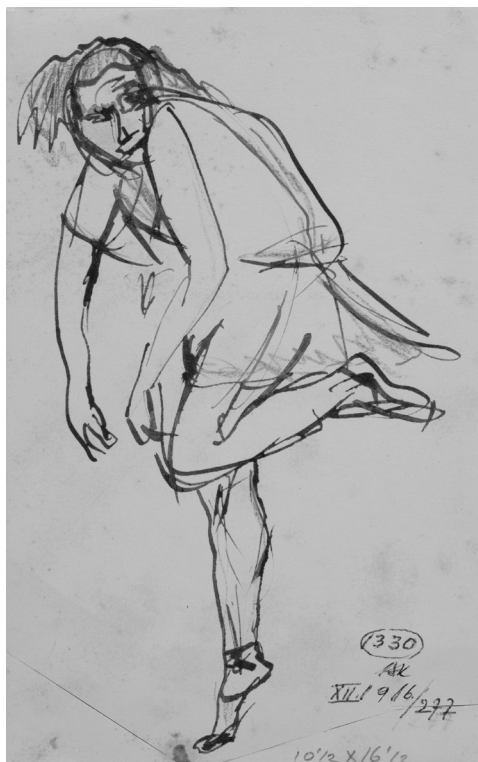
11. Vježbe škole Leistikow , 1916, tinta, kreda na papiru, Zbirka dr. Josipa Kovačića: Hrvatske slikarice rođene u 19. stoljeću, Muzej grada Zagreba, inv. br. MGZ-76802

Ekspresivni ples ukida ljepotu, ženstvenost, finoću i sklad pokreta te nastoji izraziti »istinu« ljudske egzistencije, a kako njegova pojava koincidira s vremenom Prvoga svjetskog rata – emocije koje se izražavaju pokretom su strah, tjeskoba, trauma, očaj. Pokret gubi kontinuitet i fluentnost te je za njega karakteristično neujednačeno trajanje kretnji odnosno izmjena od izrazito sporih do jako brzih – gotovo trzajnih, koje rezultiraju nedopadljivim zatvorenim, grotesknim i grčevitim