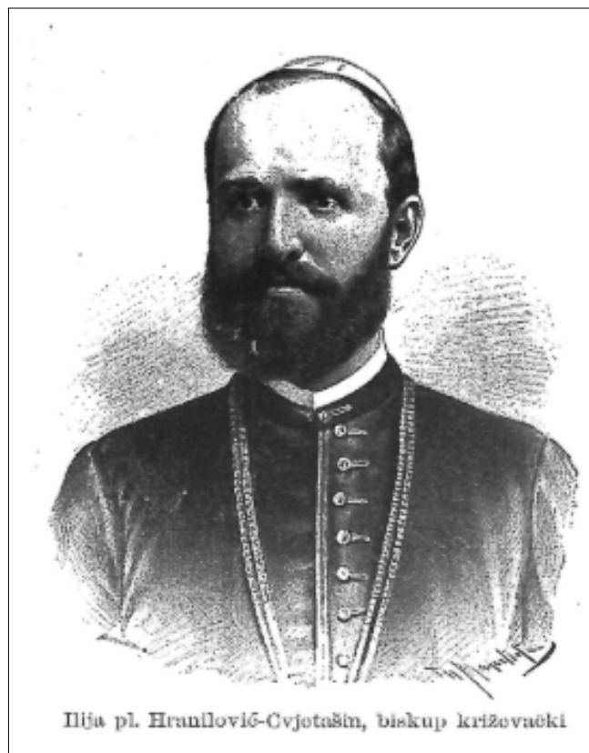
Ilija pl. Hranilović-Cvjetašin, biskup križevački

Slika 1. Dom i svijet II, (Zagreb, 1889.), br. 8 (15.4.1889.), str. na str. 127.