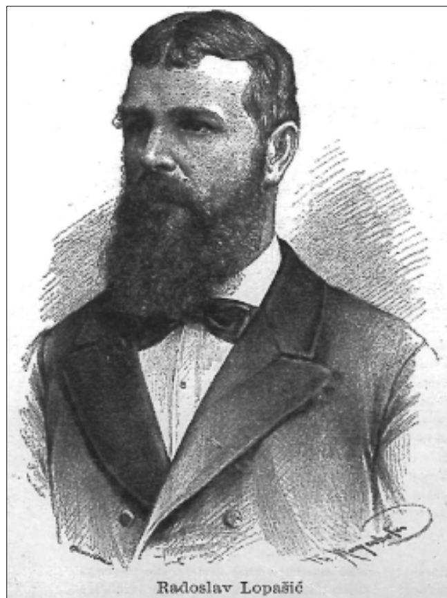
Slika 4. Dom i svijet II, (Zagreb, 1889), br. 16 (15.8.1888.), str. 251-266, na str. 251.

nim rukama. Strossmayer je na to odmah odgovorio, obećavši da će »prvom prilikom« Račkome poslati navedeni iznos. 156