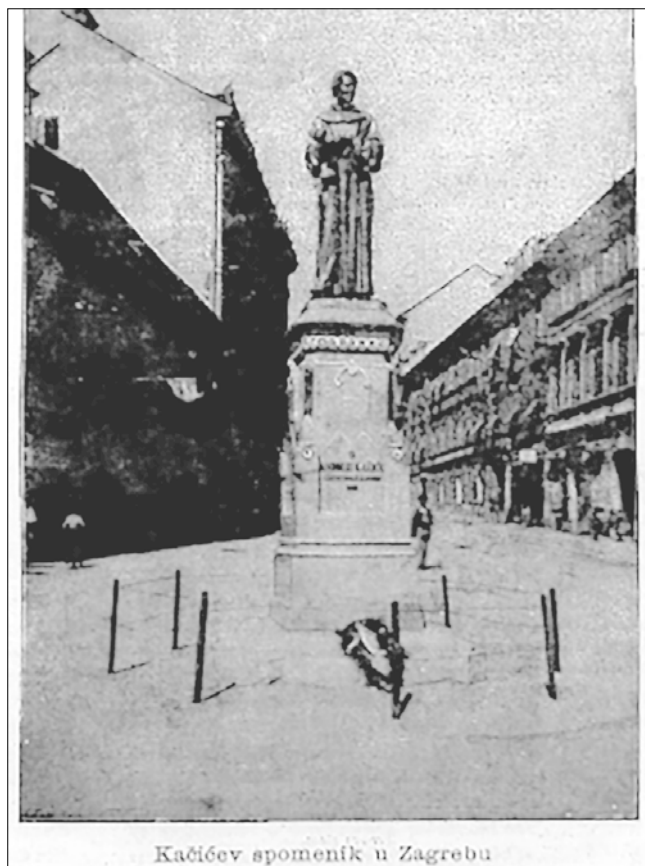
Kačićev spomenik u Zagrebu

Slika 5. Dom i svijet IV, (Zagreb, 1892), br. 2 (15.1.1892), str. 21-36, na str. 29.