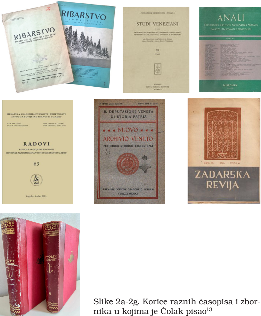
Slike 2a-2g. Korice raznih časopisa i zbornika u kojima je Čolak pisao 13