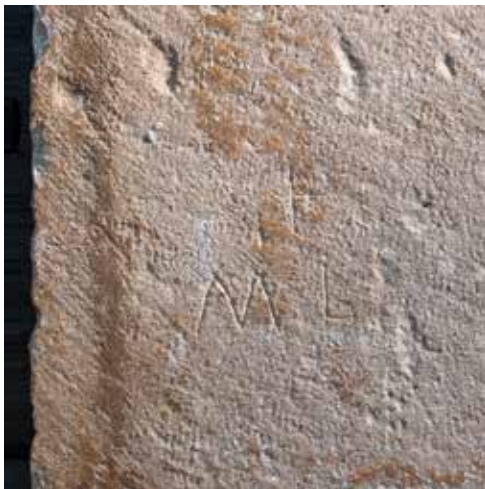
Sl. 3. b. Natpis s inicijalima ML, detalj