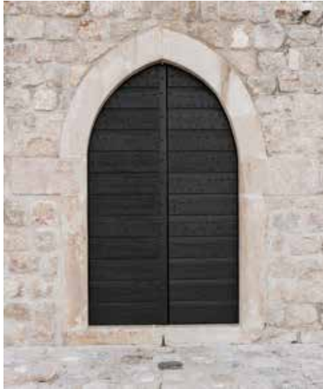
Sl. 4. a. Ulazna vrata s natpisima na petama lukova.

Početkom sljedeće godine, 13. siječnja 1446., oficijali dobivaju ovlast za gradnju prema nacrtu, 30 a nekoliko dana kasnije, 29. siječnja, i ovlast sklapati ugovore za izgradnju. 31 Naredni je mjesec sklopljen ugovor o gradnji. 32 Drugi nadstojnik gradnje, Petar Poča, nalazi se i na natpisu šipanskog dvora, gdje je 1450. godine također bio oficijal. Naveden je kao S . PIERO . DE . POČA.