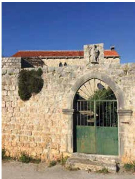
Sl. 5. a. Knežev dvor na Šipanu. Ulazna vrata s natpisom i kipom sv. Vlaha.