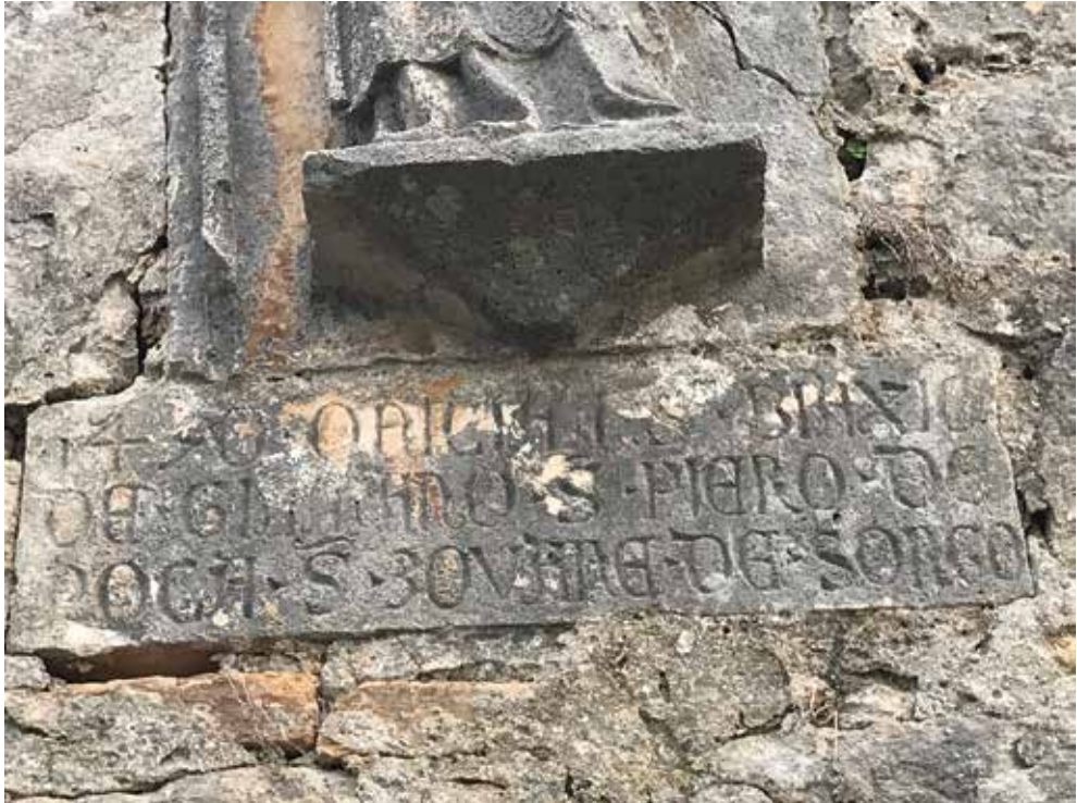
Sl. 5. c. Natpis iznad ulaznih vrata.