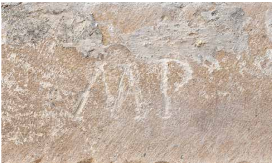
Sl. 2. a. Inicijali MP na nad vratniku dvorišnih vrata.

Nemoguće je otkriti kojem bi od njih trojice pripadali inicijali. Prednost daje Marinu Poči koji je za kneza izabran 6. studenog 1598. godine. Umro je sljedeće, 1599. godine, vjerojatno tijekom obnašanja funkcije kneza. Moguće da su mu prijatelji iz zahvalnosti inicijale na vrata uklesali nakon smrti.