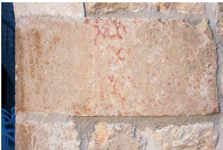
Sl. 4. c. Natpis na desnoj peti luka. U donjoj lijevoj strani natpisa vidljivi su inicijali ML prethodnog natpisa.