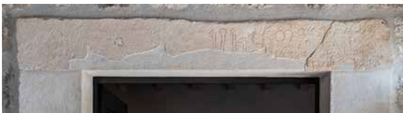
Sl. 1. b. Obnovljeni nadvratnik.