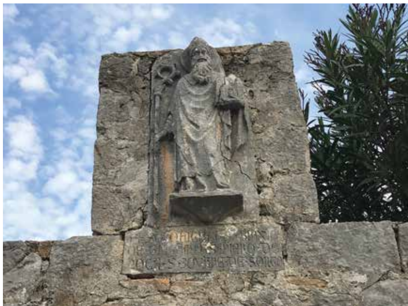
Sl. 5. b. Kip sv. Vlaha s natpisom.