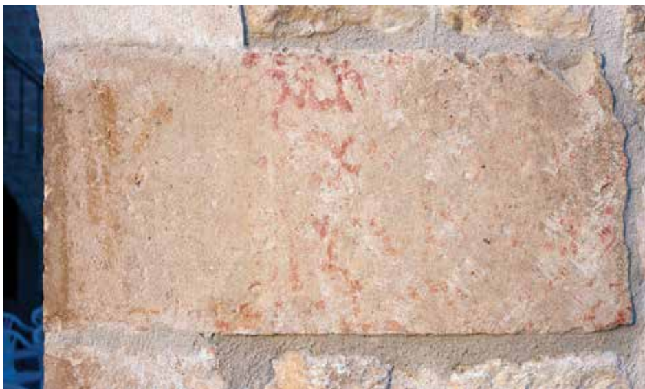
Sl. 3. a. Natpis s inicijalima ML na desnoj strani pete luka.

Prednost dajem Mihu Luchariju, jer bi bilo manje vjerojatno da je preko natpisa iz 1447. netko urezao inicijale prvih desetljeća nakon njegova nastanka dok je bio dobro vidljiv.