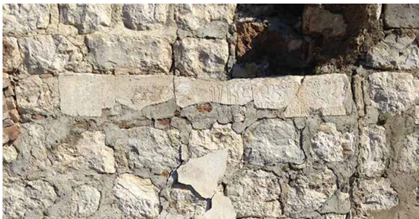
Sl. 1.a. Nadvratnik s natpisom prije obnove.