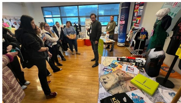
Sl.5 TZG 2025 – predavljanje izlagača

Održane su i dvije radionice s temom digitalnog tiska, na kojima su predstavljene mogućnosti rada DTF strojeva najnovije generacije. U prezentacijskom dijelu su predstavnici tvrtki Azonprinter d.o.o. i Nanodiy d.o.o. održali radionice, a izlagači su predstavili svoje tehnologije tiska i proizvode (sl.5).