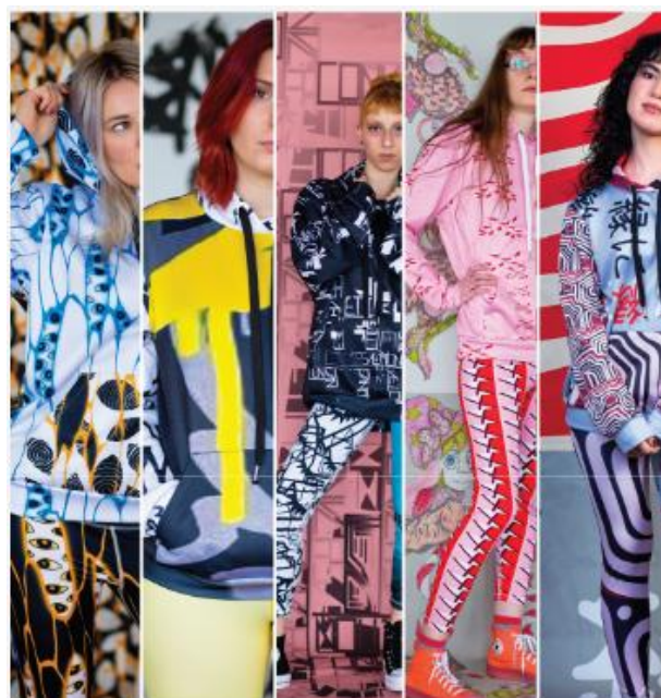
Sl.6 TZG 2025 – izložba studenata Sveučilišta u Zagrebu Tekstilno-tehnološkog fakulteta „ONVERS RAPORT“