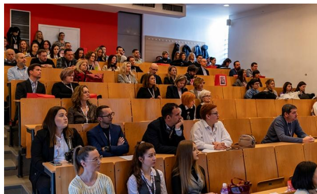
Sl.8 TZG 2025 - sudionici, foto: Branko Nađ, Akademski.hr, Portal Sveučilišta u Zagrebu

Temeljni cilj savjetovanja Tekstilna znanost i gospodarstvo prije svega je pružiti priliku kontinuiranog povezivanja i umrežavanja gospodarskih subjekata i akademske zajednice, ali i doprinijeti razvoju struke kroz zajedničke istraživačke, razvojne i stručne projekte. Svake godine bira se tema temeljem interesa i problematike iz gospodarstva, kako bi se odgovorilo na smjer razvoja i prepoznate potrebe. Ovogodišnjem savjetovanju je nazočio velik broj gospodarstvenika, predstavnika ministarstava, predstavnika akademske zajednice (sl.8), te mediji čime je ostvaren cilj ovogodišnjeg savjetovanja Tekstilna znanost i gospodarstvo 2025. - zblizavanje Fakulteta i gospodarskog sektora.