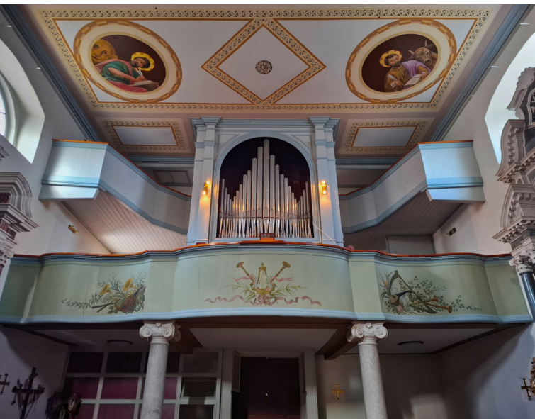
Slika 9. Orgulje G. Moscatellija (1799.) u župnoj crkvi Uznesenja Marijina u Sutivanu