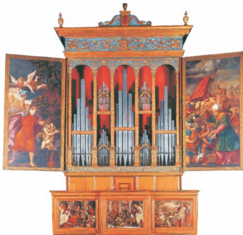
Slika 2. Orgulje V. Colombija (1532./1533.) u crkvi Presvetoga Tijela Kristova u Valvasoneu 23