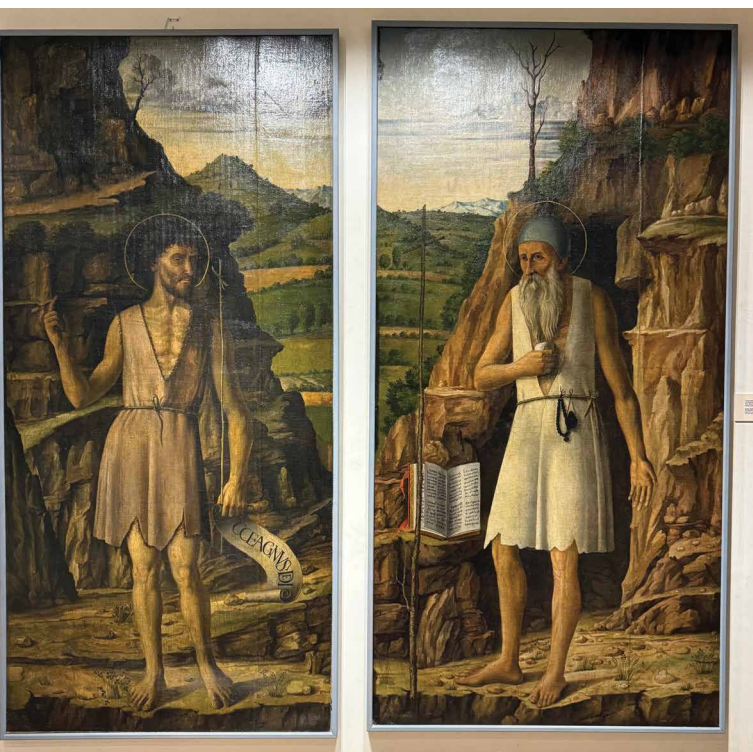
Slika 1. Oslikane vratnice fra Urbanovih orgulja (1485.) iz trogirске katedrale sv. Lovre, Muzej sakralne umjetnosti u Trogiru