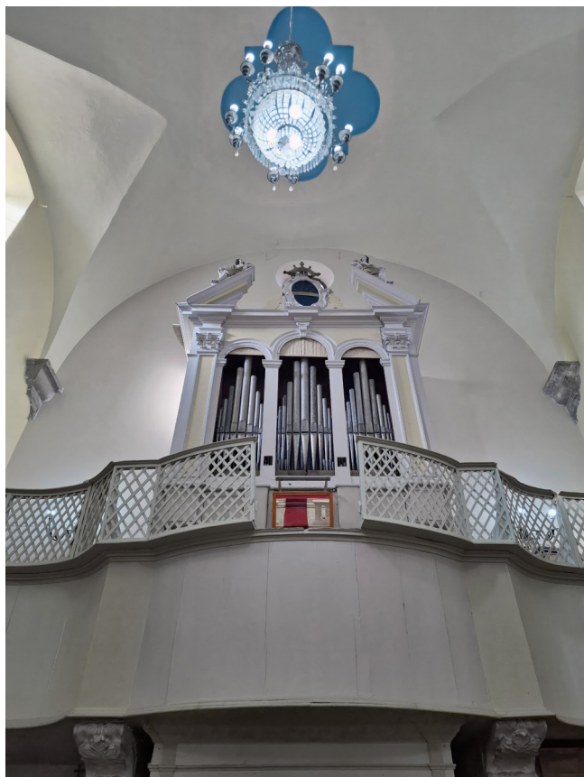
Slika 6. Orgulje don P. Nakića (1753.) u župnoj crkvi Gospe od Karmela u Nerezšićima

iznos bio je dovoljan za 72 % ukupnih troškova i po prilici je pokrivaio cijenu Nakićeva orguljarskoga posla, 47 a ostatak se vjerojatno pobrinula uprava nerezliške crkve.