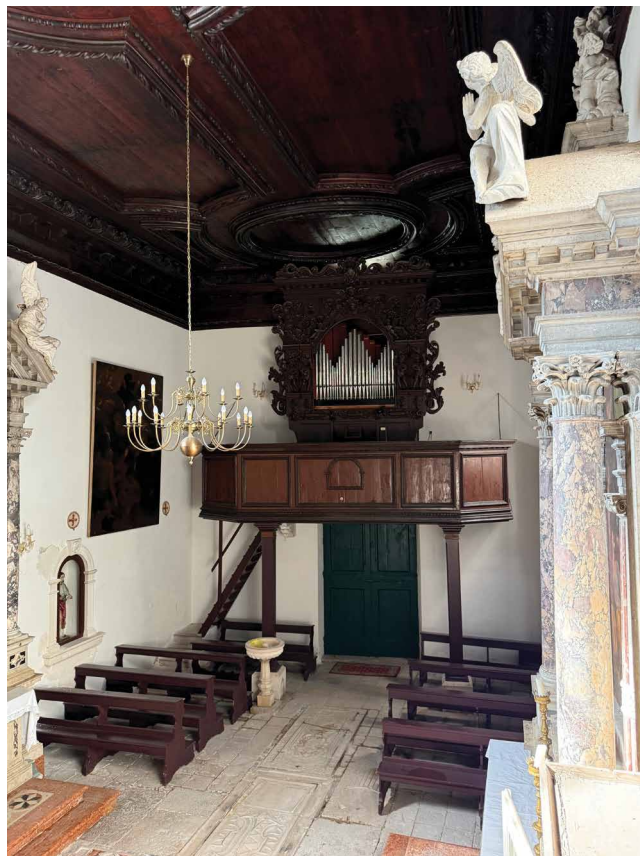
Slika 3. Orgulje (1685. i 1899.) u crkvi sv. Petra u Trogiru