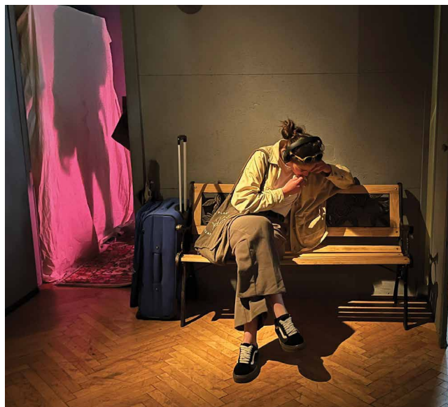
Slika 5. Iz kuće izišao čovek , Split, 2025.

s pozornošću i međusobnim razumijevanjem komponirali zajednički izlagački/izvođački prostor. U ishodu, Iz kuće izišao čovek bila je višemedijska prostorna instalacija, sačinjena od šest pojedinačnih autorskih iskaza, objedinjenih u značenjsku i prostornu cjelinu. Ulazak publike u prostor, njezino kretanje i/ili zadržavanje i komunikacija s pojedinačnim radovima donijeli su nove slojeve čitanja i razumijevanja ukupnog konteksta u kojemu je rad nastao. Razlike u dinamici rada, načinima stvaranja skupine, brzini procesa, tretmanu prostora i upotrebi izražajnih sredstava i formā pokazao je širinu prostora za buduća istraživanja i promišljanja nastanka i realizacije samostalnih umjetničkih djela scenskog dizajna.