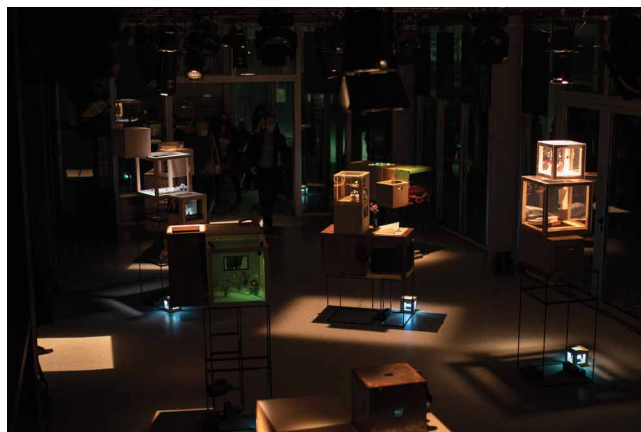
Slika 3. ( zamišljene ) Porodične priče , Novi Sad, 2022.

građe – obiteljskih arhivskih fotografija, predmeta i drugih dokumenata studenata te njihovim razgovorima s članovima obitelji. Tako su nastale pojedinačne osobne priče o konkretnim ljudima/likovima. Slijedilo je kreiranje situacija zasnovanih na ključnim rečenicama teksta, pa njihovo transponiranje u prostor, u kutije kao mjesta za skladištenje uspomena i sjećanja. Svatko je, zatim, u svoje četiri kutije smjestio prostorne instalacije objedinjujući ih u priču o jednoj osobi i jednom vremenu, a njihovim kronološkim povezivanjem nastao je zajednički rad. 10 Ovoga puta studenti su također bili heterogena prethodnog obrazovanja, a proces je trajao oko četiri mjeseca. Kao ishod, taj rad bio je složena višemedijska instalacija, nastala povezivanjem osam pojedinačnih priča – insceniranih sjećanja, ispričanih scenskim izražajnim sredstvima. Velika vrijednost rada bila je i u tome što su studenti sami dizajnirali prostor svojih kutija te tehnički realizirali rad, precizno i fino, na nivou ruke.