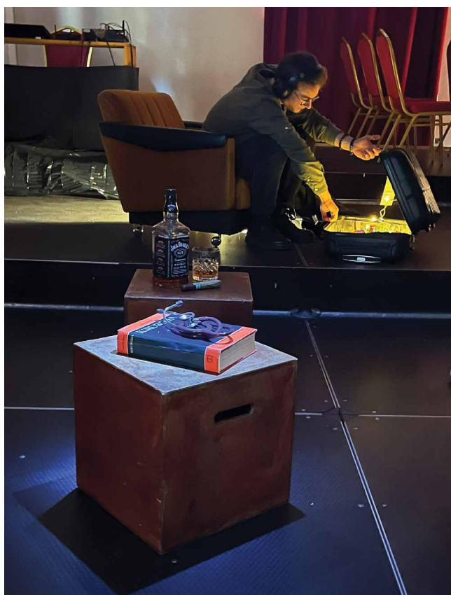
Slika 8. Iz kuće izišao čovek , Split, 2025.