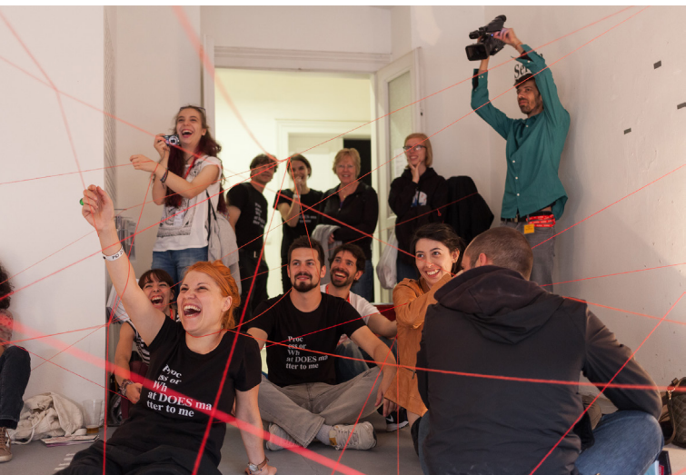
Slika 1. Proces ili Šta je stvarno VAŽNO za mene , Prag 2015.

je iz različitih dijelova svijeta dolazila i provodila vrijeme s njima tijekom 11 dana nastupanja, osam sati dnevno, gledajući izvođenja ili sudjelujući u njima, pa čak i razmjenjujući artefakte, pokazao je snagu njihovih autorskih iskaza.