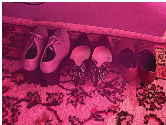
Slika 6. Iz kuće izišao čovek , Split, 2025.