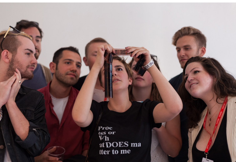
Slika 2. Proces ili Šta je stvarno VAŽNO za mene , Prag 2015.