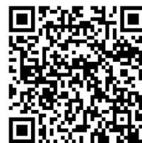
Slika 7. QR kod u notnom izdanju Napjevi iz Svirača , koji vodi na pripadajuću audio bazu dokumentiranih napjeva

Napjeve snimane u župnim crkvama, u tehnički kontroliranim uvjetima, studenti će analizirati i transkribirati i u sljedećim fazama rada, a notni će zapisi nastali tim postupkom biti objavljeni u tiskanim svescima serije Zvuci Velikoga tjedna . Mrežni arhiv dugoročno će služiti kao trajno dostupna zvučna baza glazbene baštine Velikoga tjedna u mjestima procesije Za križen , namijenjena široj javnosti, struci i lokalnoj zajednici. Zajedno, digitalni arhiv i tiskana izdanja čine interaktivni, komplementaran sustav dokumentiranja ove baštine u zvuku i u notnom zapisu.