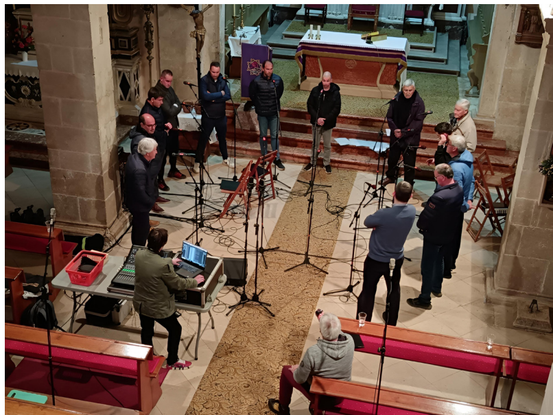
Slika 2. Višekanalna snimanja napjeva Velikoga tjedna u izvedbama lokalnih crkveno-pučkih pjevača (na slici: pjevači iz Vrboske u crkvi sv. Lovre, travanj 2025.)

Profesionalna audiosnimanja, ostvarena uz financijsku potporu Turističke zajednice Općine Jelsa, provedena su 26. ožujka 2024. u crkvi sv. Marije Magdalene u Svirčima te 9. i 10. travnja 2025. u crkvama sv. Lovre u Vrboskoj i sv. Duha u Vrbanju. Snimanje u Vrbanju dodatno je podržao Grad Stari Grad jer je riječ o jedinjoj župi procesijskog kruga izvan Općine Jelsa. Sve audiosnimke realizirali su hvarski snimatelji i producenti Luki Ljubić i Sandro Petrić, višekanalnom tehnikom snimanja, pri čemu je u trima župama ukupno zabilježeno više od pedeset napjeva. Njih su izveli lokalni pučki pjevači različitih dobnih skupina, najčešće aktivni u župnim zborovima i otočnim klapama, samostalno odabравši repertoar Velikoga tjedna za koji smatraju da je reprezentativan za njihovo mjesto.