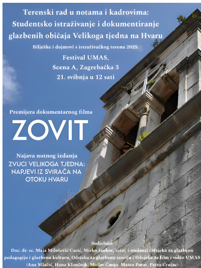
Slika 5. Plakat prvog predstavljanja dokumentarnog filma Zovit (Festival UMAS, svibanj 2025.)

Na temelju terenskoga snimanja u Vrbanju i Vrboskoj, provedena tijekom Velikoga tjedna 2025., dvije studentske filmske ekipe (po troje studenata s Odsjeka za film i video) snimile su opsežnu audiovizualnu građu za kratkometražne dokumentarne filmove Zovit – Vrbanj (autori: Petra Crnjac, Roko Matas i Mihael Bažoka) i Zovit – Vrboska (autori: Matea Parat, Mikula Nižetić i Vanja Mihajlov), koji su trenutačno u fazi montaže i postprodukcije (dovršen rough cut ). Realizacija je ostvarena uz financijsku potporu Ministarstva kulture i medija RH, kojom je omogućeno audiovizualno snimanje na terenu, a Muzej hvarske baštine podupro je postprodukciju, odnosno finalizaciju ovih dvaju kratkometražnih filmova, koja se očekuje do kraja 2025.