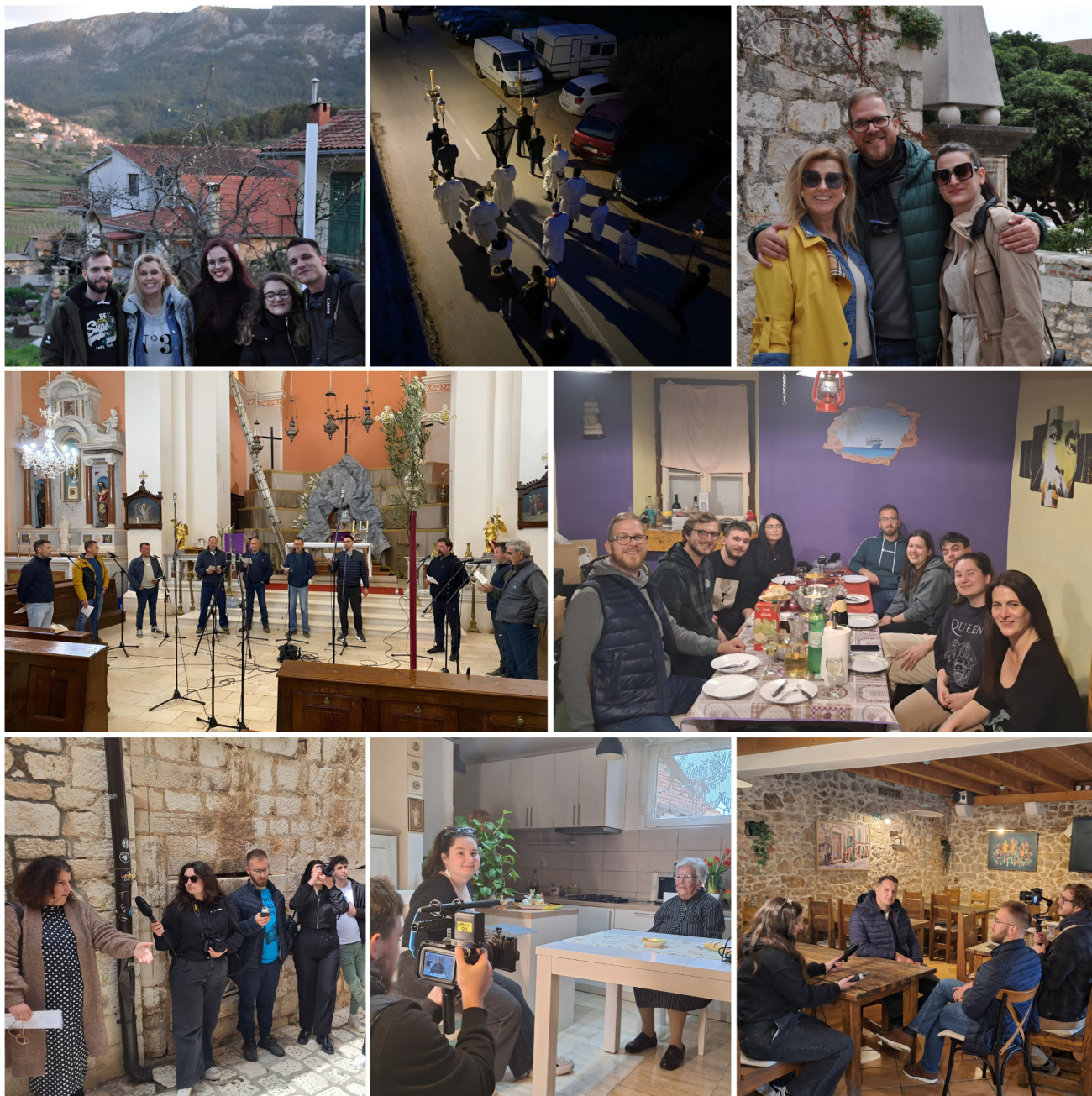
Slika 3. Prvi ciklus terenskog istraživanja u Svirčima (ožujak 2024.), uz sudjelovanje studenata i profesora UMAS-a