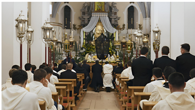
Slika 1. Procesija Za križen : posjeti postajama uz pjevanje Gospina plača (na slici: procesija iz Svirača u crkvi Uznesenja Marijina u Jelsi, ožujak 2024.)

Prvi se ciklus provodio 2024. pod nazivom „Istraživanje i dokumentiranje (glazbenih) običaja Velikoga tjedna u Svirčima na otoku Hvaru“, a u 2025. godini nastavljen je u okviru programa „Procesije Za križen i Velikoga petka: Glagoljaško pjevanje u Vrbanju i Vrboskoj na otoku Hvaru“. Unutar tih faza postupno se oblikovalo više razvojnih smjerala: dokumentarni filmski ciklus Zovit , nakladnička serija Zvuci Velikoga tjedna , kao i prateća digitalna baza dokumentiranih napjeva. Time se projektni program razvio u cjelovit sustav dokumentiranja i predstavljanja ove specifične glazbene, obredne i običajne baštine.