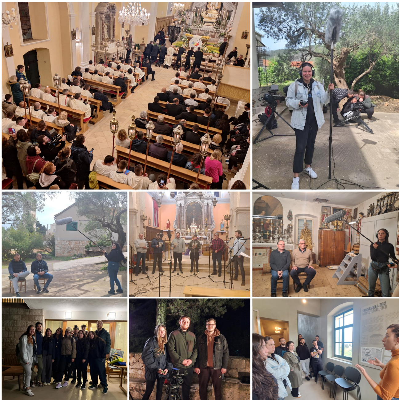
Slika 4. Terenska istraživanja u Vrbanju i Vrboskoj (travanj 2025.), u sklopu druge istraživačke etape projekta