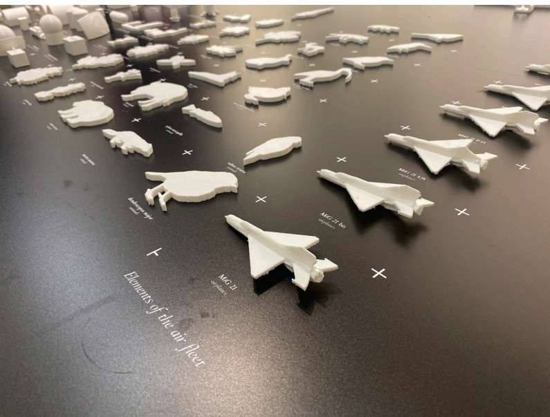
Slika 6. Detalj s izložbe Echoes of Power studenata Fakulteta arhitekture u Ljubljani