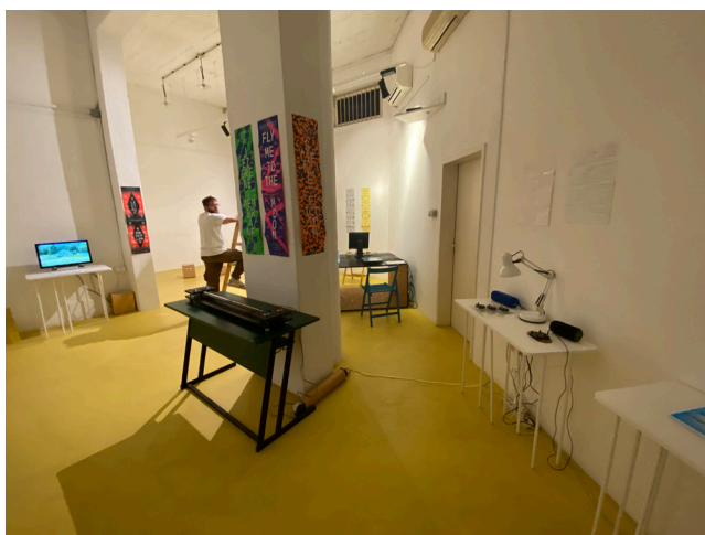
Slika 5. Studenti rade na postavljanju izložbe Signali, bitovi i surogati - Katalog elektro-entiteta S2 kolektiva Radiona

Treći didaktički aspekt Galerije vezan je za činjenicu da su studenti uključeni u proces realizacije izložaba, i to u svim njegovim fazama. Sudjeluju u koncipiranju i izvođenju izložbenog postava, dizajnu izložbene grafike, objavljuju najave na društvenim mrežama, komuniciraju s medijima i kulturnim platformama, dokumentiraju tijekom izložbe i za nju vezane događaje i sl. Na taj se način upoznaju s izlagačkim procesom i načinima prezentiranja radova stječući znanje koje će im biti korisno u budućem profesionalnom djelovanju.