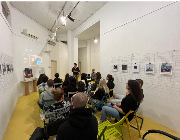
Slika 9. Predavanje i razgovor studenata DVK s talijanskim ilustratorom Emiliom Guazzone

Događaji u CTRL+Z s jedne se strane mogu promatrati kao odraz onoga što se događa u nastavnim procesima pri Odsjeku DVK-a i pri raznim drugim dizajnerskim školama, a s druge strane izložbeni program dijelom odražava i etički credo Odsjeka koji se manifestira u čestoj prisutnosti izložaba koje se bave društveno relevantnim temama.