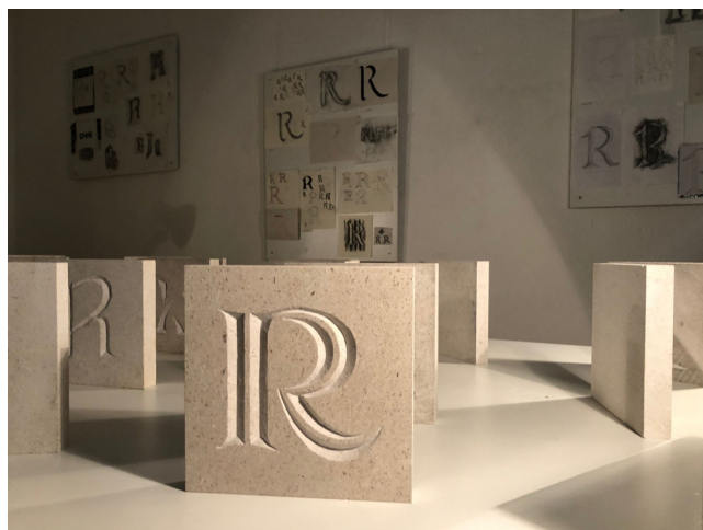
Slika 4. Detalj s izložbe radova nastalih na radionici Čekić i dlijeto - osnove klesanja slova koju je vodio grafički dizajner Marko Hrastovec