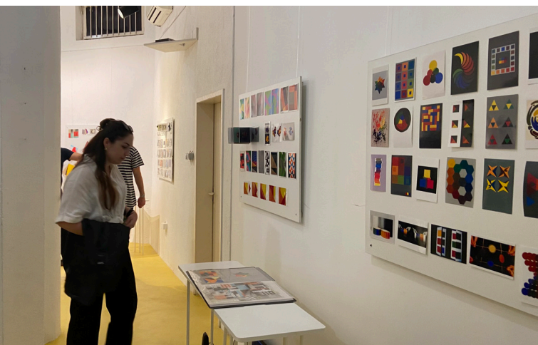
Slika 2. EVO! izložba radova nastalih kroz nastavu na predmetu Elementi vizualnog oblikovanja