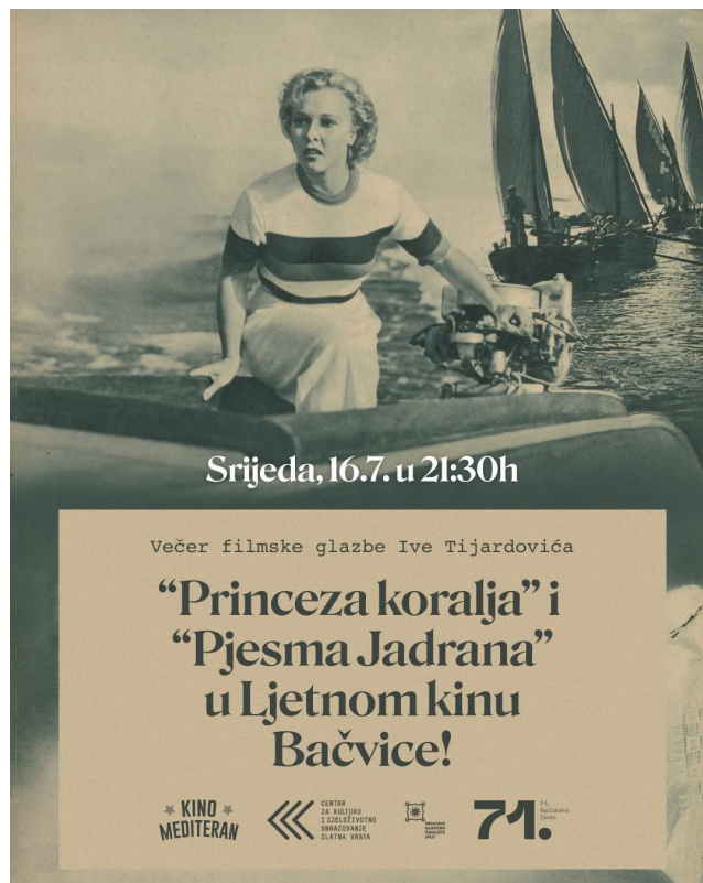
Slika 13. 71. Splitsko ljeto: Kino Mediteran / Zlatna vrata / HNK Split: Večer filmova s glazbom Ive Tijardovića: Kulturni filmovi Princeza Koralja i Pjesma Jadrana na platnu Kina Bačvice

Film Sinji galeb prikazan je u Hvaru 13. kolovoza, zatim u Jelsi 15. kolovoza, dok je Kapetan Mikula mali prikazan u Hvaru 30. srpnja, u Jelsi 31. srpnja, u Milni 22. kolovoza, u Komiži 5. rujna te u Lastovu 6. rujna 2025.