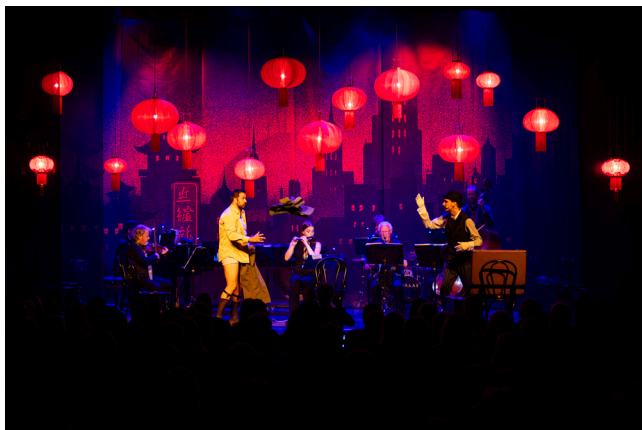
Slika 11. Prizor s premijerne izvedbe operete Avantura u Šangaju .