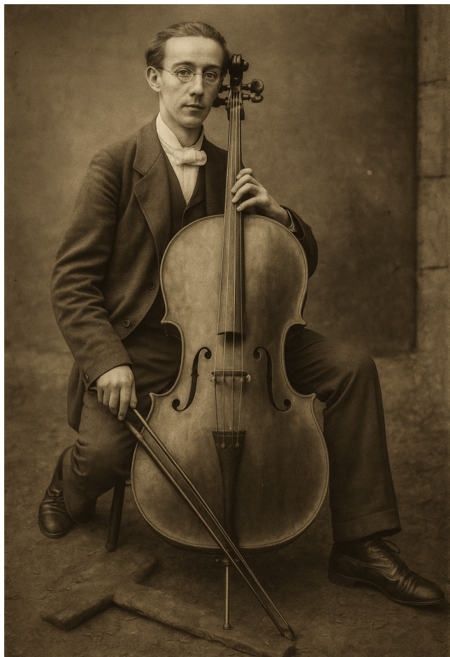
Slika 2. Jakov Gotovac u gimnazijskim danima

Kako je uopće došlo do toga da se proglašava zajednička Godina za dvojicu glazbenih veličina koji bez premca zaslužuju zasebna priznanja? Inicijativa za Tijardovićevu godinu javno je inaugurirana na promociji knjige Marina Kuzmića Ivo Tijardović: Život i vrijeme: memoari slavnog Splitsanina u svibnju 2024. u Hrvatskom domu, upravo u koncertnoj dvorani Ive Tijardovića (preimenovana ujesen 2023.). Igrom slučaja samo nekoliko dana prije u istoj dvorani tog splitskog glazbenog hrama održan je u okrilju Sudamje koncert- homage Jakovu Gotovcu Gradskog zbora Brodosplit s maestrom Vladom Sunkom na kojemu je prvi put predstavljena inicijativa realizacije spomenika Jakovu Gotovcu prema 18 godina starom nagrađenom radu autora Petra Barišića zaboravljenom u škafetima administracije. Bilo je jasno kako i Gotovac i Tijardović zaslužuju počast. Postavilo se pitanje kojem od njih dati prednost. U razgovoru s domaćim sviton osjetne su simpatije prema Tijardovićevim operetama koje su im bliže, familijarnije. Ali, struka će stati na Gotovčevu stranu, koji je najveći i najizvođeniji hrvatski skladatelj svih vremena.