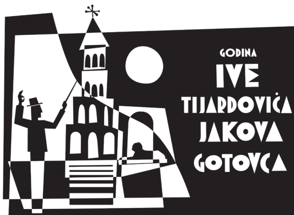
Slika 3. Logotip Godine Ive Tijardovića i Jakova Gotovca, autor Mile Modić

Ideja je bila motivirati, animirati sve splitske institucije i ustanove, ali i udruge i pojedince, da svatko u svojoj domeni i na različite načine osmisle programe kojima će remini-scirati ostavštinu dvojice glazbenika koji su ostavili izniman pečat na ukupni ovdašnji fenotipski habitus koji nas kodira rođenjem poput specifičnog tonaliteta utkanog u DNA. Partneri Grada Splita u tom su velebnom pothvatu tri institucije kao nositelji kompleksnijih programa: Hrvatsko narodno kazalište, Hrvatski dom te Umjetnička akademija Sveučilišta u Splitu.