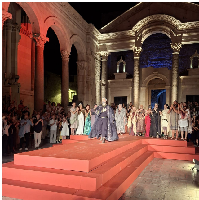
Slika 15. 71. Splitsko ljeto: Premijera Tijardovićeve opere Dioklecijan