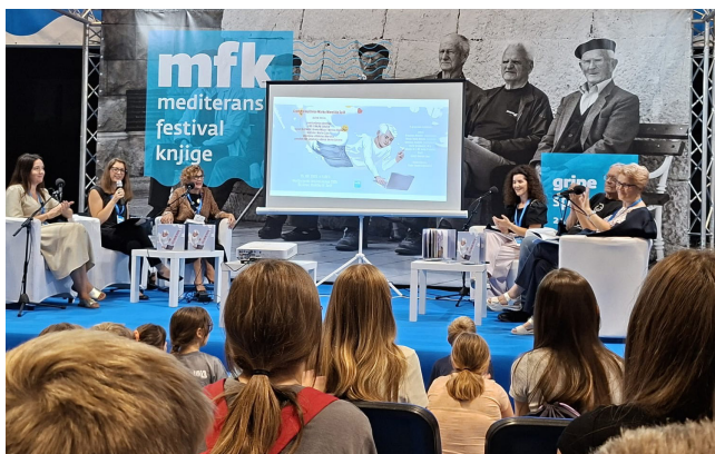
Slika 21. Promocija slikovnice Ero s online svijeta

Sretni smo što je slikovnica od objavljivanja do kraja 2025. putovala Hrvatskom – od Splita preko Zagreba do Pule, a ušla je i na B listu Ministarstva kulture i medija pa će je mnoge hrvatske knjižnice imati u svom fondu. Sretni smo što nas je Jakov Gotovac još jednom spojio moćnom ljepotom svoje glazbe.