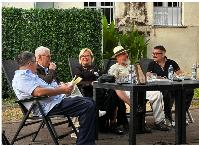
Slika 18. Predstavljanje knjige Ivo Tijardović: Libreta splitskih opereta

Na kraju se Kuzmić osvrnuo i na kazališnu praksu nekih davnih vremena, kada su se libreta tiskala kao elegantne knjižice, nerijetko s luksuznim uvezom i zlatotiskom te je podsjetio kako su Tijardovićeve libreta nekoć izlazila i u dnevnim novinama u nastavcima te bila vrlo čitano štivo. „Zbirka koju predstavljamo“, prema riječima priređivača, „dio je promišljenog, sistematskog nastojanja da se Tijardovićevo djelo predstavi javnosti u punom sjaju i kontekstu.“