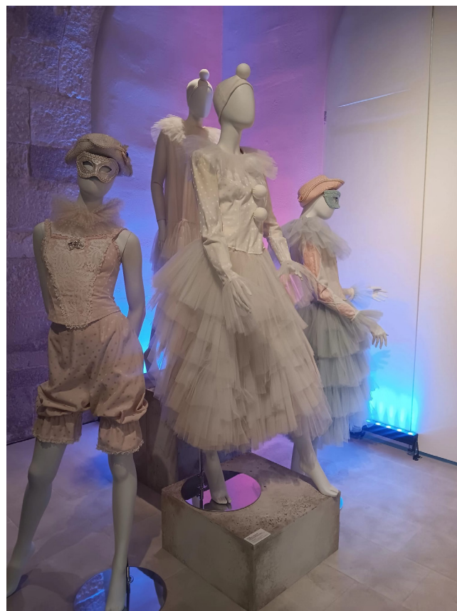
Slika 12. Iz postava izložbe Tijardović i Gotovac: od note do kroja