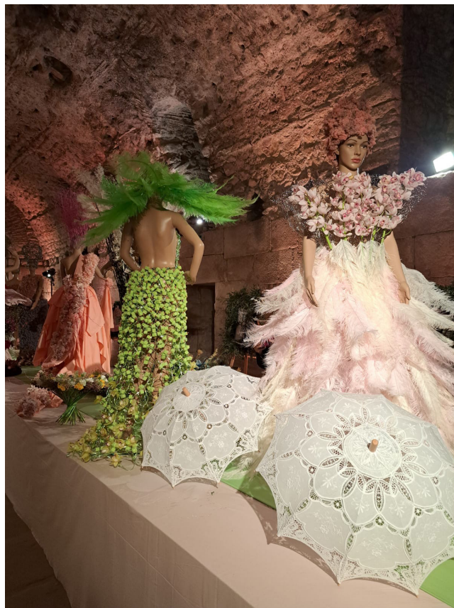
Slika 5. Praznik cvijeća Flora Mye

Sve je započelo u Dioklecijanovim podrumima omiljenom proljetnom manifestacijom Splicišana s bogatom tradicijom – 48. praznikom cvijeća pod naslovom Flora Mye , u organizaciji Udruženja obrtnika Split, na kojoj su floristi inspirirani Tijardovićevim likovima i njihovim kostimima priredili čarobnu cvjetnu uvertiru za Godinu. Raskošne florističke instalacije posjetitelje su oduševile unikatnim bajkovitim rješenjima. Po završetku manifestacije trajni dijelovi izložbe, dvadesetak uvećanih arhivskih fotografija s prizorima iz opera i opereta uramljenih lovorima na štafelajima te dvadesetak Tijardovićevih crteža kostima i scenografskih rješenja printanih na velikim platnima prebačeni su u sjedište gradske uprave, u atrij zgrade Banovine, kao samostalna izložba koja se tu zadržala dulje od mjesec dana. U želji da ovu izložbu naslovljenu Spli'ska dota o' crteža i nota vidi što veći broj građana, prebacili smo je u svibnju, obogaćenu informativnim panoima, u frekventni izložbeni prostor splitskog prodajnog centra City Center one.