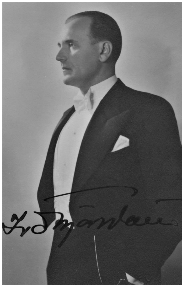
Slika 1. Maestro Ivo Tijardović

Pritom se rijetki vrte nekoliko koraka unatrag i zavire u prethodno poglavlje splitske kajdanke – nezamjenjivo identifikacijsko mjesto ovdašnjeg stanovništva koje su ispisala dvojica vrsnih skladatelja, Ivo Tijardović i Jakov Gotovac, „sinovi“ splitskog Muzikalnog društva Zvonimir te učenici glazbenih autoriteta s početka 20. stoljeća: gimnazijskog profesora i voditelja zbora Antuna Dobronića, koji im budi zanimanje za narodnu glazbenu tradiciju, utemeljitelja prve privatne glazbene škole Armanda Meneghella-Dinčića, u kojoj uče svirati instrumente, zatim dirigenta Ćirila Metoda Hrazdire, koji ih podučava instrumentaciji i dirigiranju, te glazbenog pedagoga, skladatelja, dirigenta i animatora maestra Josipa Hatzea, koji ih u pjevačkoj školi upoznaje s talijanskom operom.