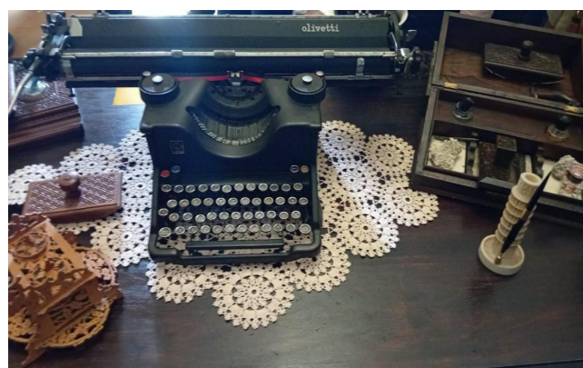
Slika 3. i Slika 4. Radna soba Vojmila Rabadana u Zaprešiću

Prolog libreta počinje sa Serenellom, koja se u operi pojavljuje nakon jedanaest taktova glazbenog uvoda nakon kojih se u drugom taktu broja jedan pojavljuje Serenella, koja donosi Marku Polu pribor za pisanje. U tom dijalogu između Serenelle i Pola glazbeno je dominantna Serenella,