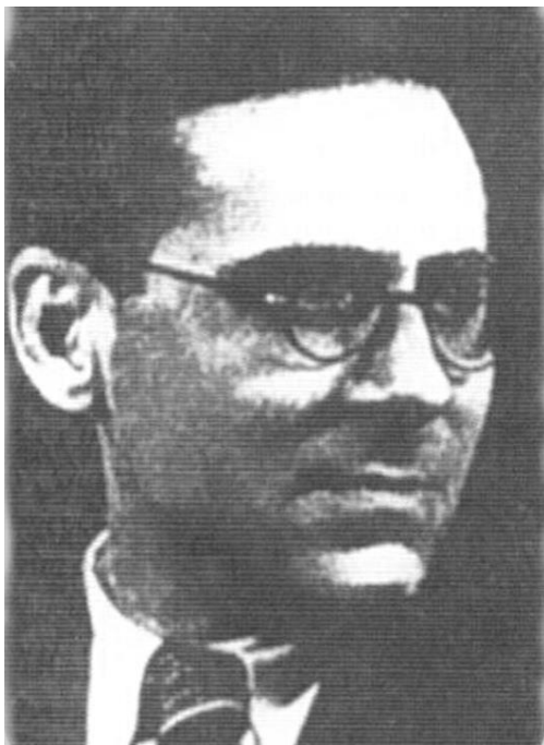
Slika 2. Vojmil Rabadan (Split, 31. srpnja 1909. – Zagreb, 5. siječnja 1988.) https://www.glas-koncila.hr/teatroska-kulturno-estet-ska-misija-5-sijecnja-1988-umro-vojmil-rabadan/ (pristup 1. listopada 2025.)

na svojem posjedu u dvorcu Marijini dvori u Zaprešiću. Činjenica da se Rabadanova ostavština čuva upravo u samostanu ne treba čuditi s obzirom na to da su odgojni zavodi i škole časnih sestara milosrdnica bili aktivni u očuvanju kazališne scene i prije rata. To je vrlo znakovit podatak jer je vrijeme komunizma karakteristično upravo po nemoćnosti slobodnog i jasnog mišljenja i govora u narodu. 19 Stoga se umjetnička ostavština vrlo često čuvala u Crkvi.