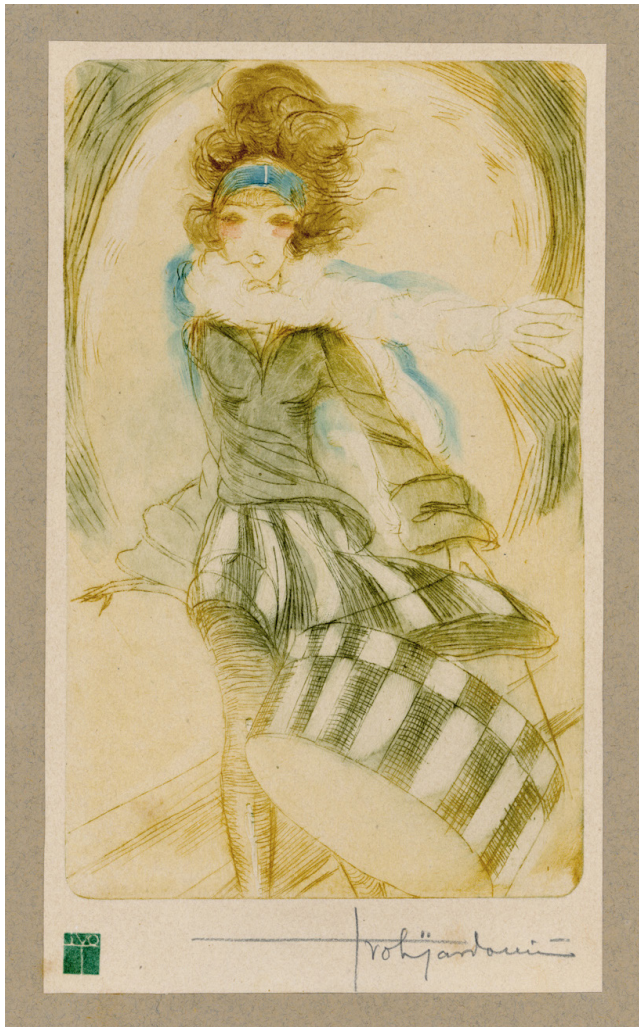
Slika 14. Iz mape Macchiette , 1923.