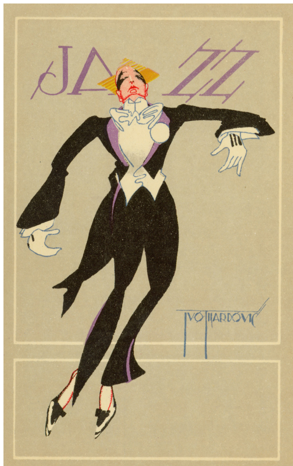
Slika 12. Razglednica Jazz

Tijardović je te dopisnice, po svemu sudeći, mogao nabaviti tijekom svojeg pariškog boravka. Očito je mogao imati afinitet prema prikazima na njima, premda nam se stilske sličnosti čine pregeneričkim.