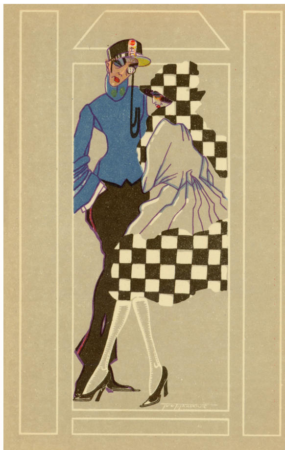
Slika 8. Razglednica Italija

Po Kečkemetovu sudu, Tijardovićeva najvrjednija likovna ostvarenja bila bi u serijama od sedamdesetak razglednica u art déco stilu. Prve dvije serije razglednica izdao je Orient Verlag u Beču, a ostale, od treće do osme, Edition Čaklović u Zagrebu i Beču. Kečkemet detaljno analizira i sadržajne razlike među tih osam serija. Treća serija razglednica, na primjer, prikazuje parove u stiliziranim vojničkim odorama i modnoj odjeći iz početka dvadesetih, predstavljajući zemlje različite zemlja (Jugoslavija, Rusija, Poljska, Čehoslovačka, Rumunjska, Engleska, Grčka, Francuska, Amerika, Austrija, Italija i Njemačka). 33