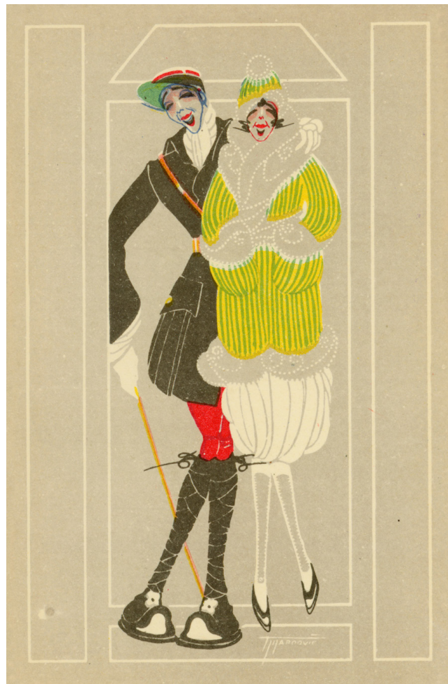
Slika 10. Razglednica Grčka

Tijardovićevi akvarelirani crteži balansiraju između stiliziranog realizma i karikature, ne ismijavajući, već bilježeći društvene pojave i politička pitanja specifičnim likovnim