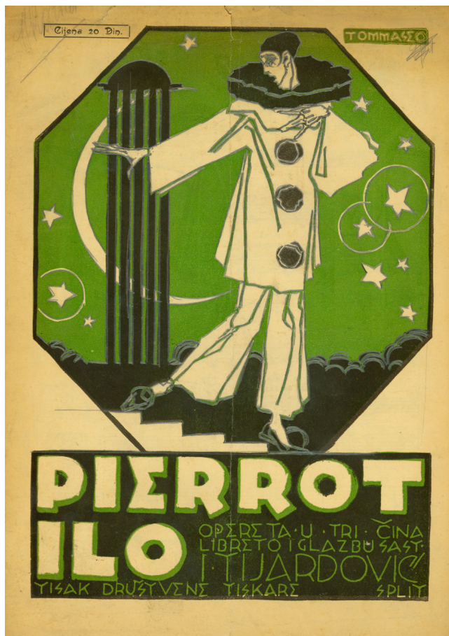
Slika 2. Ivo Tijardović, Pierrot Ilo