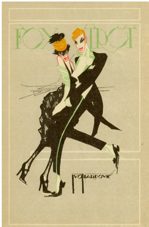
Slika 11. Razglednica Foxtrot

Kečkemet je u knjizi donio reprodukciju dviju od tih japanskih dopisnica. Prva prikazuje ženu koja sjedi na leđima slona koji se sklupčao poput psa. Preuzeta je s jednog svitka koji je oslikao Maruyama Ōkyo (1733. – 1795.), slikar koji je nastojao spojiti zapadnjački realizam s tradicionalnim japanskim dekorativnim stilom, stvarajući prepoznatljiv pristup prikazu prirode i ljudskih likova. Bio je jedan od prvih japanskih umjetnika koji je slikao nage modele po promatranju, što se smatralo kontroverznom. Njegova upotreba svjetla i sjene te stvaranja volumena bez obrisa, pridonijele su osjećaju neposrednosti i realizma, a upravo su ti elementi mogli privući europske slikare oko 1900-ih, posebno impresioniste, koji su otkrivali japanski minimalizam, upotrebu praznog prostora i stilizirani a prirodni prikaz figura. Druga reprodukcija prikazuje pratiteljicu neke dvorske dame, s veličanstvenom krunom u rukama. Rađena je po koloriranom drvorezu Kitagawe Utamare (c. 1753. – 1806.), jednog od najcjenjenijih umjetnika ukiyo-e drvoreza i slika, najpoznatijem po svojim bijin ōkubi-e prikazima ljepotica i kurtizana velikih glava iz 90-ih godina 18. stoljeća. Njegova umjetnost stigla je u Europu sredinom 19. stoljeća, gdje je