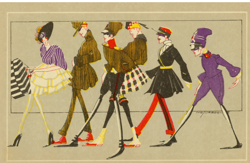
Slika 6. Razglednica Na pariškom bulevaru

Duško Kečkemet u monografiji Nepoznati Tijardović otkriva malo poznati likovni opus Tijardovića iz 20-ih godina 20. stoljeća, koji je nezasluženo ostao u sjeni njegova skladateljskog rada, ističući njegovu vrijednost i značaj, koji su bili zanemareni u širim pregledima umjetnosti tog razdoblja, posebno u okvirima hrvatskog art déco a 20-ih godina (a koji on krsti „avangardnim stilskim doprinosom”). 30 Knjiga je donijela više od sto i osamdeset obojenih crteža, novinskih ilustracija, grafika i razglednica iz arhiva Sveučilišne knjižnice u Splitu, Hrvatskog glazbenog zavoda, Galerije umjetnina u Splitu i privatnih zbirka.