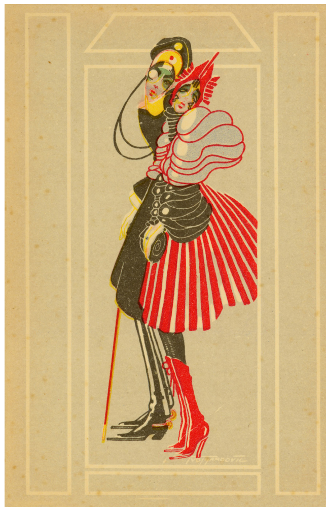
Slika 7. Razglednica Njemačka

provincijske erudicije – danas posve podcijenjen i kod mlađih čak prezren – bez koje nema napretka opće povijesti umjetnosti ni ozbiljne zaštite kulturno-povijesne baštine. Duh doba koje danas prizivamo iz boce s etiketom „Tijardović”, nitko nije cjelovitije analizirao od njega i mislim da je teško i zamisliti što bismo znali čitavom kontekstu tog vremena – govorimo o epohi između dvaju svjetskih ratova – bez njegova pisanja jer to vrijeme nikakvo arhivsko istraživanje neće moći rekonstruirati bez izravnih uvida i evokacije tolikih živih razgovora koje je Kečkemet vodio s protagonistima toga doba.