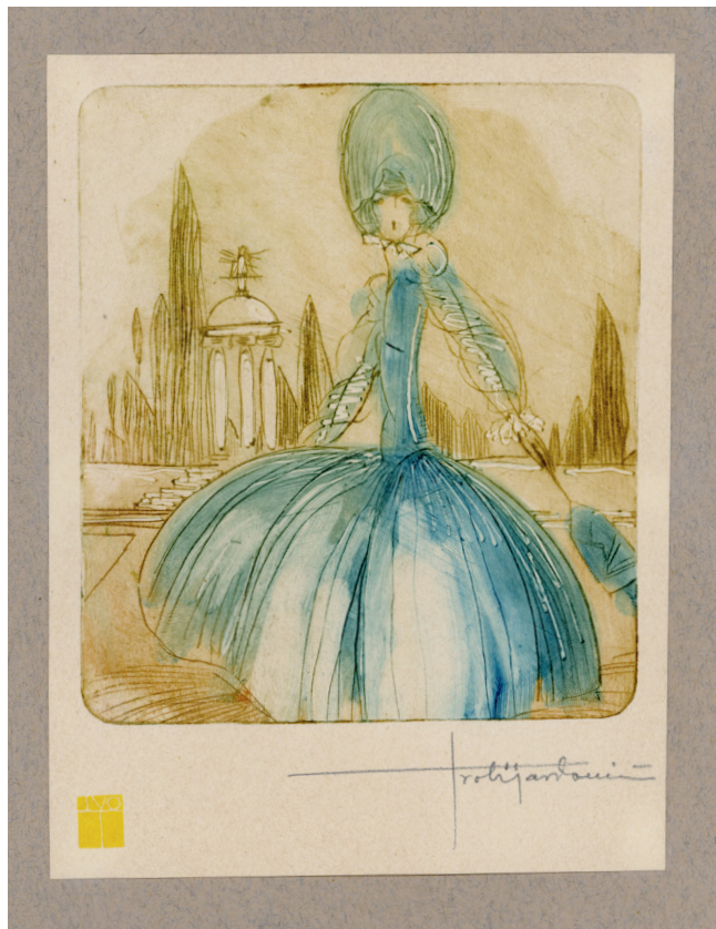
Slika 13. Iz mape Macchiette , 1923.

g. Tijardovića opažamo vazda neku ugodnu crtu, koja nas podsjeća na slične radove engleskih i talijanskih macchiettista i koja pristaje osobito zgodno u ovo doba kad se i u modi vraćamo lijepim zaokruženim linijama odijela, pokućstva i ureda." 39