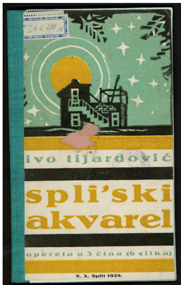
Slika 5. Ivo Tijardović, Spli'ski akvarel

talijanskog jezika, dijeleći grad na dva suprotstavljena svijeta, izazivajući napetosti, sukobe i tučnjave, pa i tijekom svetkovina, a posebno usred karnevala, kad su se otimala zastave i čak bacali glazbeni instrumenti. Ta prisjećanja neumitno završava konstatacijom: