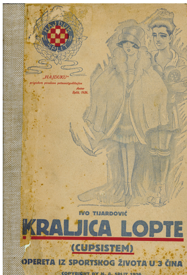
Slika 4. Ivo Tijardović, Kraljica lopte

po svim našim primorskim gradovima i selima. Tijardovićeve napjevi potisnuli su zauvijek u zaborav talijanske pjesmice, koje nam je do pred kratko vrijeme nosilo Trst: „ Comare, che boro ”, „ O giovanotti, piangete ”, „ Antonio Freno ”, poslijeratne „ Canarere ” i slične napjeve, koji su ovom narodu na starijem kroju nezasluzeno doveli običaje Bastarda, zamuknule zauvijek, a umjesto njih odzvanjaju danas zvuci Tijardovićeve skladbe, među kojima: „ Daleko mi je moj Split ”, „ Oj, kućo mala! ”, „ Perina štrampera ” i t. d. Kad ne bi ništa drugo – nego samo ovo mogli Tijardoviću upisati u dobro, bio bi on već samim tim uvelike zadužio svoj rodni kraj.” 25