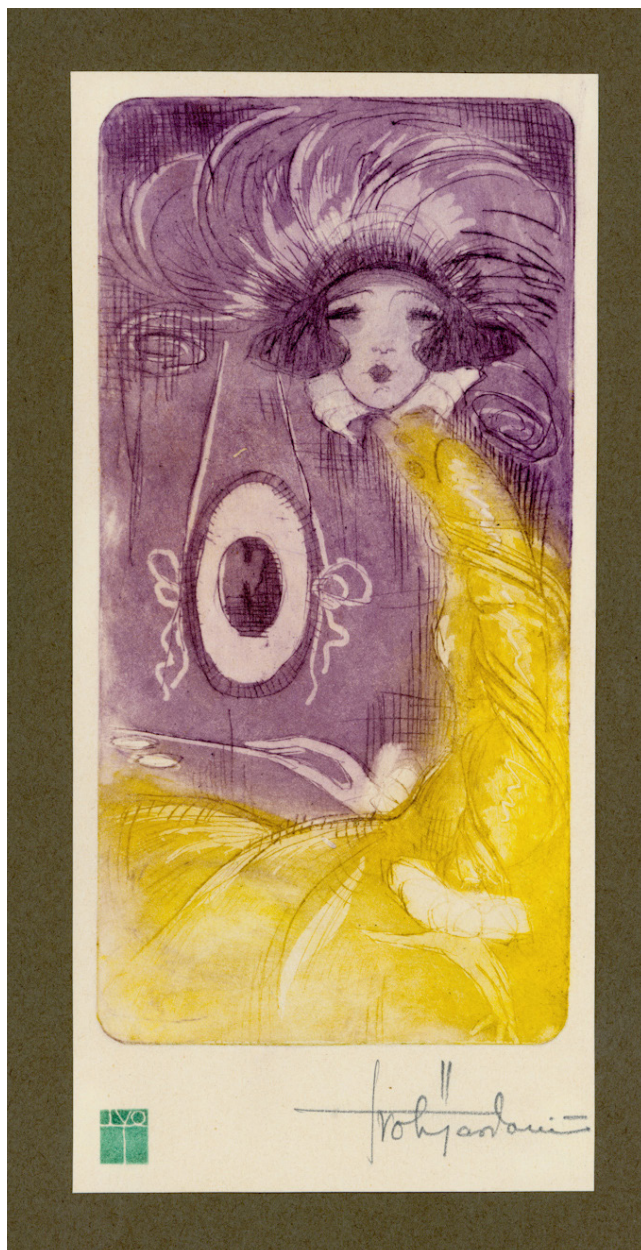
Slika 3. Iz mape Macchiette , 1923.

U popularnoj bečkoj reviji Faun objavio je 1920. i 1921. godine niz duhovitih koloriranih virtuoznih crteža (redakcijski potpisanih – „Zeichnung von Ivo Tijardović“), koji zrcale život poslijeratne metropole i mondenog europskog društva. Crta i modele za visokotiražni časopis Wiener Mode .