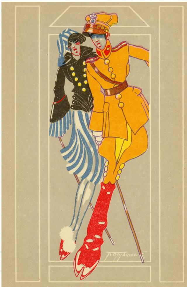
Slika 9. Razglednica Poljska