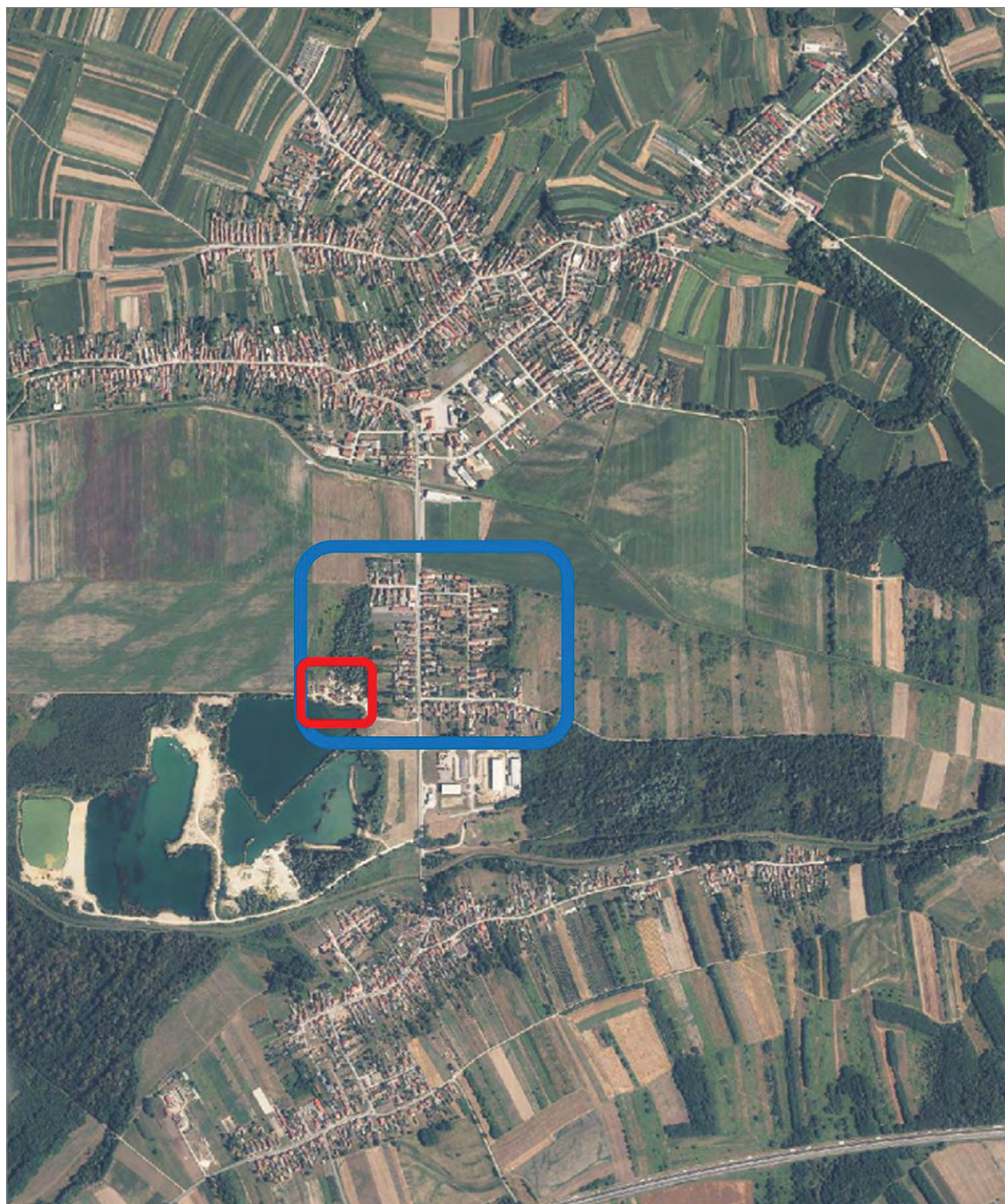
Fig. 2 The area of the Municipality of Domašinec with the location of Kvitrovec and the Roma settlement Kvitrovec Sl. 2. Prostor Općine Domašinec s naznačenom lokacijom Kvitrovca i romskoga naselja Kvitrovec