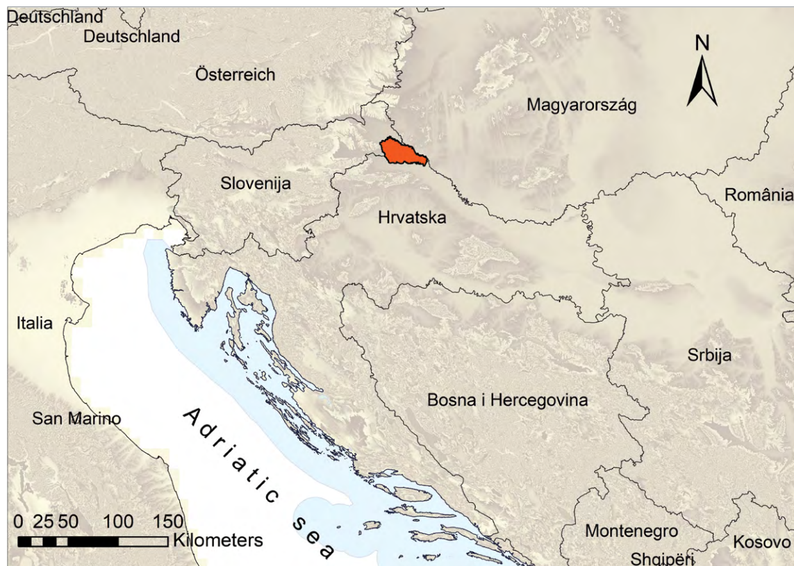
Fig. 1 Geographic location of the Međimurje County Sl. 1. Geografski smještaj Međimurske županije

naselja Kuršanec Šlezak donosi temeljna obilježja koja obuhvaćaju vrlo visok natalitet i niski mortalitet navedene populacije (Šlezak, 2010b). Isti autor 2013. upućuje na pozitivan utjecaj romske sastavnice u ukupnom kretanju stanovništva Međimurske županije (Šlezak, 2013). Detaljniju analizu prirodnoga kretanja, dobno-spolne strukture i ukupne stope fertiliteta romskoga stanovništva s procjenama za buduće razdoblje načinili su Šlezak i Belić (2019) upućujući na mogućnost da Romi u broju rođenih dostignu broj rođenih većinskoga stanovništva oko 2050. godine pod pretpostavkom zadržavanja sadašnjih stopa i trendova (Šlezak i Belić, 2019). Sva tri navedena rada unutar desetgodišnjega razdoblja upućuju na slična obilježja i trendove promjene u smislu niskoga mortaliteta i vrlo visokoga fertiliteta s tendencijom opadanja njegovih stopa. Obilježja prirodnoga kretanja, dakle, u skladu su s uočenim i predviđenim trendovima promjena.