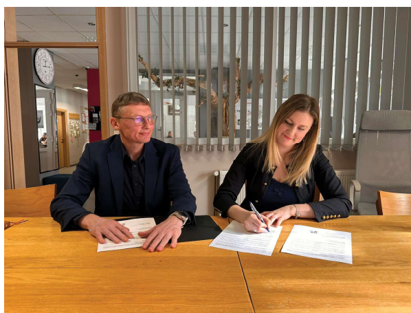
| Potpisivanje ugovora o suradnji

obnavlja i nadopunjuje. Standard također predviđa minimalno dva sata tjedne dostupnosti korisnicima uz odgovarajuću stručnu ili osposobljenu osobu koja koordinira rad stacionara. Tijekom svečanosti otvorenja stacionara, potpisan je Sporazum o suradnji između Knjižnice i Učeničkog doma kojim se definiraju prava i obveze obiju ustanova sukladno navedenom Standardu.