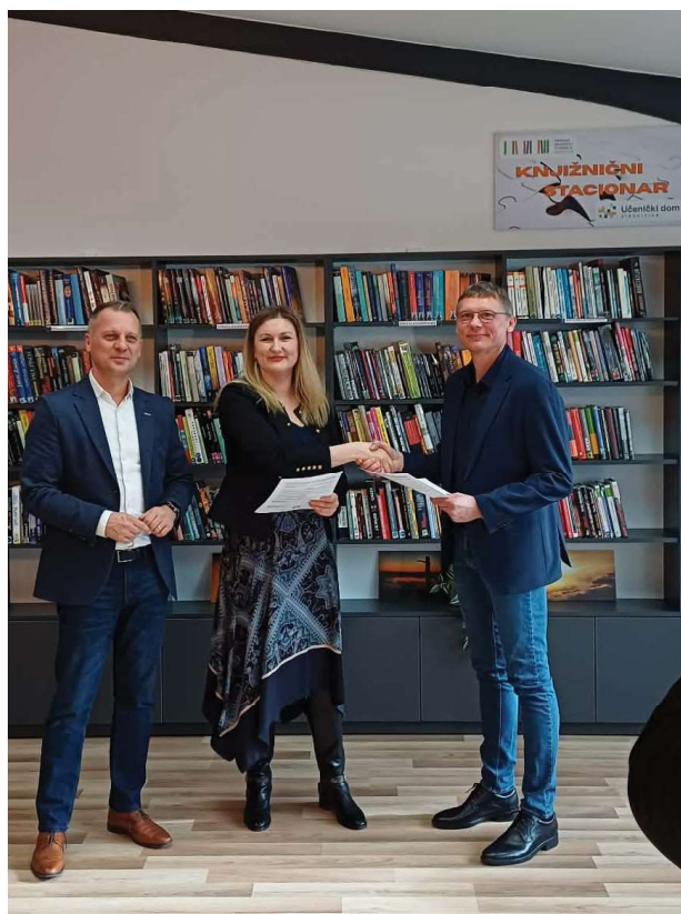
| Otvorenje knjižničnog stacionara

U Učeničkom domu Virovitica otvoren je knjižnični stacionar čime je učenicima omogućen svakodnevni i neposredan pristup knjigama i drugoj knjižničnoj građi u prostoru u kojem borave, uče i provode slobodno vrijeme. Projekt je ostvaren suradnjom Gradske knjižnice i čitaonice Virovitica te Učeničkog doma Virovitica, uz potporu Virovitičko-podravskve županije. Stacionar raspolaže s približno 600 jedinica knjižnične građe koja je prilagođena interesima i potrebama srednjoškolaca. Čine ga, većinom, knjige za mlade, beletristička i publicistička izdanja, stripovi i knjige na engleskom jeziku.