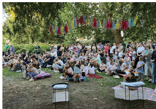
| Završna svečanost

Tim povodom, koprivničke su knjižničarke napravile evaluaciju projekta anketnim upitnikom u svim uključenim knjižnicama, a preliminarni rezultati na uzorku 103 roditelja pokazuju da 89,3 % roditelja smatra da je čitanje izuzetno važno za kasnija postignuća i školski uspjeh djeteta te da je čitanje iz užitka i zabave motivirajuće za dijete. Sudjelovanje djeteta u Olimpijadi čitanja s ocjenom „vrlo dobar“ ocijenilo je 27,7 % roditelja, a ocjenom „izvrstan“ 68,3 % roditelja. Na pitanje želi li njihovo dijete sudjelovati u programu i sljedeće godine, pozitivno odgovara 83,2 % roditelja. Mrežnu stranicu koristi 32,7 % ispitanika, a s ocjenom „vrlo dobar“ i „odličan“, ocjenjuje 87,9 % roditelja. Ovi rezultati istraživanja, kao i pozitivno ozračje završne svečanosti 10. ljetnog izazova čitanja, pokazuju kako se predanim radom Dječjeg odjela koprivničke knjižnice stvara zajednica mladih čitatelja te potiče ljubav prema knjigama i čitanju. Nadamo se kako će djeca i u višim razredima zadržati stečene navike, a njihova podrška, kao i podrška roditelja te stručnih suradnika najbolja su motivacija za daljnji razvoj programa. Program financijski podupire Ministarstvo kulture i medija Republike Hrvatske i Grad Koprivnica.