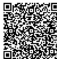
| Online slikovnica dostupna očitavanjem QR koda