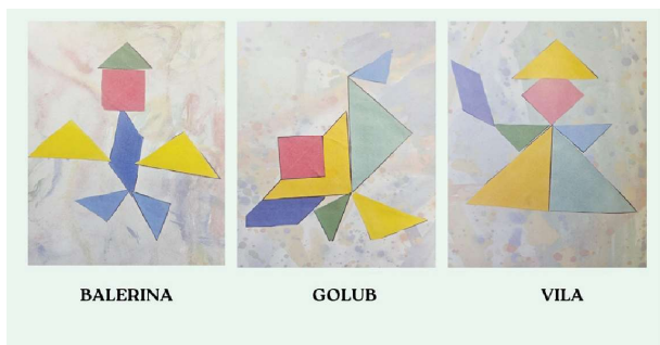
| Prikaz nastalih likova i pozadine

je bilo vrlo izazovno jer se neki od likova ponavljaju, a likovne površine su se mijenjale i sve je trebalo složiti smisljeno.