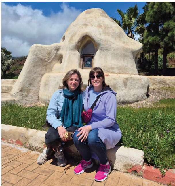
| Ispred bioklimatske građevine