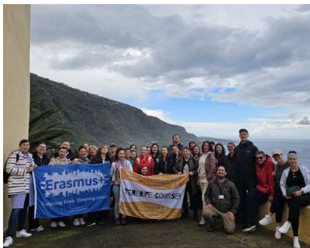
| Zajednička fotografija polaznika tečaja

U drugom dijelu terenske nastave, polaznici tečaja naučili su kako održati nastavni sat povijesti na otvorenom uz korištenje literature. Različitim dramskim tehnikama zajedno su ispričavali priču o nastanku Tenerifa i doseljavanju stanovnika.