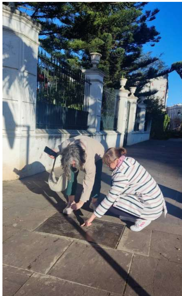
| Potruga za blagom u gradu La Laguna

Voditelj tečaja prikazao je polaznicima vlastite primjere popularnih igara u formi Escape rooma . Ovakve vrste igara koriste se u svrhu kombiniranja igre, učenja i istraživanja prirode. Polaznici su u digitalnom alatu Genially dobili priliku izraditi digitalne potrage za blagom povezane s lokacijama u prirodi. U poslijepodnevnom satima posjetili su povijesni grad La Lagunu u kojemu su se okušali u jednoj od igara. Sudionici su krenuli u potragu za blagom pristupivši zadacima koji zahtijevaju promatranje, donošenje odluka, poticanje kritičkog razmišljanja i rješavanja problema, poticanje aktivnog kretanja i istraživanja te unošenje odgovora u digitalni alat. Primjenom igrifikacije, upoznali su grad koji se nalazi na UNESCO-vom popisu svjetske baštine.